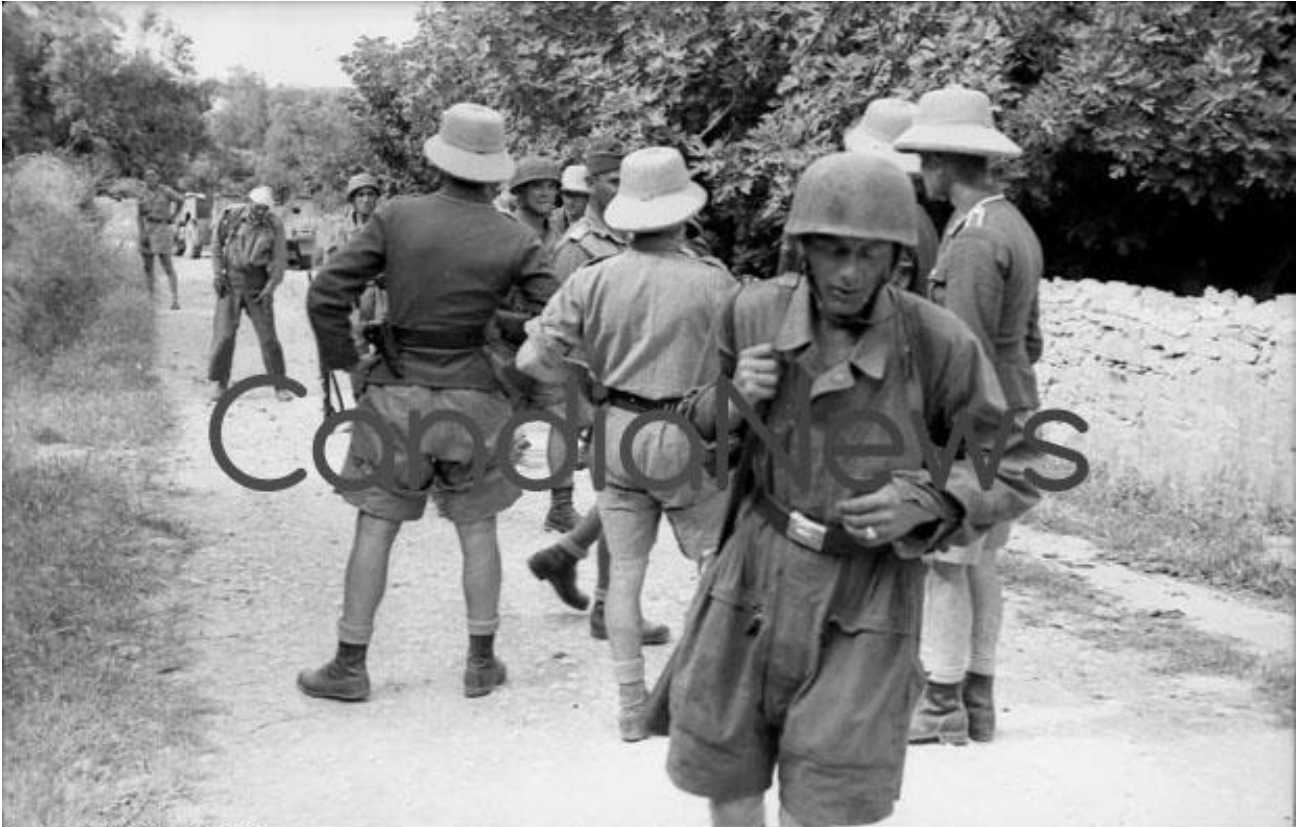
2. Juni 1941