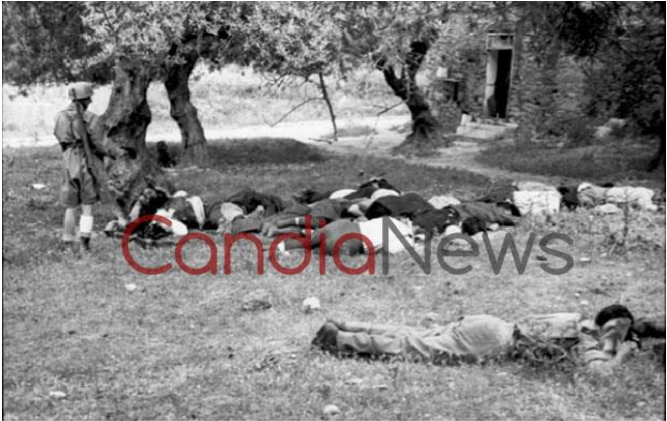
2. Juni 1941