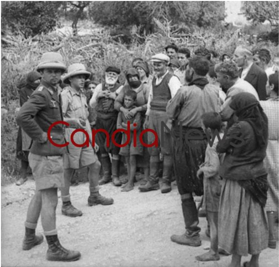
2. Juni 1941