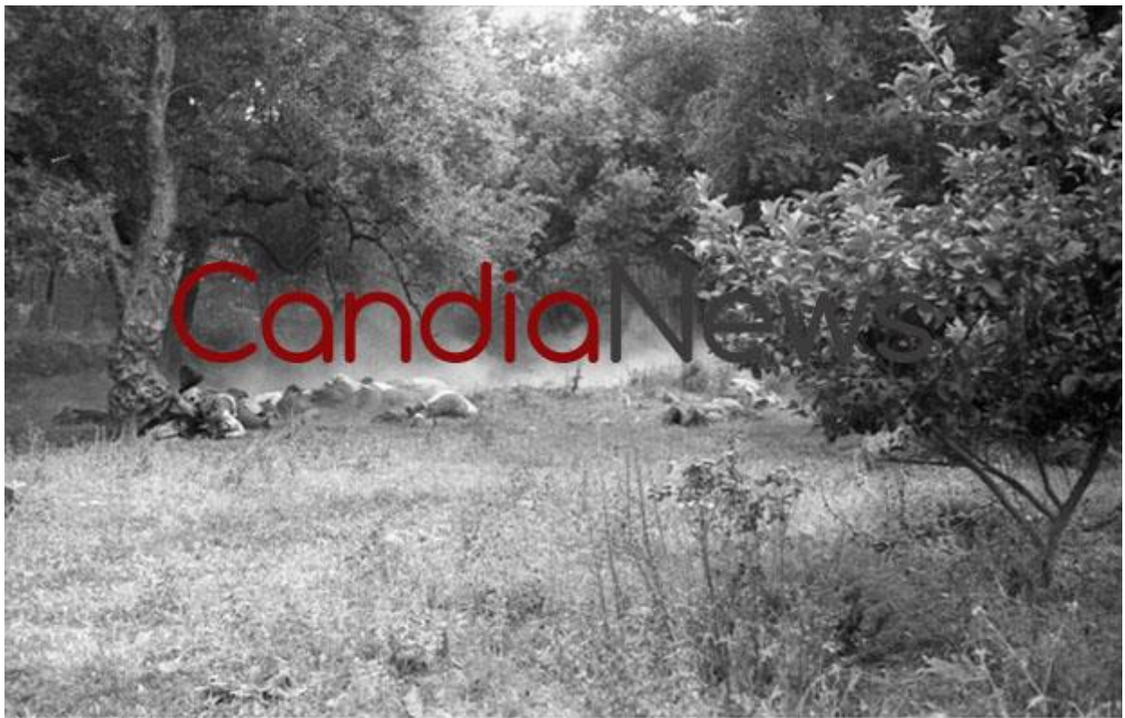
2. Juni 1941