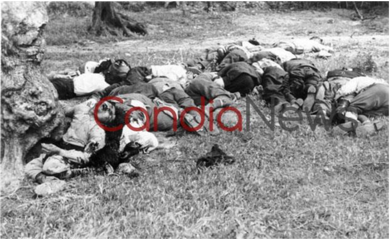
2. Juni 1941