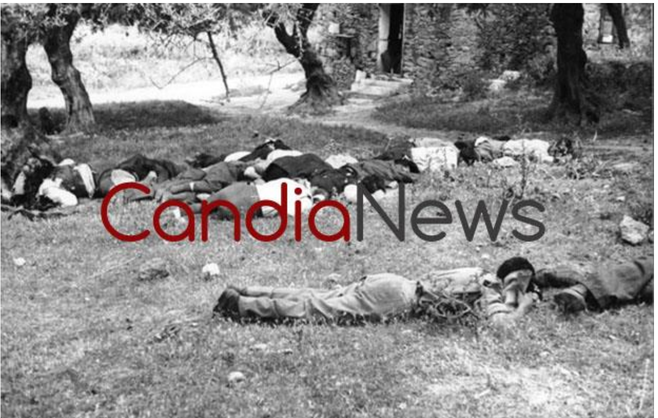
2. Juni 1941