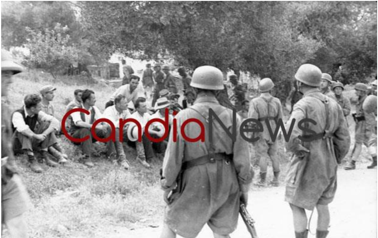
2. Juni 1941