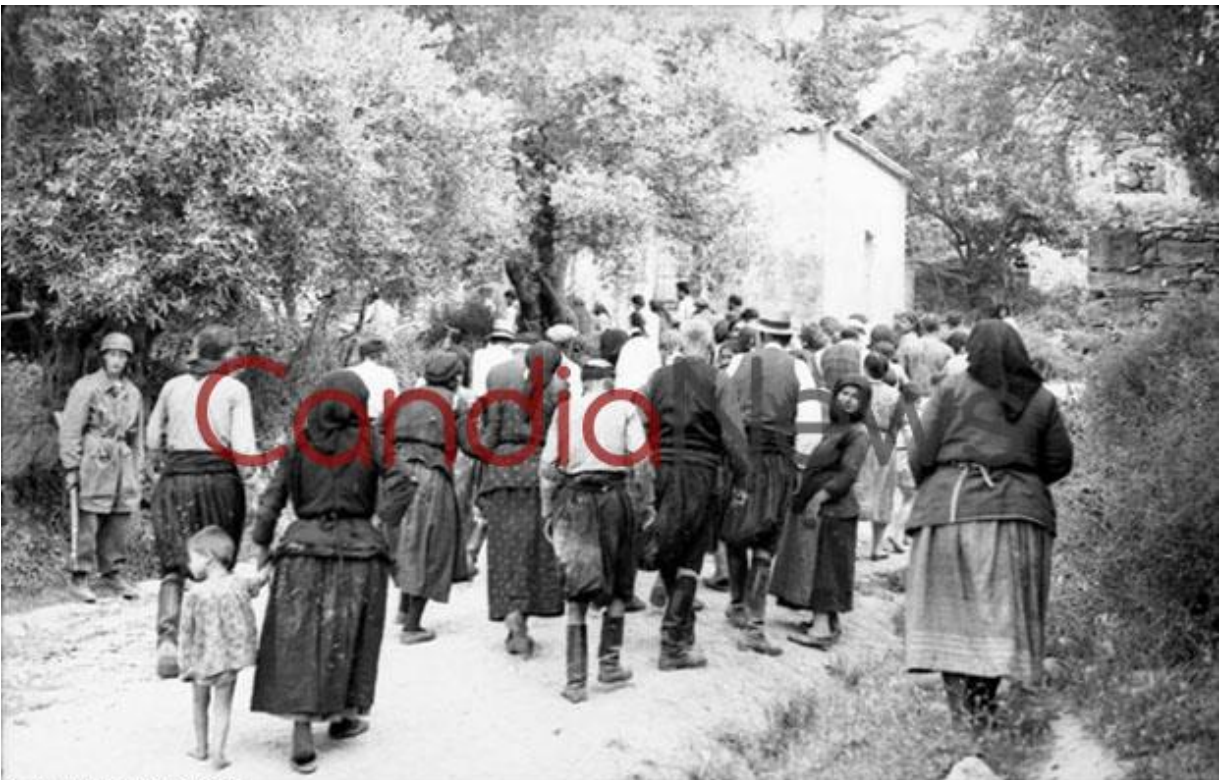
2. Juni 1941