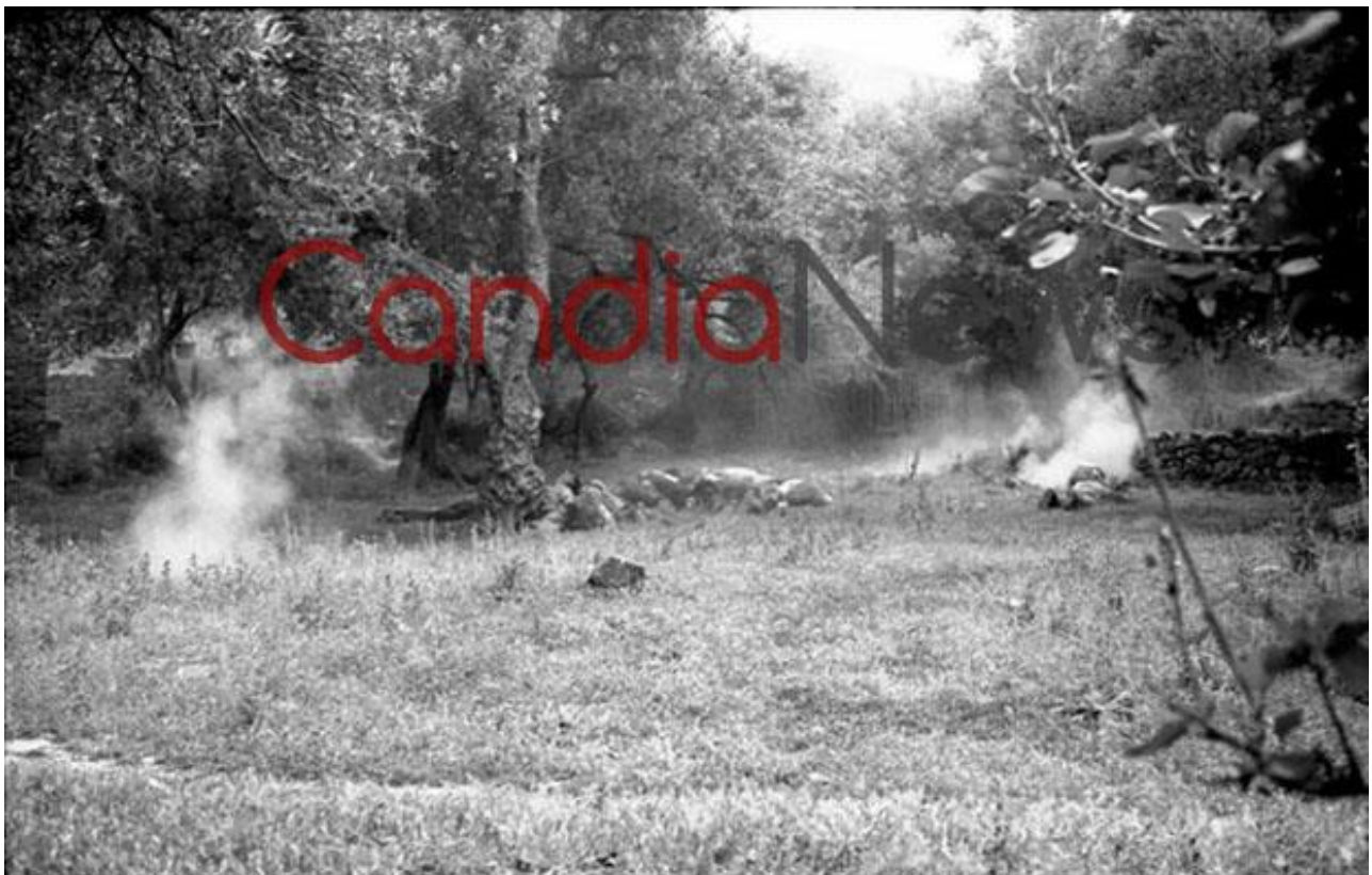
2. Juni 1941