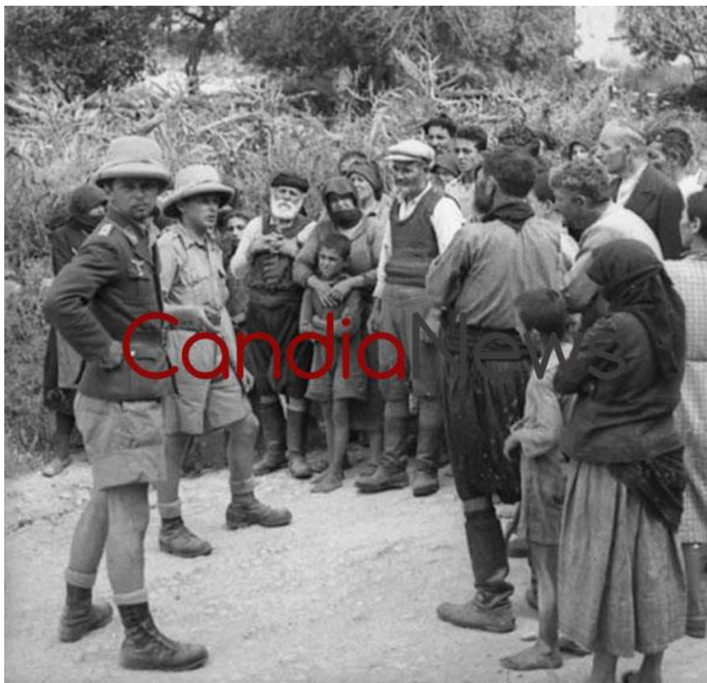
2. Juni 1941