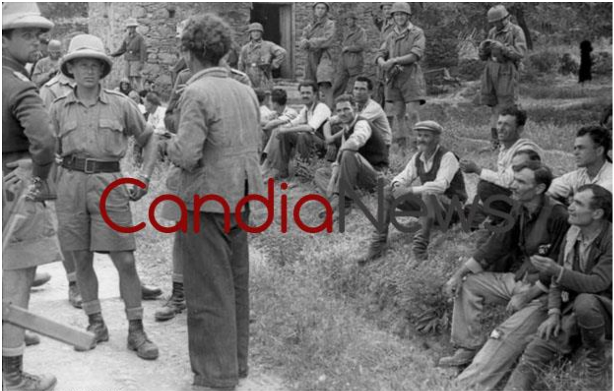
2. Juni 1941