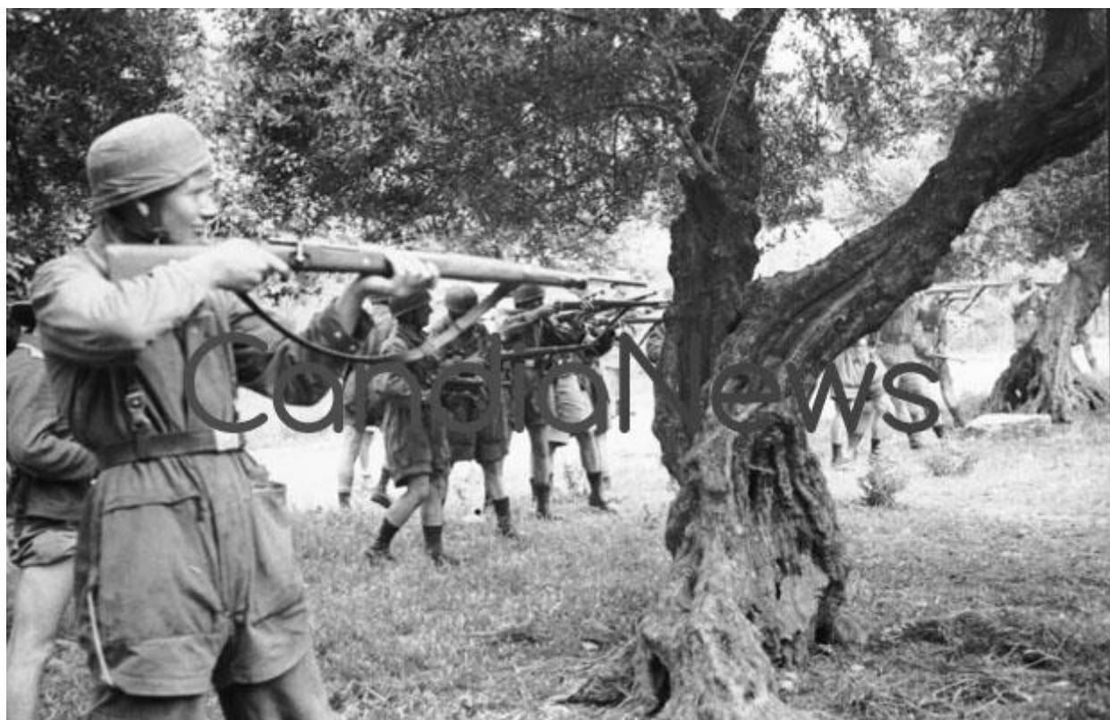
2. Juni 1941