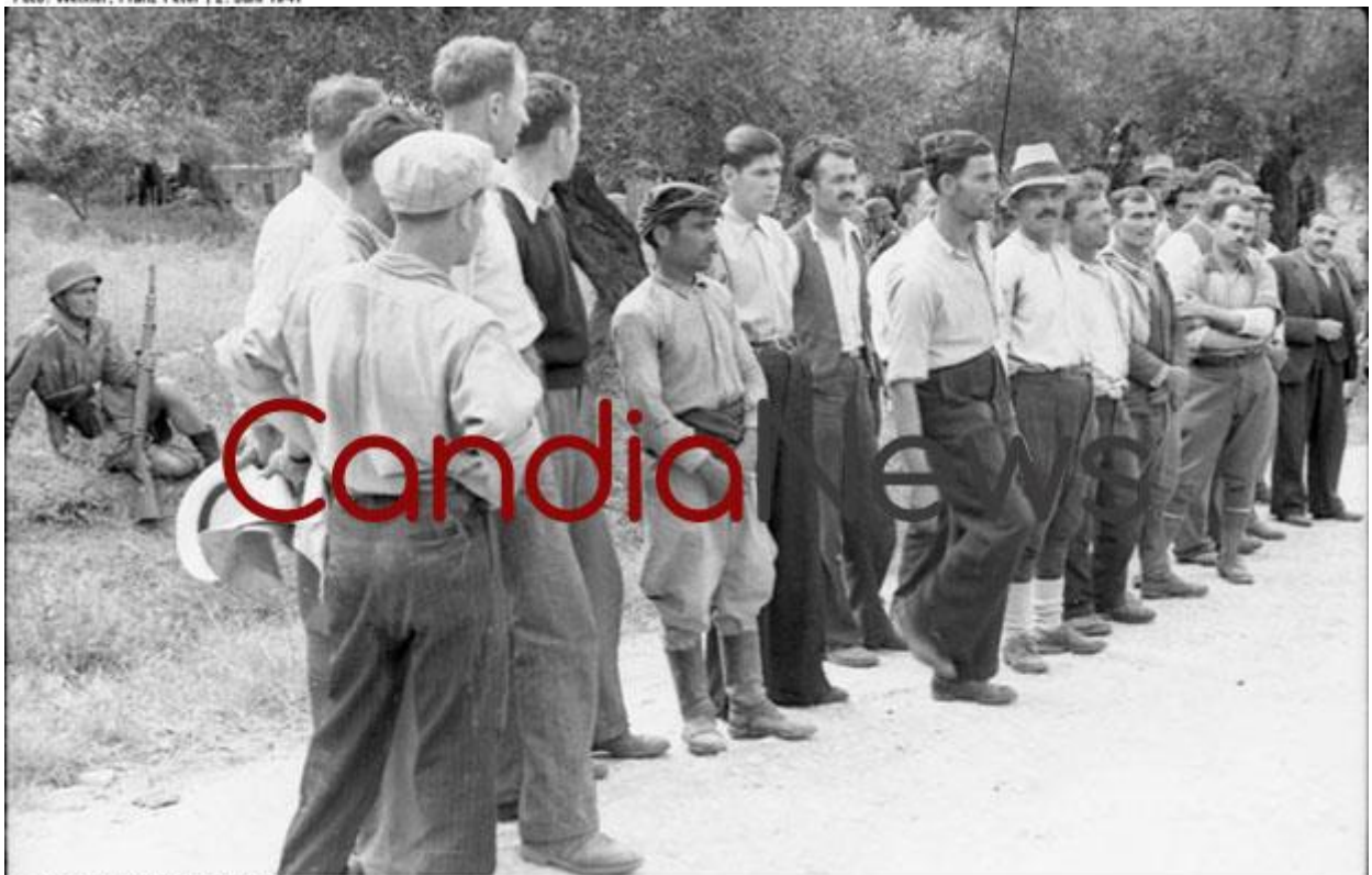
2. Juni 1941