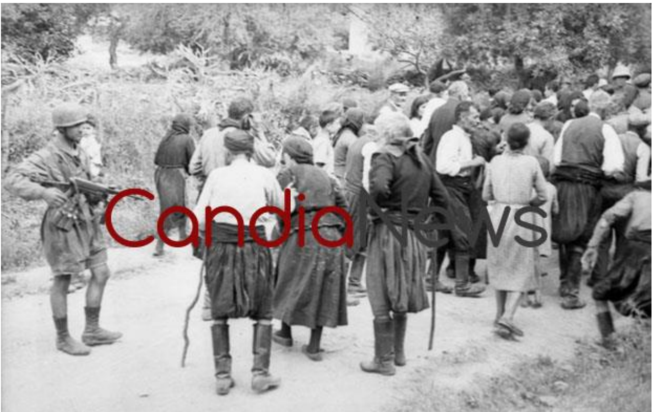
2. Juni 1941