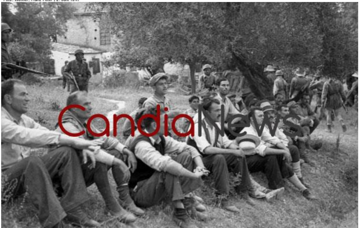
2. Juni 1941