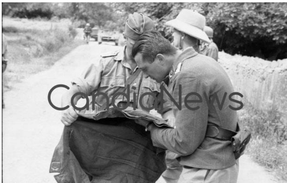
2. Juni 1941

Γερμανοί εξετάζουν ένα σακάκι με αίμα, κρίνοντας ένοχο το χωριό...