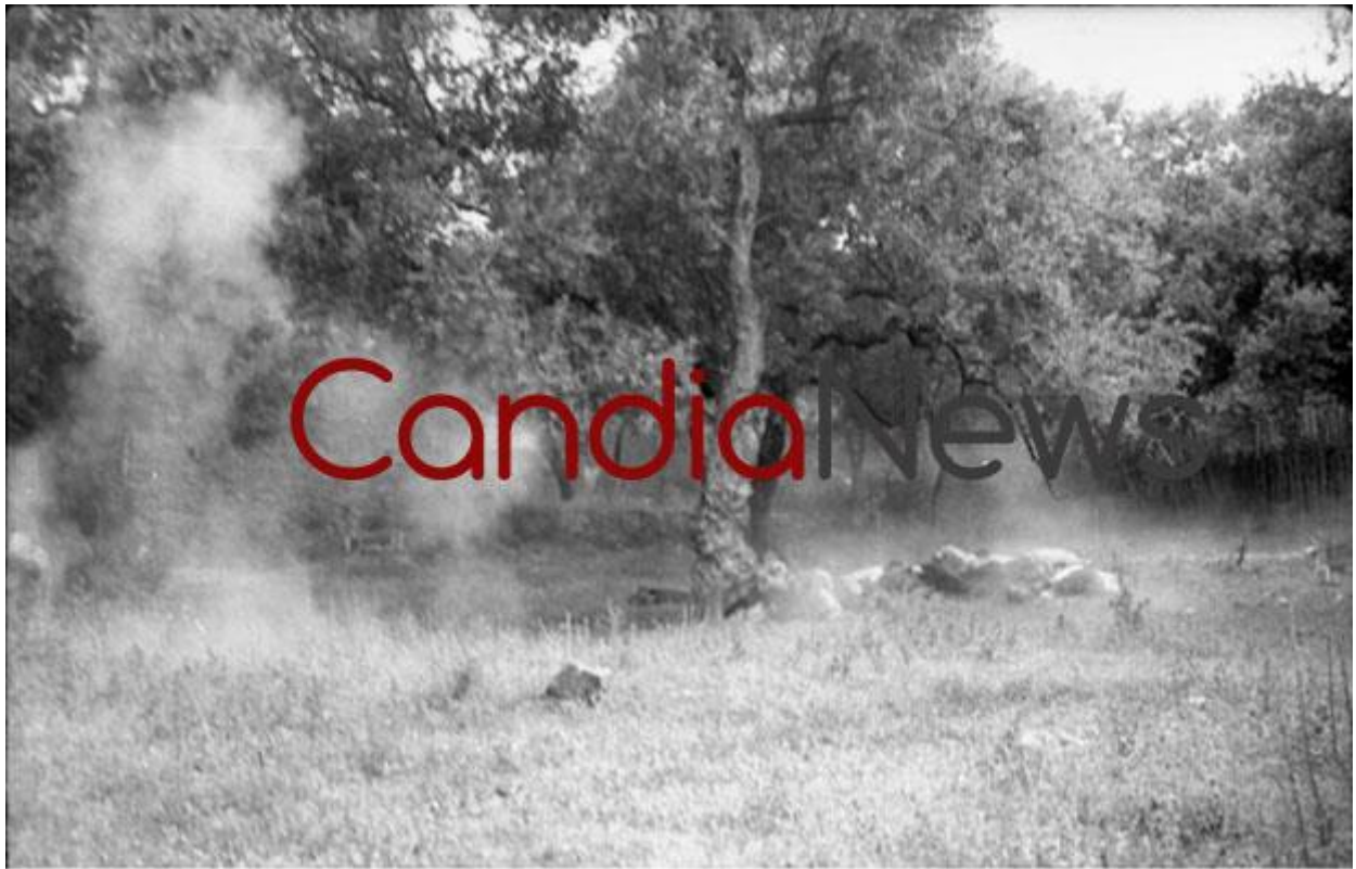
2. Juni 1941