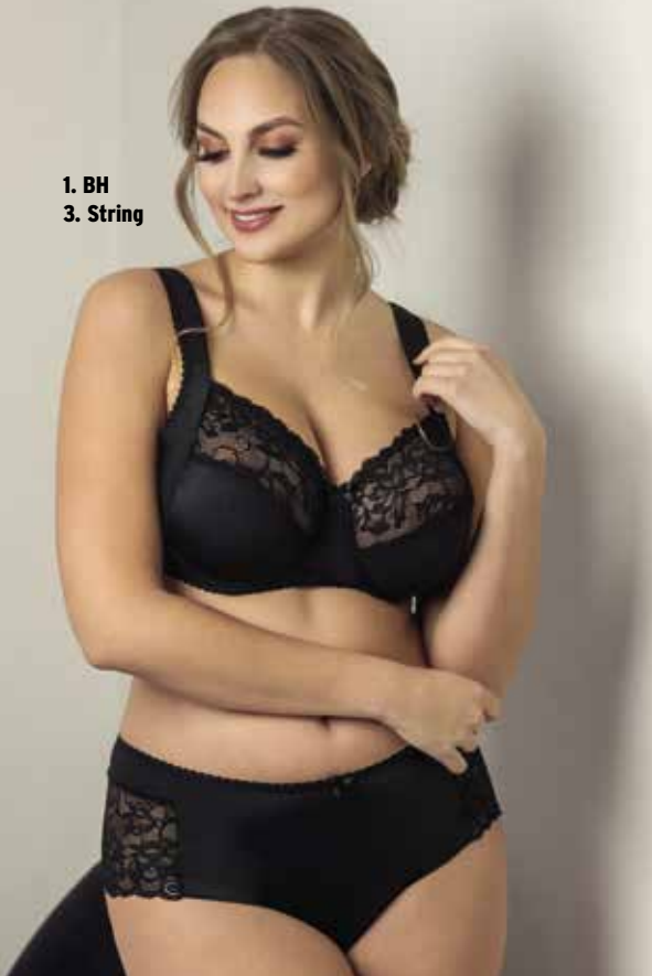
1. BH 3. String