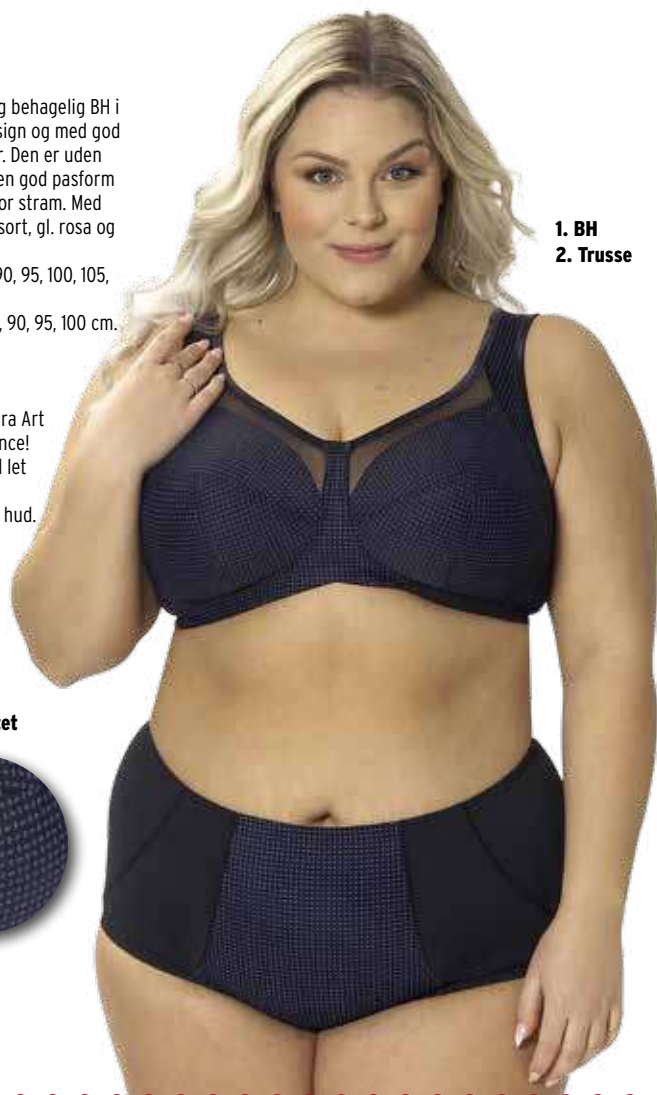
1. BH 2. Trusse