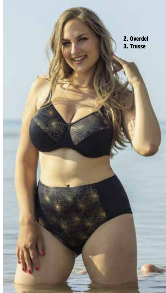
2. Overdel 3. Truse

3. Bikinitruse kr. 259 95 Bikinitruse (maxi) fra Plaisir og let foer foran. Fv. sort/guld. Str. 42 til 54. Kval. polyamid / elastan. Vask 30°. Vare nr. 24321-48