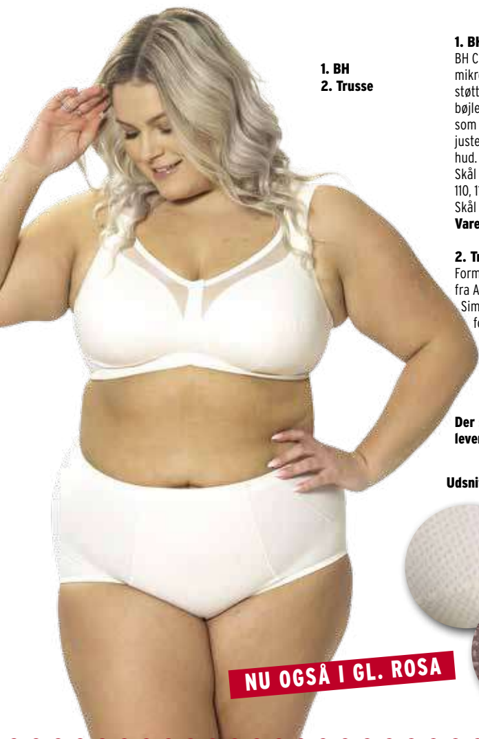
1. BH 2. Trusse