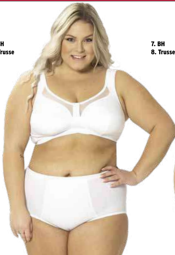
7. BH 8. Trusse