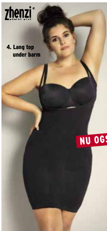
4. Lang top under barm