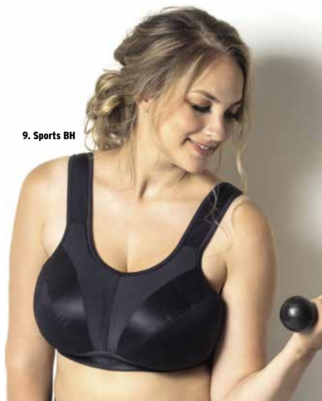
9. Sports BH

Der skal regnes med ekstra leveringstid op til 10 dage.