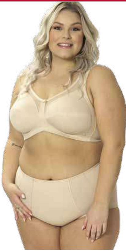
7. BH 8. Trusse