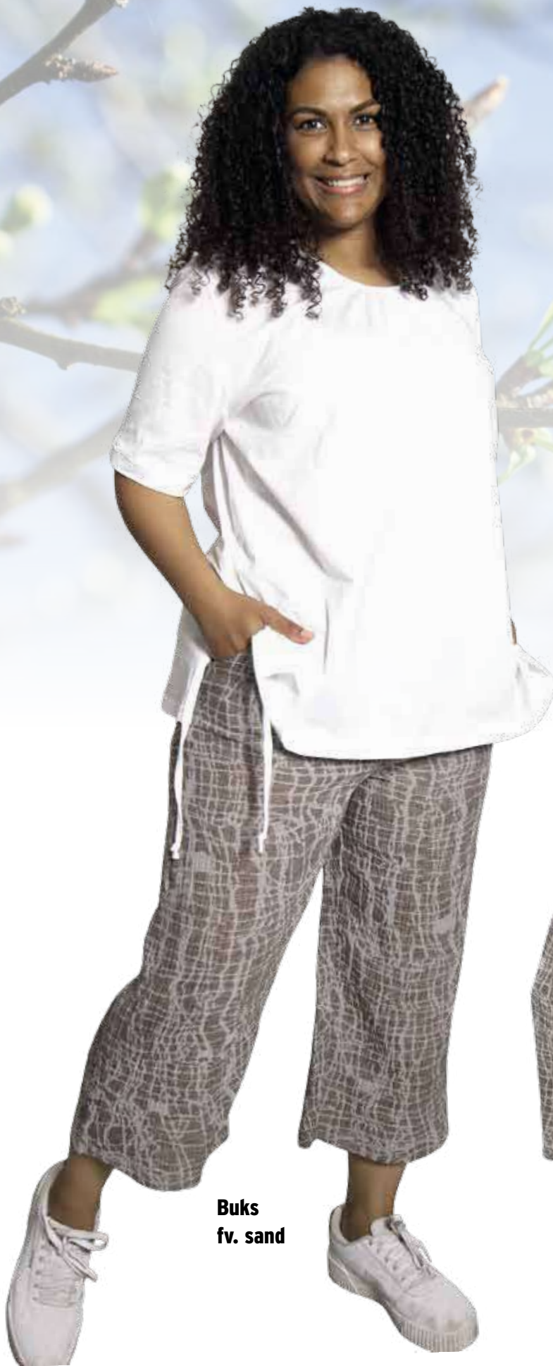
Buks fv. sand