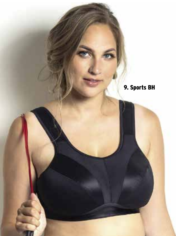
9. Sports BH