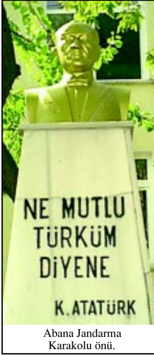
Abana Jandarma Karakolu önü.

'Allah Allah, bir çocuk geldi, Atatürk'le iki laf etti, sarmaş dolaş oldular. Atatürk'ü ağlattı. Kendisi de ağlıyor. Kimdir bu, neyin nesidir?' diyorlarmış. Sonra Atatürk onlara döndü: