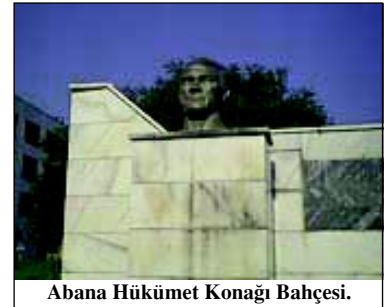
Abana Hükümet Konağı Bahçesi.