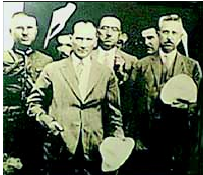
Atatürk İnebolu'da (25 Ağustos 2001'de İnebolu'da açılan bir sergiden)