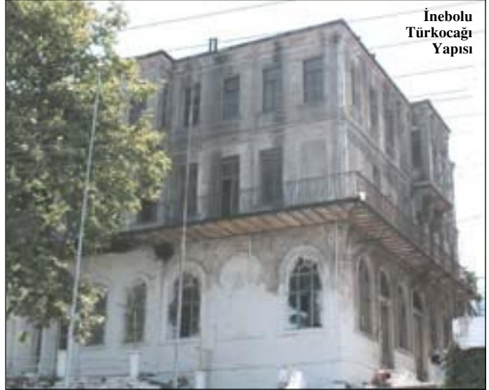
İnebolu Türkocağı Yapısı