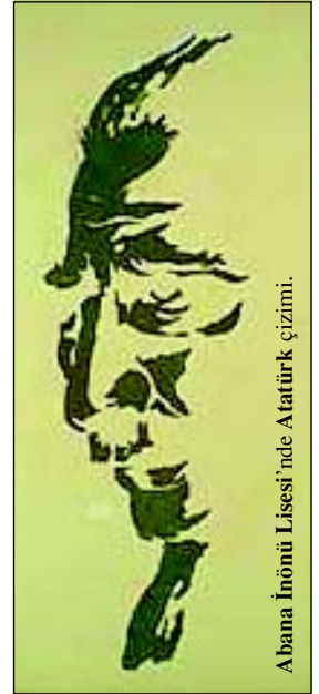
Abana İnönü Lisesi'nde Atatürk çizimi.

Atatürk devrimlerine candan inanmış olmalarıdır. Abana'daki halkevi çalışmaları, Abana'nın İstanbul 'la ilişkilerinin sürekliliği gibi nedenlerle Abana 'da devrim sevgisi hep canlı kalmıştır. Ulusal bayramlar büyük törenlerle kutlanmıştır. 1946 ve 1950 seçimlerinde Abana'dan beklediği oyu