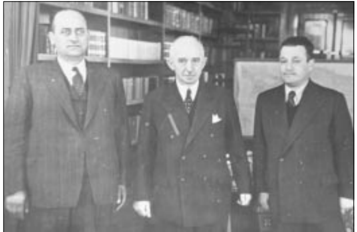
İsmail Ağaoğlu (Tosya), İsmet İnönü ve Fahri Yazgan (Varol Yazgan).