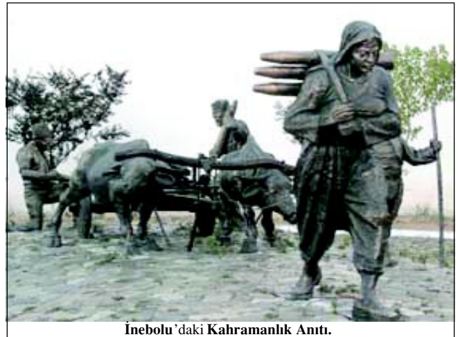
İnebolu 'daki Kahramanlık Anıtı.