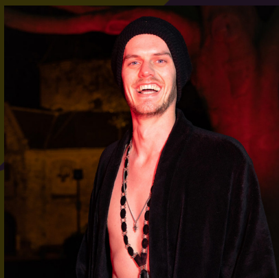
CEES NACHTBURGERMEESTER NIJMEGEN