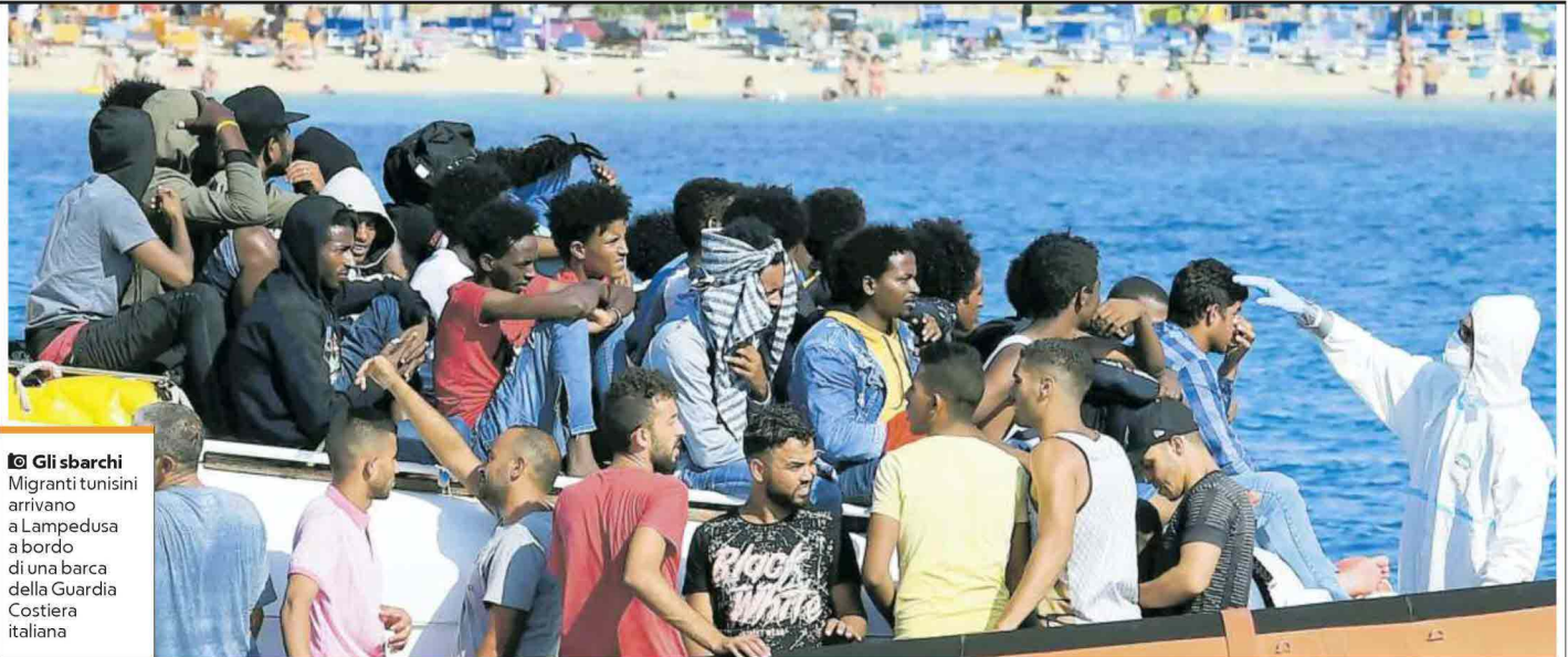
Gli sbarchi Migranti tunisini arrivano a Lampedusa a bordo di una barca della Guardia Costiera italiana