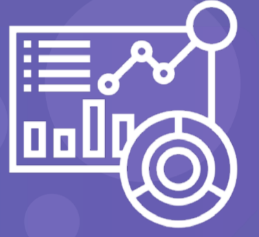
Tableau هي أداة نكاء أعمال رائدة في السوق تستخدم لتحليل ونمذجة البيانات بتنسيق سهل، تتيح لك العمل على مجموعة بيانات مباشرة

Power BI توفر هذه الأداء إمكانية كبيرة لتحليل البيانات من قبل أي مستخدم وإعداد نهائية حول هذه البيانات لأي مبرمج أو أي شخص آخر