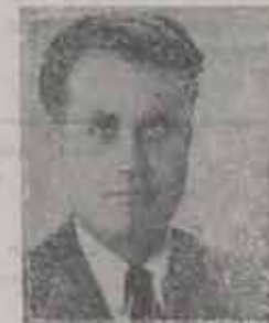
Günlük uzun süreyle burada Sona 1. de