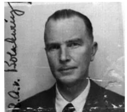
Otto von Bolschwing