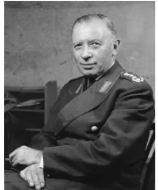
Adolf Heusinger

Als Bandera 1959 ermordet wurde, nachdem die USA sich geweigert hatten, ihn wegen Kriegsverbrechen an die Sowjetunion auszuliefern, übernahm Stetsko die OUN. Mit dem Zusammenbruch der Sowjetunion im Jahr 1991 dachten die USA, sie hätten Russland endlich im Griff. Unter der autokratischen, wodkagetriebenen Herrschaft von Boris Jelzin in Russland wurden die USA eingeladen, ein neoliberales „Schocktherapie“-Programm zu leiten, das zur vollständigen Zerstörung der russischen Wirtschaft führte.