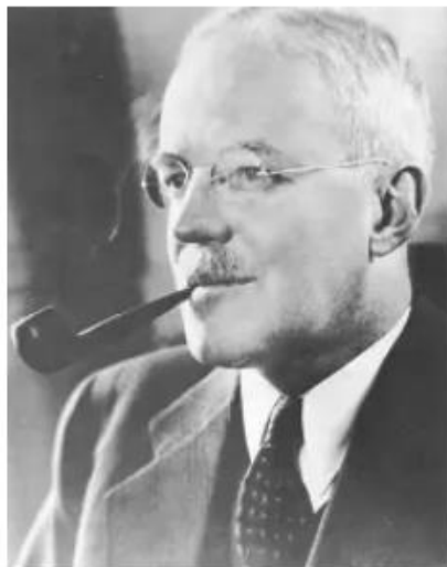
Allen Dulles

Gehlen wurde später Leiter des westdeutschen Geheimdienstes, beschäftigte die Nazis, mit denen er während des Krieges zusammengearbeitet hatte, und half der CIA, indem er Informationen über Osteuropa weitergab. Als sich Lebed mit der Nachkriegs-OUN-B in Deutschland überwarf , die CIA schmuggelte ihn und viele andere ukrainische Ultrationalisten in die USA.