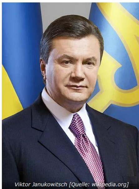
Viktor Janukowitsch

ruslandfreundlichen Viktor Janukowitsch zu blockieren und einen proamerikanischen Neoliberalen Viktor Juschtschenko als Präsidenten einzusetzen. Mit US-Hilfe setzte sich Juschtschenko durch, scheiterte aber kläglich als Präsident. 2010, als Janukowitsch zum Präsidenten gewählt wurde, ging für die USA erneut der Feueralarm los. Zu diesem Zeitpunkt war Juschtschenko als Führer völlig diskreditiert und erhielt nur 5.5 % der Stimmen im ersten Wahlgang, wodurch er eliminiert wurde. Die USA hatten es schwer, Gewinner auszuwählen.