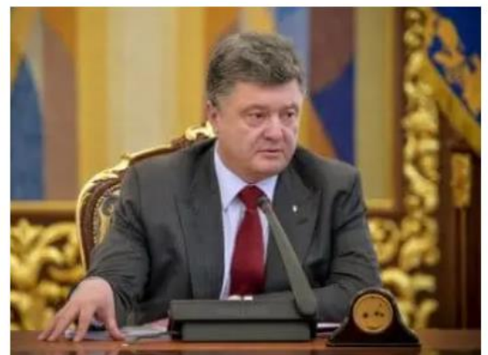
Petro Poroschenko, der Informant in der US-Botschaft in Kiew war, bevor ihn die USA unterstützten, um Präsident der Ukraine zu werden.

In Interviews mit europäischen Reportern im Juni 2022 sagte Petro Poroschenko , der ein regelmäßiger Informant in der US-Botschaft in Kiew war, bevor er 2014 von den USA zum Präsidenten gesponsert wurde, dass er während seiner Amtszeit Er unterzeichnete die Minsker Vereinbarungen mit Russland, Frankreich und Deutschland und vereinbarten einen Waffenstillstand lediglich als Trick, um Zeit für den Aufbau des Militärs und die Vorbereitung auf den Krieg zu gewinnen. „Unser Ziel“, sagte er, „war es, zuerst die Bedrohung zu stoppen oder zumindest den Krieg zu verzögern – acht Jahre zu sichern, um das Wirtschaftswachstum wiederherzustellen und mächtige Streitkräfte aufzubauen.“