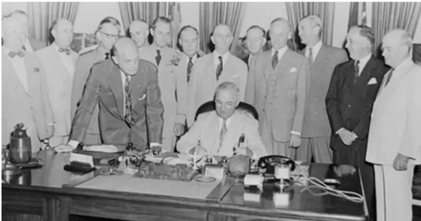
Präsident Harry S. Truman unterzeichnet die Gründung der CIA.

Trumans zerstörerischste Initiative war vielleicht die Gründung der CIA, eines Monsters, von dem er später behauptete, es sei außer Kontrolle geraten, als er einem Freund sagte: „Ich hätte der Formulierung der Central Intelligence Agency damals im Jahr XNUMX niemals zugestimmt, wenn ich das gewusst hätte sie würde die amerikanische Gestapo werden, obwohl er als Präsident deren geheime Aktivitäten in Osteuropa unterstützte. Das unmittelbare Ziel war die sowjetische Ukraine, die die CIA durch ihre geheimen Projekte zu erreichen hoffte „auseinanderbrechen“ mit Saboteuren hinter den feindlichen Linien.