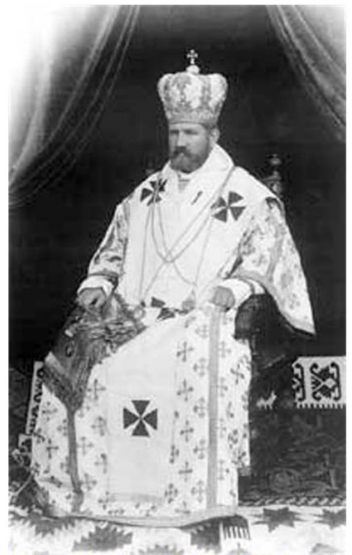
Andrey Sheptytsky

Das OUN-deutsche Bündnis im Jahr 1941 wurde von den Führern der ukrainisch-orthodoxen und der ukrainisch-griechisch-katholischen Kirche unterstützt. Deren Erzbischof, Andrey Sheptytsky , verfasste einen Hirtenbrief, in dem es heißt: „Wir grüßen die siegreiche deutsche Armee als Befreier vom Feind. Wir erweisen der errichteten Regierung unsere gehorsame Ehrerbietung. Wir erkennen Herrn Yaroslav Stetsko als Staatsoberhaupt der Ukraine an.“