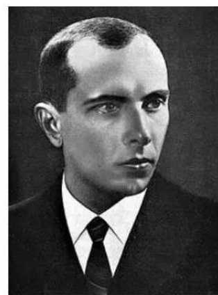
Stepan Bandera

OPC und OSO „stimme [d] zu, dass die ukrainische Organisation [Ukrainian Supreme Council of Liberation], das Leitungsgremium der OUN, ungewöhnliche Gelegenheiten zur Durchdringung der UdSSR und zur Unterstützung der Entwicklung von Untergrundbewegungen hinter dem Eisernen Vorhang bietet.“ Die CIA-Operation trug den Codenamen PBCRUET-AERODYNAMIC, basierend auf einem streng geheimen Dokument vom 17. Juni 1950.