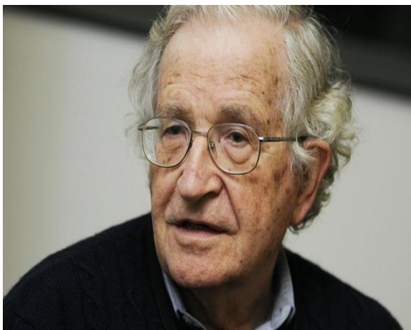
Noam Chomsky

Wenn Chomsky nicht überzeugend genug ist, könnten die US/NATO-Kriegstreiber vielleicht darauf achten Papst Franziskus , sicherlich kein Russophiler, der feststellte, dass die Invasion das Ergebnis „des Bellens der NATO vor den Toren Russlands ist .... Ich kann nicht sagen, ob es provoziert wurde, aber vielleicht ja.“