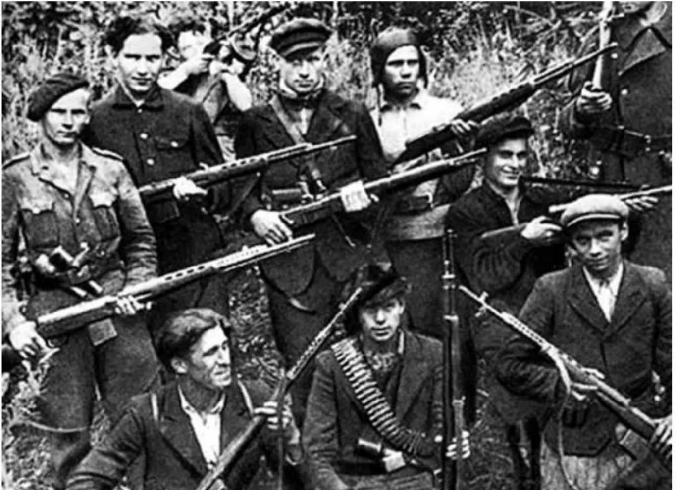
Ukrainische Aufständische Armee.