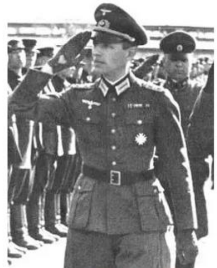
Reinhard Gehlen

In den frühen Jahren des Kalten Krieges gab es Hunderte, wenn nicht Tausende von Nazis , darunter Kriegsverbrecher wie der SS-Offizier Otto von Bolschwing (ein führender Organisator der Endlösung und ein Adjutant von Adolf Eichmann), der aus Deutschland, der Ukraine, dem Balkan, den baltischen Staaten und Weißrussland in die USA gebracht wurde. Unter ihnen war auch Adolf Heusinger , „einer der vielen hochrangigen Nazi- und Faschistenfunktionäre die in US-Militär- und Geheimdienstnetzwerke integriert worden waren.“ Heusinger war Hitlers Chef des Generalstabs des Heeres und wurde 1961-1964 zum Vorsitzenden des NATO-Militärausschusses ernannt, so fließend war der Übergang vom hochrangigen Nazi zum militärischen Befehlshaber der „Freien Welt“.