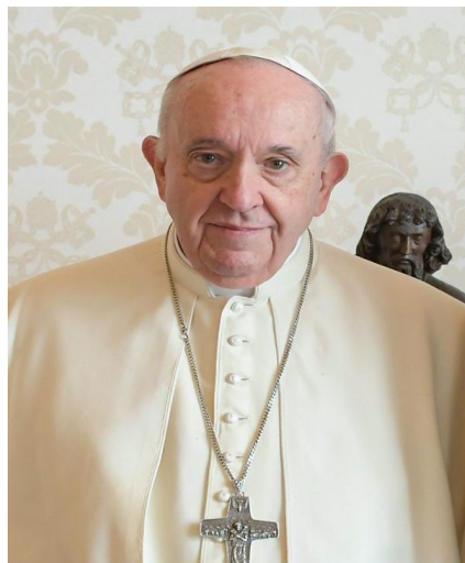
Papst Franziskus

Die Flut von MSM-Propaganda gegen Russland und das Embargo von Stimmen, die die offizielle Geschichte über den Putsch von 2014 und den Russland-Ukraine-Konflikt in Frage stellen, entlarven die US-Demokratie als ein Modell, das nicht nachahmenswert ist. Es gibt nur wenige autoritäre Staaten, in denen die Unterdrückung von Nachrichten ein solches Ausmaß hat und so institutionell verankert ist wie in den USA