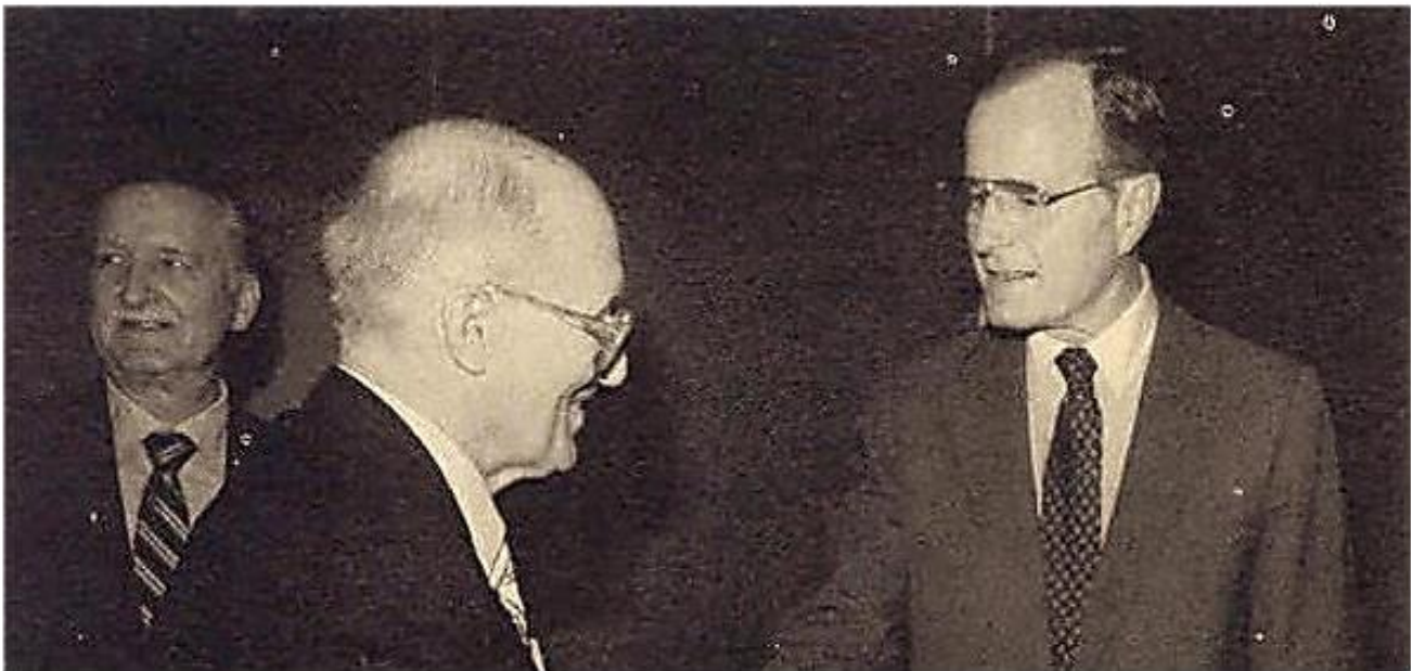
Yaroslav Stetsko mit dem damaligen Vizepräsidenten George HW Bush.