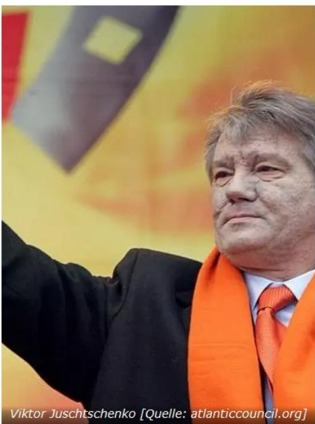
Viktor Juschtschenko

Neben Besuchen hochrangiger Beamter im Land intervenierten die USA über mehrere andere Kanäle, darunter die Regimewechselorganisationen, Nationale Stiftung für Demokratie , USAID, Freedom House, George Soros Open Society Institute (jetzt Foundations) und die allgegenwärtige CIA, um die Wahl des