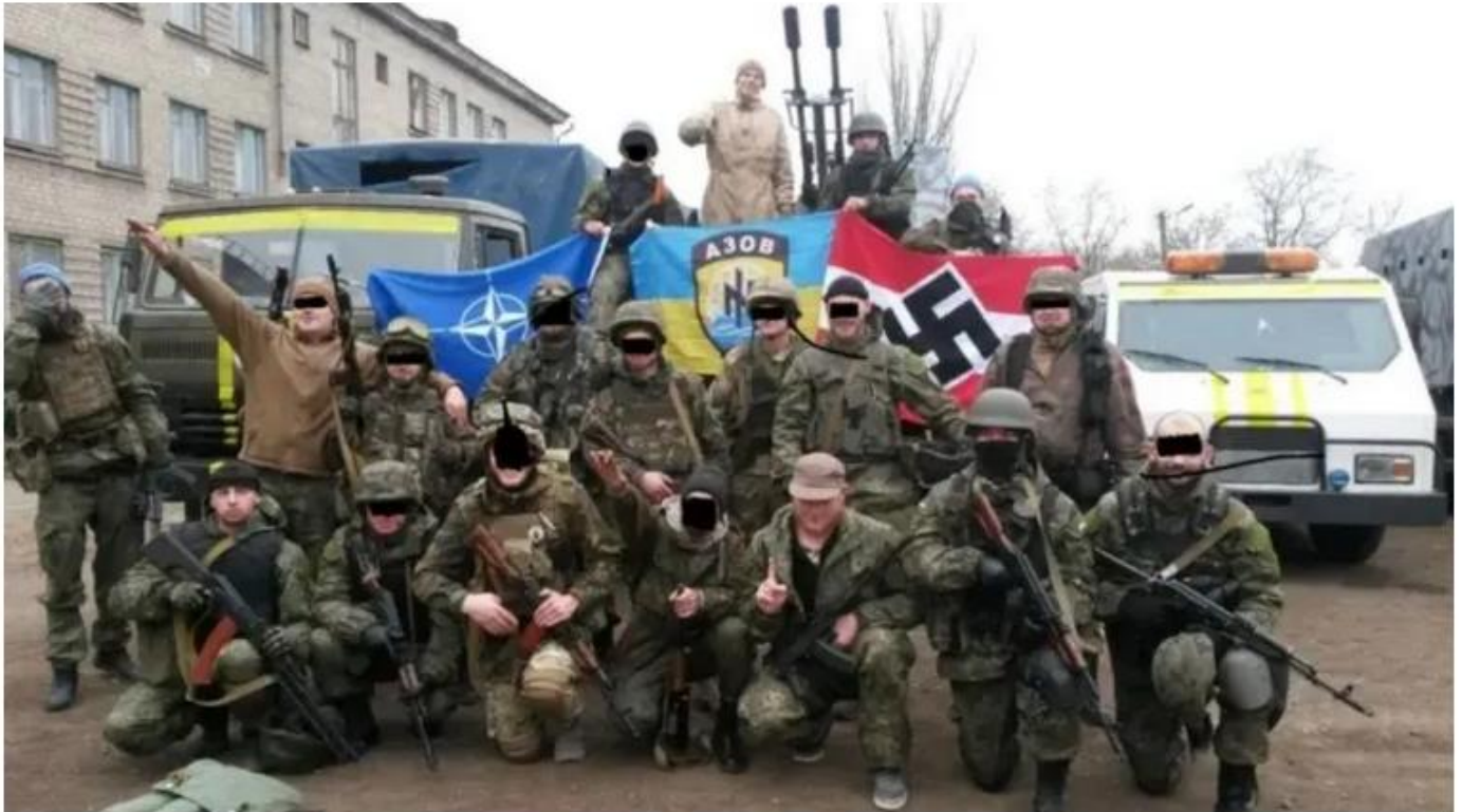
Kämpfer des Asowschen Bataillons mit der NATO-Flagge links und der Nazi-Flagge rechts.

Das Pentagon hat den Kongress erfolgreich dazu gedrängt, die Beschränkungen für die Ausbildung und die Bereitstellung militärischer Unterstützung für Gruppen wie das Asowsche Bataillon aufzuheben, die auf faschistischer oder Neonazi-Ideologie basieren.