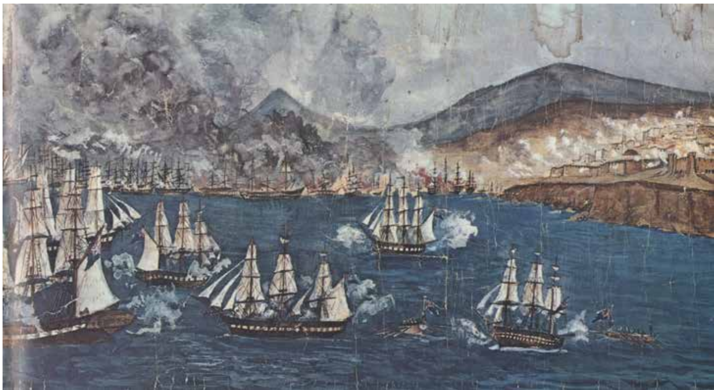
Η Ναυμαχία του Ναβαρίνου, υδατογραφία του Martin Verdiot. Πηγή: Ιστορία του Ελληνικού Έθνους, τ. ΙΒ, Αθήνα, Εκδοτική Αθηνών, 1975, σελ. 465