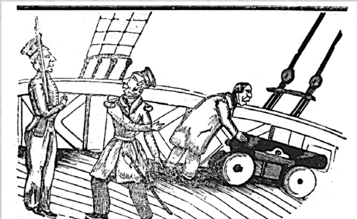
Σατιρικό σκίτσο με αναφορά στην υπόθεση Πατσιφίκο και τις πιέσεις της αγγλικής πολιτικής στο ελληνικό κράτος.