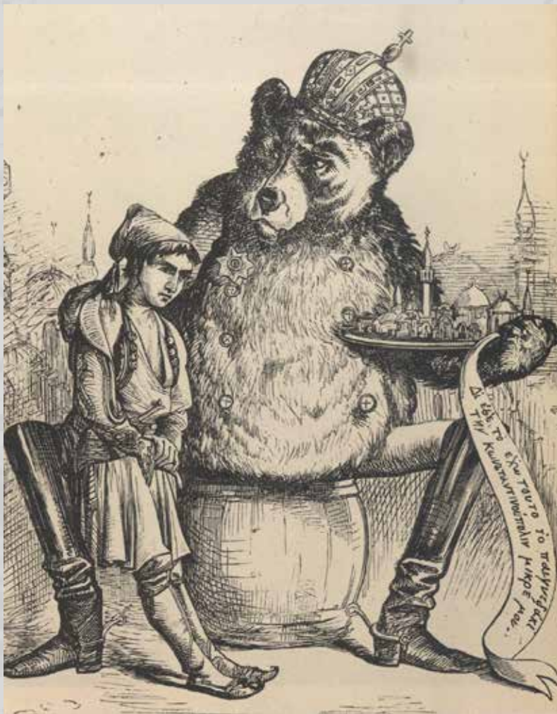
Αντιρωσικό σατιρικό σκίτσο της περιόδου του Κριμαϊκού πολέμου.