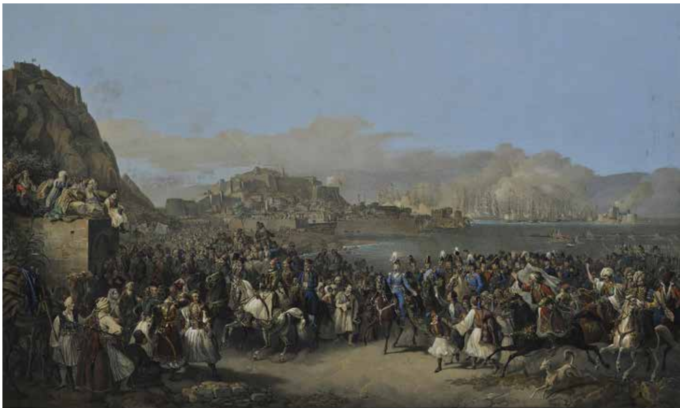
Είσοδος του Όθωνα στο Ναύπλιο την 25η Ιανουαρίου 1833, Έγχρωμη λιθογραφία του Peter von Hess (1836) Πηγή: Εθνική Πινακοθήκη https://www.nationalgallery.gr/el/sulloges/collection/sulloges/i-aphixi-tou-othona-sto-nauplio.html (ημερομηνία ανάκτησης 10/2/2022)

Κ.Κ.: Εστιάζοντας, λοιπόν, στις δυσκολίες, θα πω ότι η πρώτη δυσκολία με την οποία έχει να αναμετρηθεί ο αναγνώστης και η αναγνώστριά, έχει να κάνει με τον υπότιτλο του βιβλίου και πιο συγκεκριμένα με τα χρονολογικά όρια που θέτεις: 1833–1857. Στη νεοελληνική ιστορική συνείδηση οι ημερομηνίες-ορόσημα του 19ου αιώνα είναι τελείως διαφορετικές: είναι το 1821, για παράδειγμα. Γιατί επιλέγεις να ξεκινήσεις το 1833;