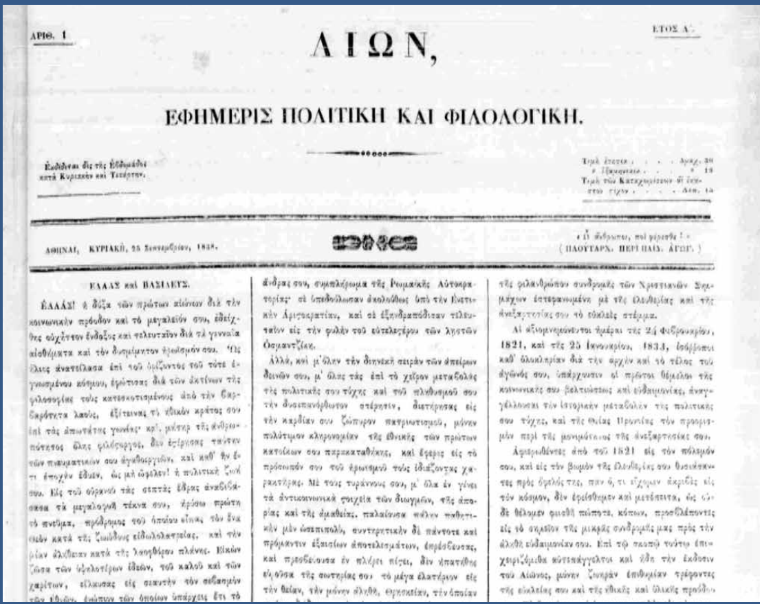
Το πρώτο φύλλο της εφημερίδας Αἰών, 25/9/1838