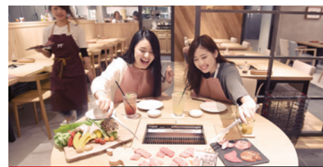
黑毛和牛¥2,500 YAKINIKU Boucherie@LUMINE EST新宿7樓

吃著超級豐富的海鮮生魚片拼盤，邊觀賞餐廳正中心的土壇上進行的太鼓、相撲、三味線等傳統日本國技表演。