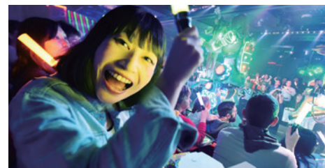
入場費¥8,000 ROBOT RESTAURANT@新宿歌舞伎町

建於高架橋之間的N331 Cafe，設計賣點便是全落地玻璃，可以近距離欣賞到兩旁電車的經過，吸引很多鐵道迷前來朝聖。