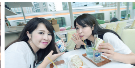
3331&富士山サイダー¥1,200 N331@mAAch ecute神田万世橋2F

在時尚的用餐環境下，享用最上等的黑毛和牛燒肉，加上無煙的抽風系統，吃完都不會有油煙味，就連女士也忍不住經常來用餐。