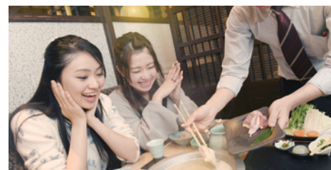
華味鳥水たき¥3,750 博多華味鳥銀座二丁目店@銀座Velvia館7F

來自博多的華味鳥，主打以雞和青菜熬煮的火鍋，能吃到最原始的味道，也比較健康，還有美肌效果，太讚了！