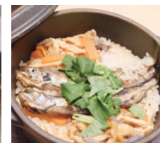
だし炊き込みご飯¥1,800