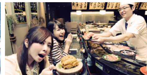
生うに富士山盛り¥1,000 銀座沼津港@KIRARITO GINZA

最受外國人歡迎的機械人主題餐廳，耗資百億日元，每日定時有機械人表演，還有太鼓、刀劍比武等，非常精彩！