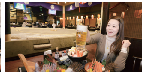
平均¥2,800/人 兩國八八八町はなの舞@両国江戸東京博物館

來自博多的華味鳥，主打以雞和青菜熬煮的火鍋，能吃到最原始的味道，也比較健康，還有美肌效果，太讚了！