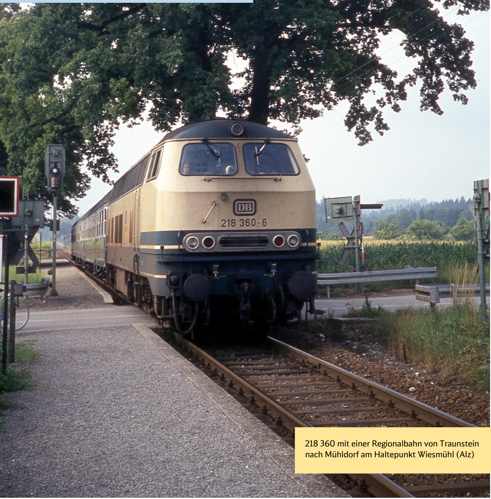
218 360 mit einer Regionalbahn von Traunstein nach Mühldorf am Haltepunkt Wiesmühl (Alz)