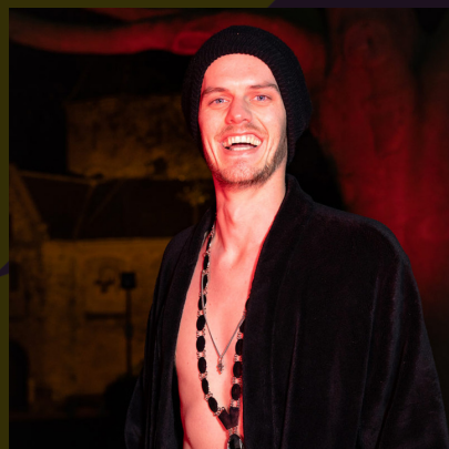
CEES NACHTBURGERMEESTER NIJMEGEN