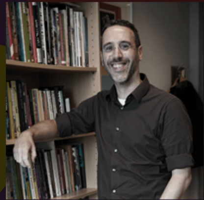
MARTIJN ONDERWIJS PARTNER