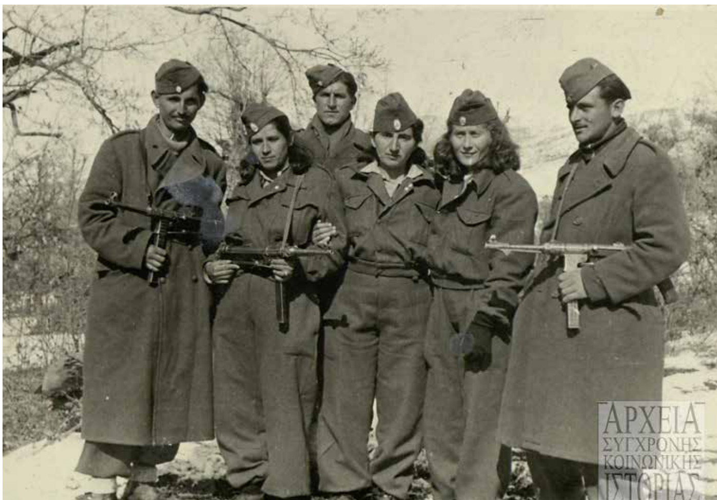
Μαχητές και μαχήτριες του ΔΣΕ (Φωτογραφικό Αρχείο ΑΣΚΙ)

προς την ένοπλη ρήξη. Απέναντι σε αυτές τις προσεγγίσεις, αυτό το οποίο με ενδιέφερε εμένα ήταν να αναδείξω τα εσωτερικά αίτια του ελληνικού Εμφυλίου Πολέμου. Ο ελληνικός Εμφύλιος Πόλεμος δεν προκαλείται από τις εξωτερικές δυνάμεις· υπάρχουν πολύ μεγάλες και πολύ έντονες αντιθέσεις, ένα πολύ δύσκολο και βαρύ παρελθόν από την Κατοχή. Παράλληλα, οι μεταπολεμικές κυβερνήσεις αντιμετωπίζουν την πρόκληση της Αριστεράς με έναν τρόπο, ο οποίος ωθεί τη δυναμική των εξελίξεων προς την ένοπλη σύγκρουση και τον εμφύλιο πόλεμο. Όλα αυτά βέβαια, χωρίς κανέναν να αμφιβάλει για τη σημασία του διεθνούς πλαισίου. Το διεθνές πλαίσιο είναι σημαντικό· καθορίζει, κατά κάποιον τρόπο, τα όρια και τις δυνατότητες των εγχώριων πρωταγωνιστών.