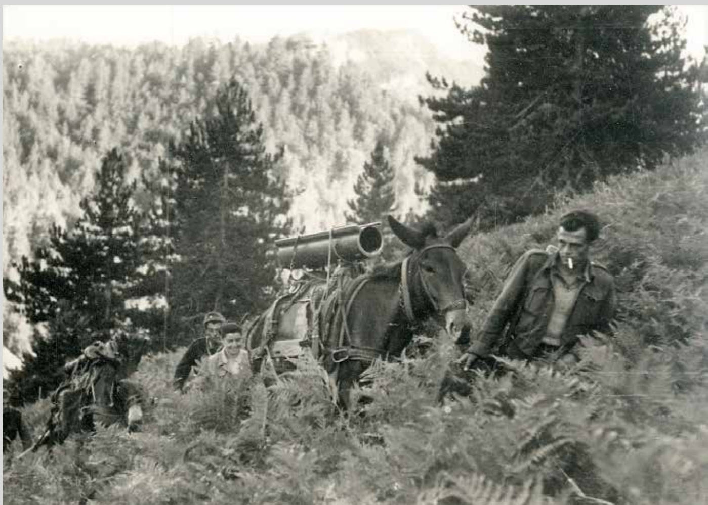
Μεταφορά πολεμοφοδίων