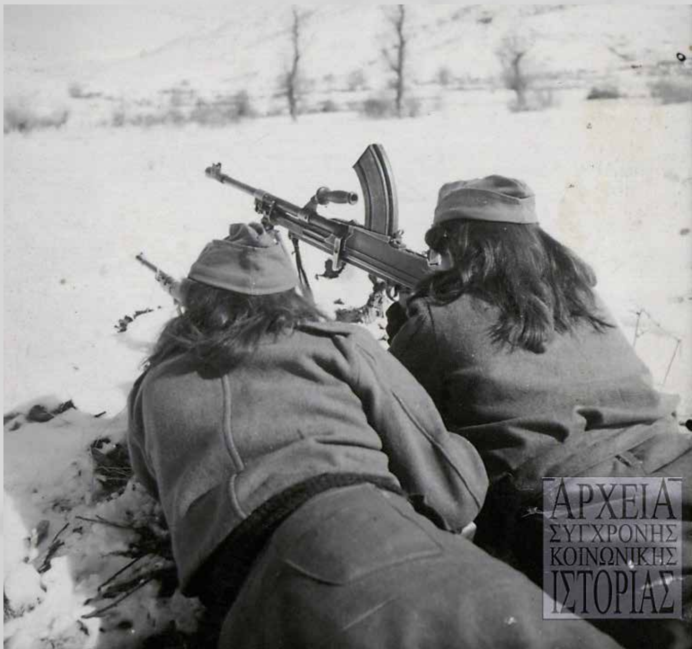
Μαχήτριες του ΔΣΕ στη μάχη