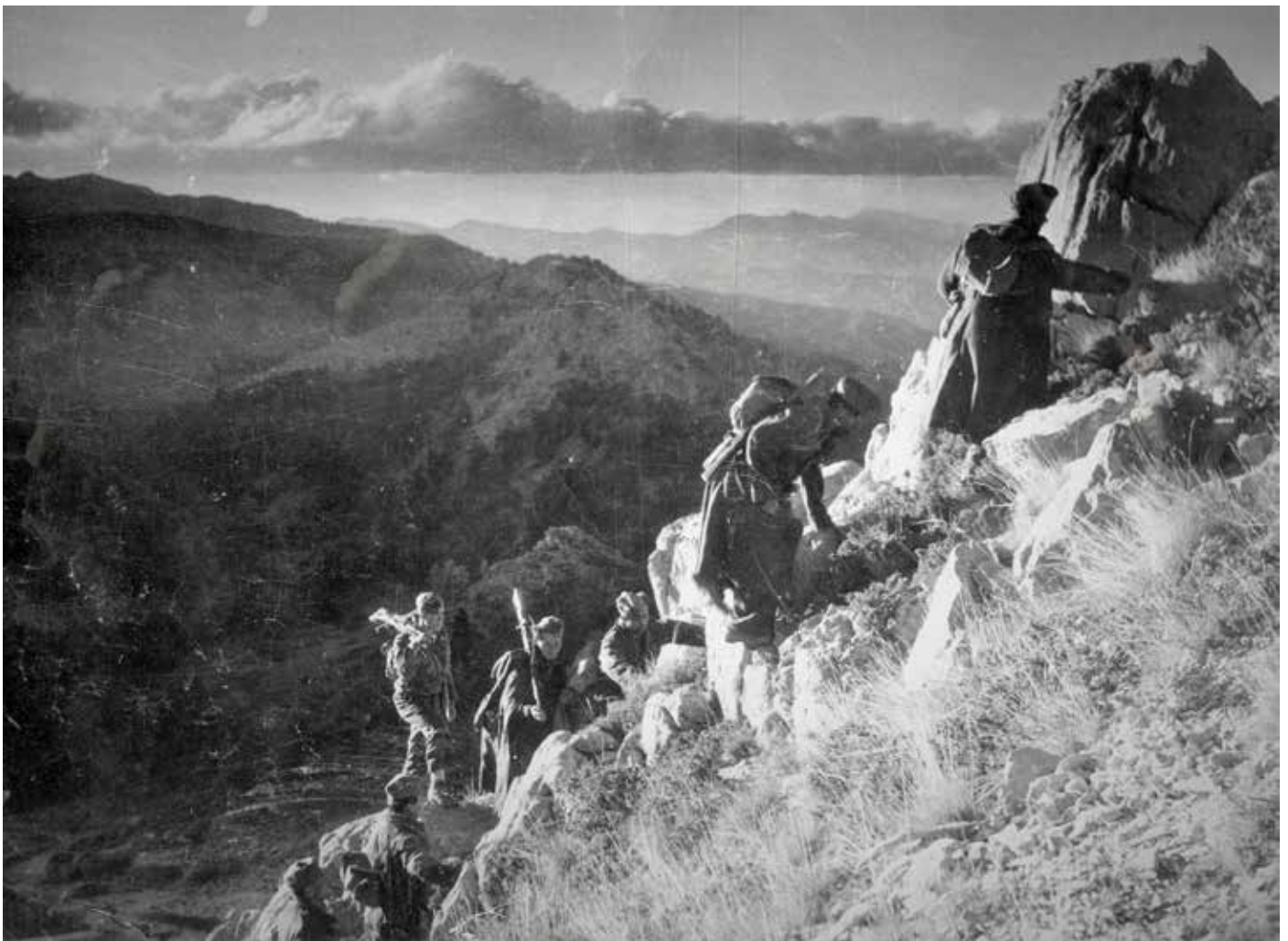
Μαχητές του ΔΣΕ

Π.Β.: Θα το καταφέρει στην Καρδίτσα, στο Καρπενήσι, στη Νάουσα, 8 αλλά για σύντομα χρονικά διαστήματα, κάτι που δείχνει και τα όριά του.