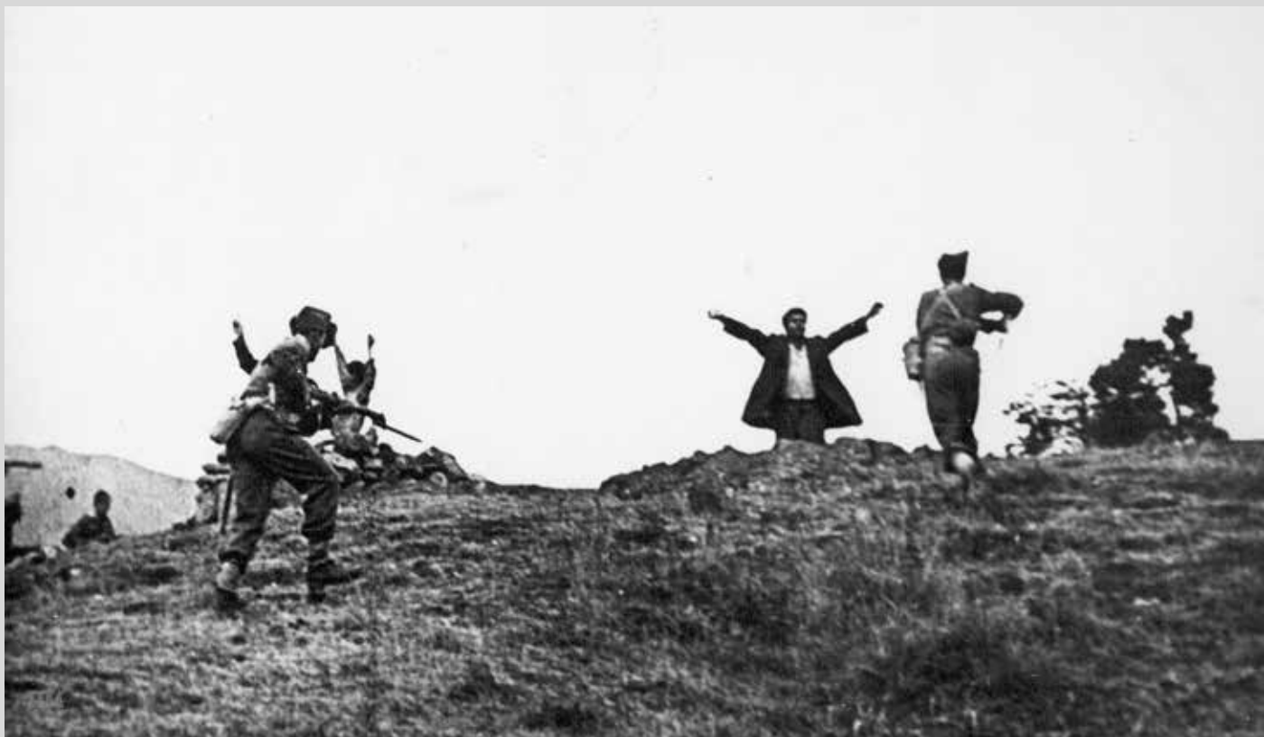
Παράδοση αιχμαλώτου κατά τη διάρκεια του Εμφυλίου