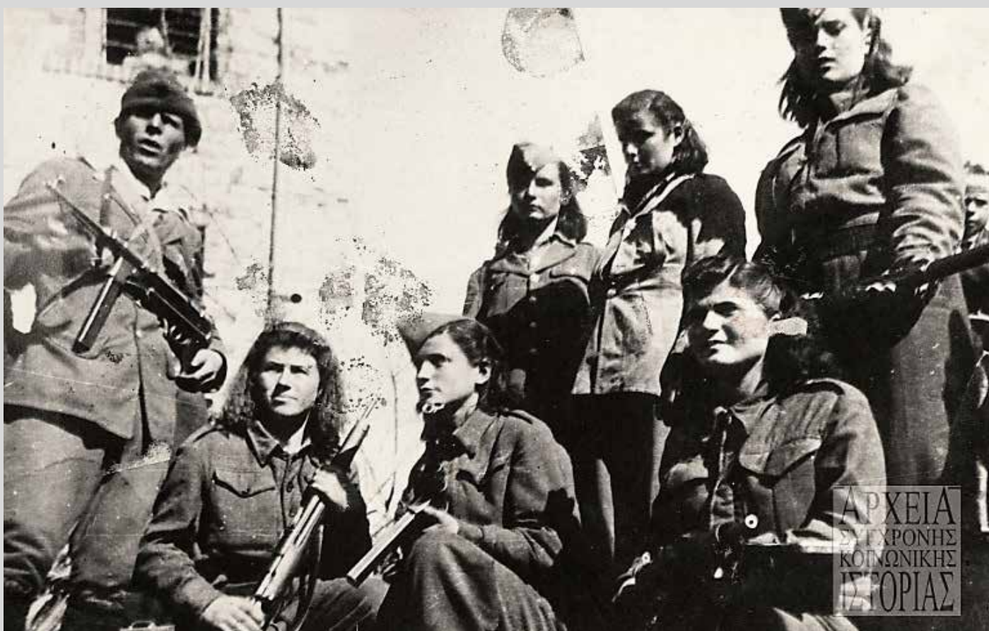
Μαχητές και μαχήτριες του ΔΣΕ