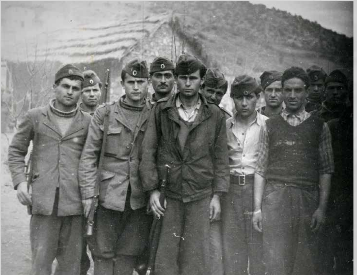
Μαχητές του ΔΣΕ