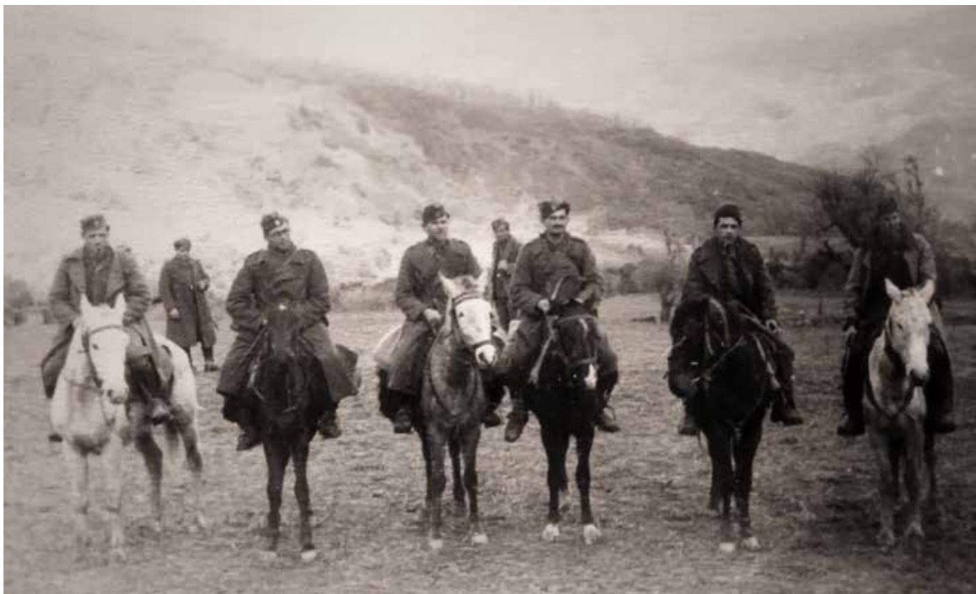
Το επιτελείο του 4ου Συντάγματος της 1ης Μεραρχίας του ΕΛΑΣ, Θεσσαλία (Φωτογραφικό Αρχείο ΑΣΚΙ)

των εμφύλιων συγκρούσεων που εκδηλώνονται τόσο στην επαρχία όσο και στην πρωτεύουσα το 1944. 4