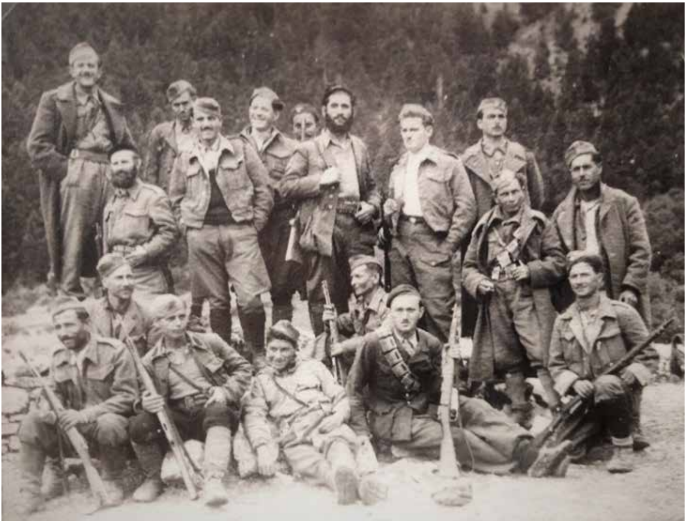
Αντάρτες του ΕΛΑΣ, Στερεά Ελλάδα

Π.Β.: Κάπως έτσι προσεγγίζω στο βιβλίο τον Εμφύλιο Πόλεμο. Δεν πιστεύω ότι ήταν αναπόφευκτη η πορεία προς την εμφύλια σύγκρουση. Το βασικό στοιχείο είναι ακριβώς αυτό που μόλις πριν από λίγο ανέφερα. Η βαριά παρακαταθήκη των εμφυλίων συγκρούσεων και ειδικά των Δεκεμβριανών, η οποία διαμορφώνει και υπαγορεύει την πολιτική του αστικού κόσμου μετά την Απελευθέρωση, όπου έχουμε ένα πλέγμα πρακτικών αποκλεισμού, οικονομικών πιέσεων, διώξεων και βίας, που δεν ήταν αναπόφευκτο να ακολουθηθούν. Επιλέχθηκαν να ακολουθηθούν, ακριβώς για να αποκλείσουν την Αριστερά. Από την πλευρά της Αριστεράς, η εμπειρία του ΕΛΑΣ και του ένοπλου αγώνα συνιστούσε ένα προηγούμενο. Συνεπώς, ένα κομμάτι αυτού του κόσμου είχε εξοικειωθεί με τη λογική της ένοπλης σύγκρουσης.