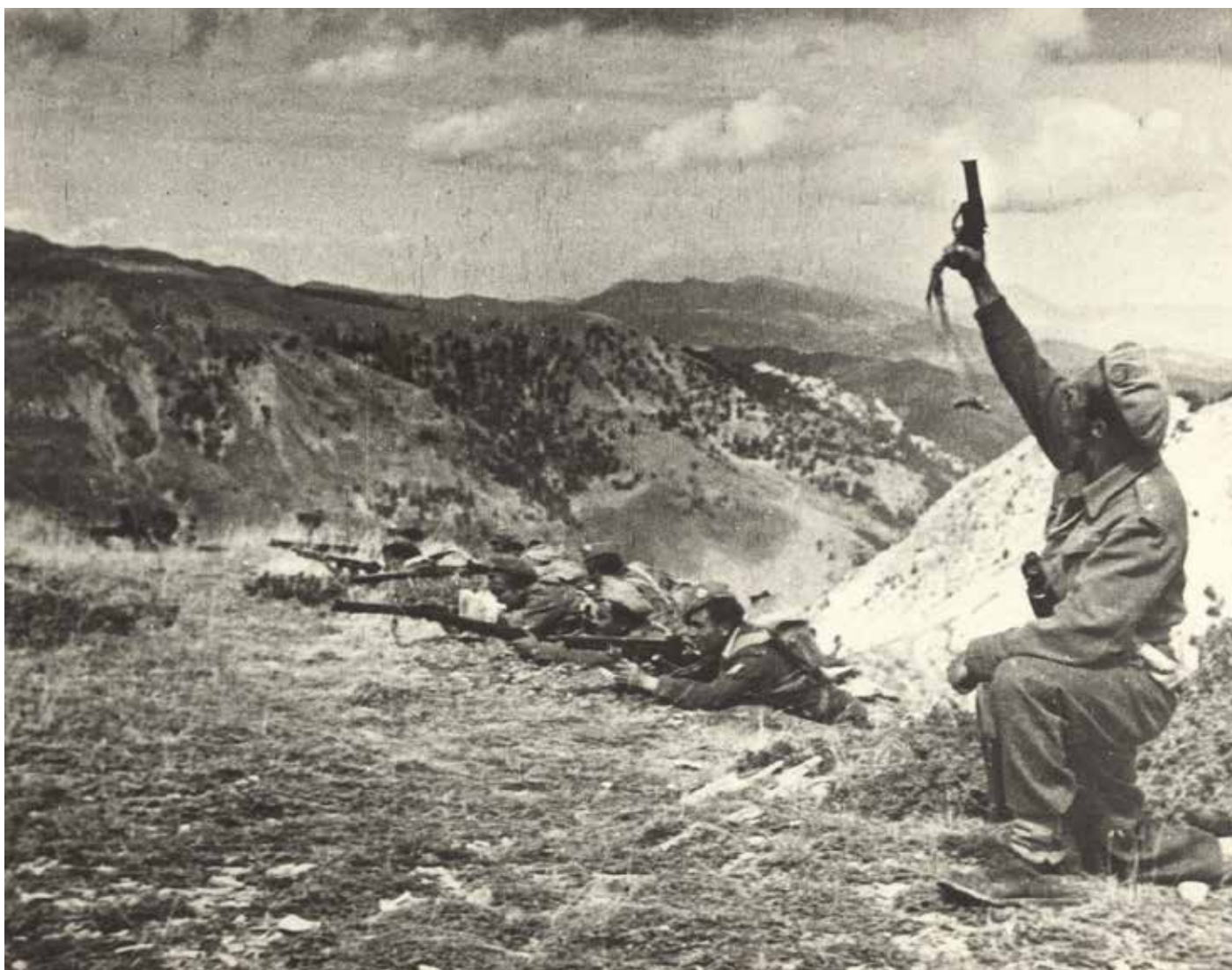
Στρατιώτες του Εθνικού Στρατού έτοιμοι για επίθεση

Π.Β.: Ναι, η έννοια της επανάστασης ήταν ένας τρόπος να δω τον ελληνικό Εμφύλιο Πόλεμο σε ένα ευρύτερο πλαίσιο, το οποίο θα μου επέτρεπε να εντοπίσω ομοιότητες και διαφορές με άλλους αντίστοιχους εμφυλίους πολέμους που έχουν γίνει σε άλλες χώρες. Η ιδέα ήταν ότι πρέπει κανείς να αντιληφθεί τον ελληνικό Εμφύλιο Πόλεμο σαν μία εκδοχή, σαν μία πλευρά μιας επαναστατικής διαδικασίας. Έχουμε δηλαδή πάρα πολλές επαναστάσεις –θα αναφερθώ μόνο στα πιο κλασικά παραδείγματα που γνωρίζουμε, τη Ρωσική και την Κινεζική Επανάσταση–, που στην ουσία συνδέονται, ακολουθούνται ή συνοδεύονται από εμφυλίους πολέμους. Κάτι αντίστοιχο συμβαίνει και στην περίπτωση της Ελλάδας. Βέβαια, απ' την άλλη πλευρά, στην ελληνική περίπτωση έχουμε μία επανάσταση η οποία δεν προκύπτει τόσο από κάποια βαθιά κοινωνικά αίτια όσο από μία πολιτική σύγκρουση. Προφανώς υπάρχουν κοινωνικές αντιθέσεις, κοινωνικά προβλήματα, φτώχεια και ανισότητα, τα οποία δημιουργούν εντάσεις και συγκρούσεις. Παρ' όλα αυτά, ο ελληνικός Εμφύλιος Πόλεμος –και αυτή είναι, αν θέλεις, και η σχέση του με τις κατοχικές συγκρούσεις– είναι μία κατεξοχήν πολιτική σύγκρουση. Η έννοια της επανάστασης, όμως, μου επιτρέπει να τον μελετήσω σε ένα ευρύτερο συγκριτικό πλαίσιο.