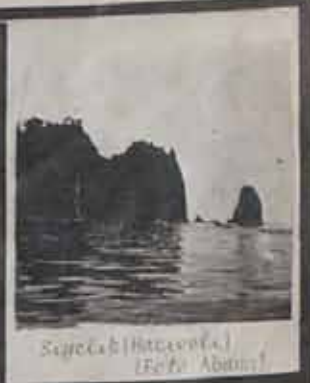
Sığırcak (Hacıoğlu)

"SAHİPSİZ MEMLEKETİN BATMASI HAKTIR, SEN SAHİP OLURSAN ABANA'N BATMAYACAKTIR." Behçet Kemal Çağlar