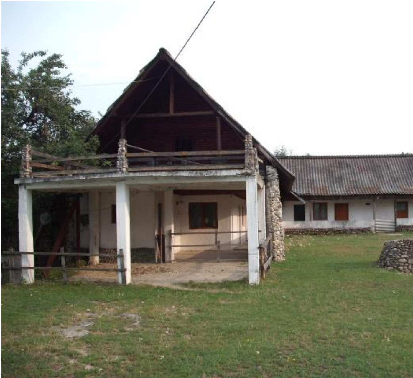
VEDERE DE ANSAMBLU , CASA