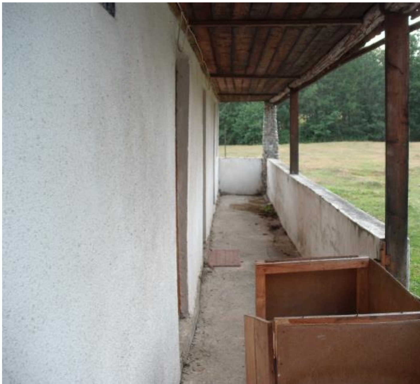
HOL LATURA SECUNDARA