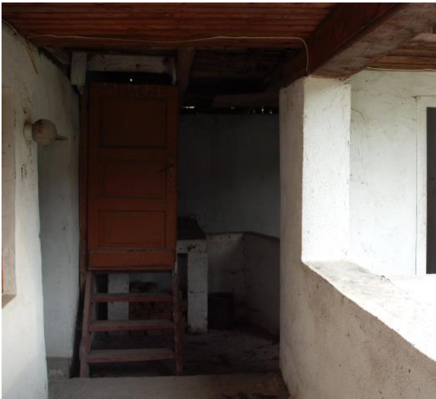
SCARA URCARE SECUNDARA IN POD