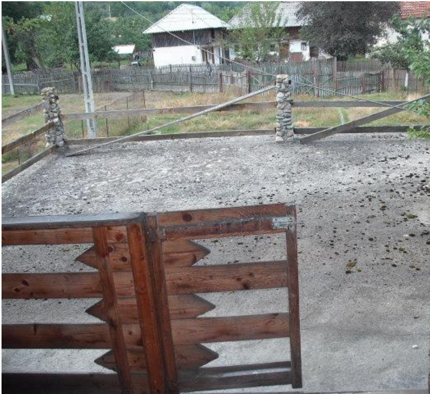
TERASA, vedere de sus