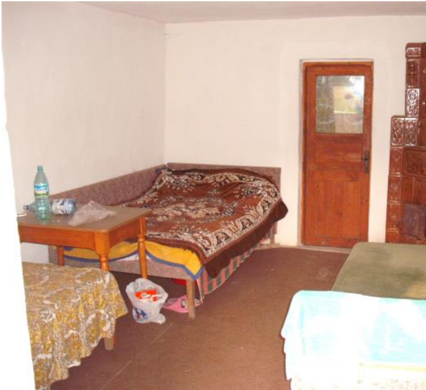
A DOUA CAMERA