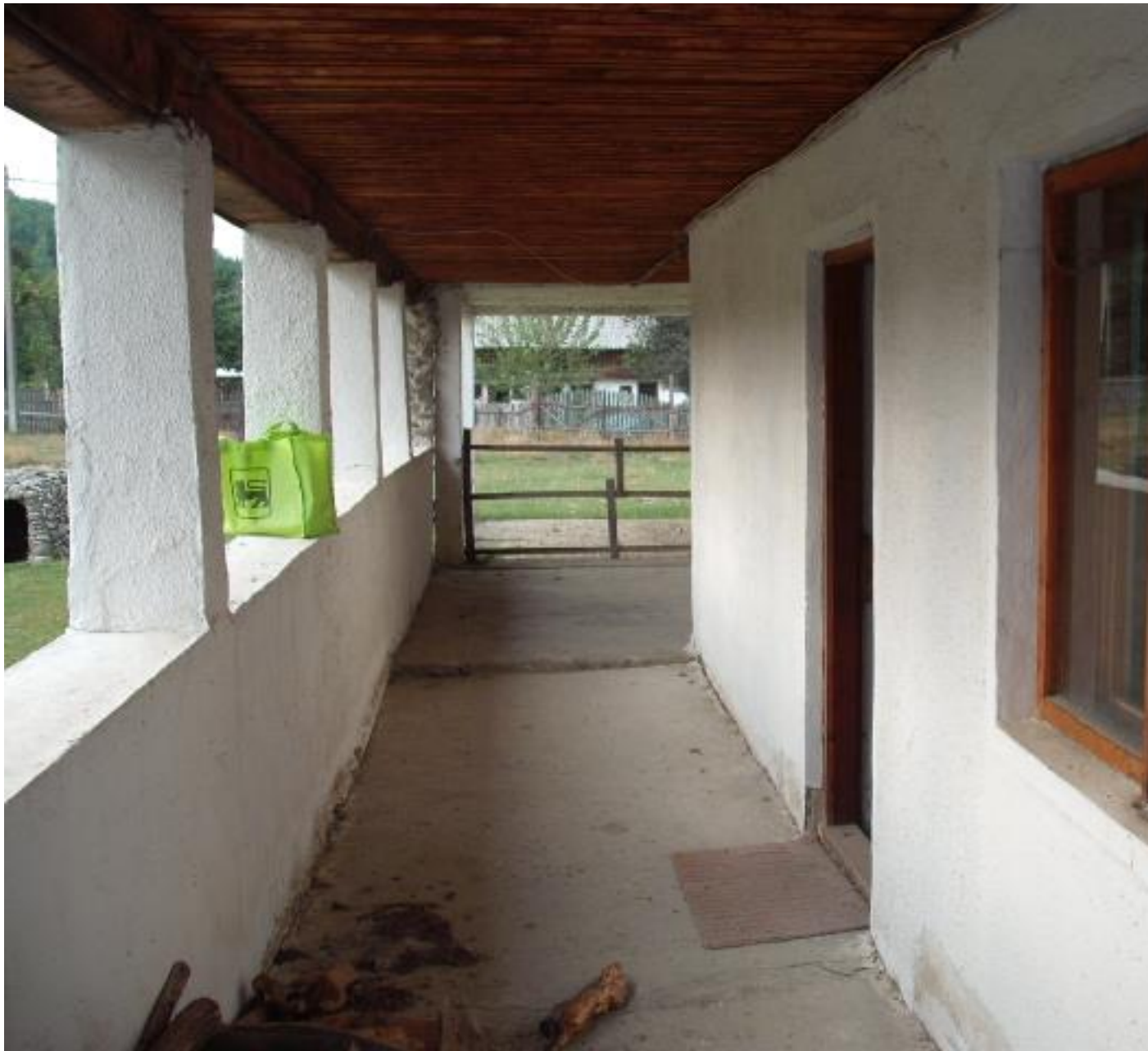
CORIDOR LATURA PRINCIPALA