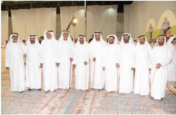
محمد بن نعيّف مع مجموعة من أعيان القبائل