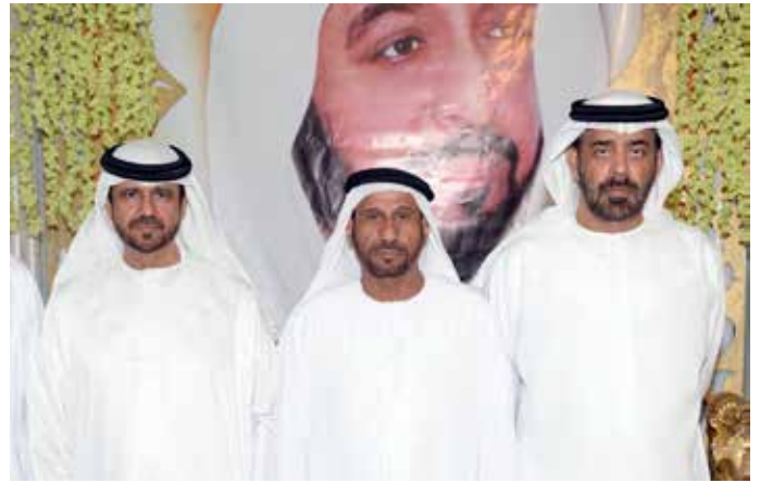
الشيخ سالم بالراكض وسعادة سهيل بن مرزوق يتوسّطهما محمد بن نعيّف