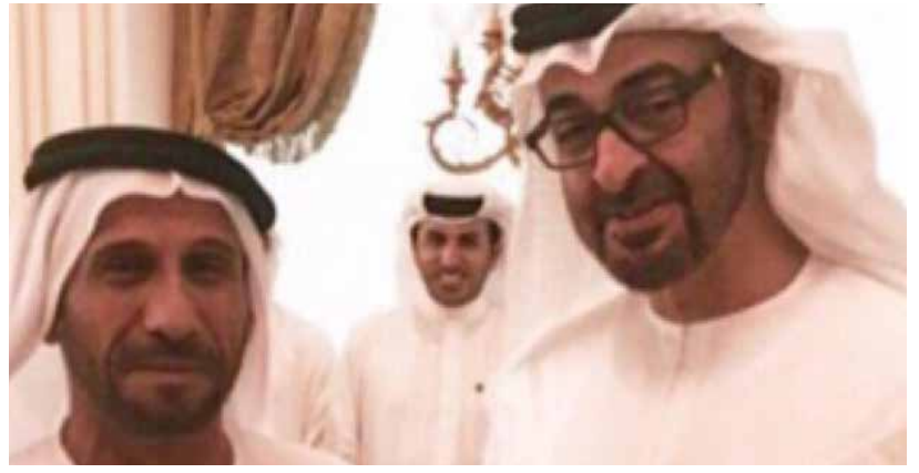
المؤلف مع صاحب السمو الشيخ محمد بن زايد آل نهيان