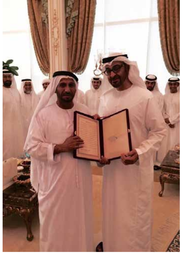
صاحب السمو الشيخ محمد بن زايد ومحمد بن سيف نعيف بن نعيف العامري