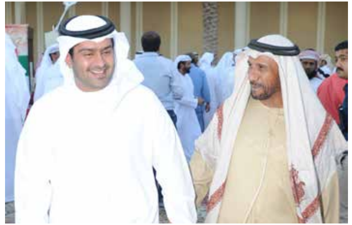
الشيخ خليفة بن سعيد آل نهيان ومحمد بن نعيّف