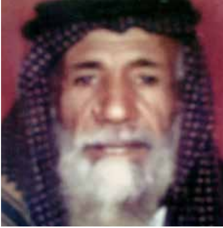
مبارك بن الرظه بن نعيّف اشتهر بالكرم ومحبة الناس له