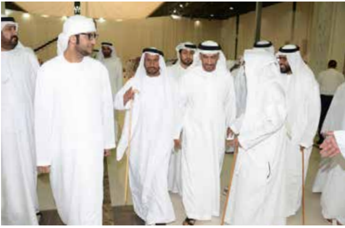
الشيخ نهيان بن زايد ومحمد بن نعيّف ومحمد بالحلب العامري