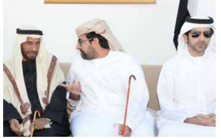
الشيخ هزاع بن طحنون والشيخ زايد بن طحنون ومحمد سيف بن نعيف