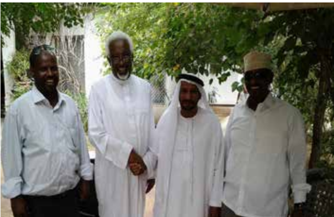
محمد بن نعيّف وإلى يمينه وزير داخلية الصومال وعلي يوسف وأحمد سودي في الصومال