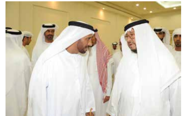
سمو الشيخ سلطان بن زايد ومحمد سيف بن نعيّف وفي الصورة الشيخ سالم حمد بالركاض