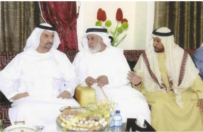
سمو الشيخ حمدان بن زايد ومحمد بن عبد الله بن نعيف ومحمد بن سيف بن نعيف العامري