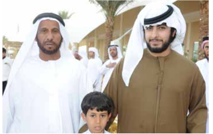
الشيخ زايد بن طحنون ومحمد بن نعيف وسعيد بن محمد بن نعيف