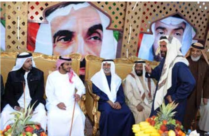
الشيخ نهيان بن مبارك مع الشيخ محمد بالركاض والشيخ محمد بن سالم بالركاض ونايف بن نعيّف وسهيل بن صالح وأمامهم يتحدث حمد بالهويمل