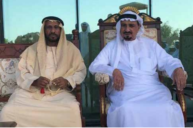
صاحب السمو الشيخ حميد بن راشد النعيمي عضو المجلس الأعلى - حاكم عجمان ومحمد سيف بن نعيف