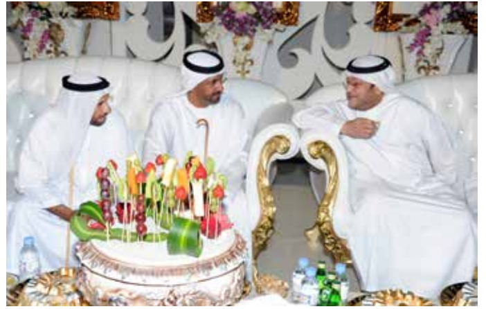
معالي الشيخ سعيد بن طحنون والشيخ سالم بالركاض ومحمد بن سيف بن نعييف