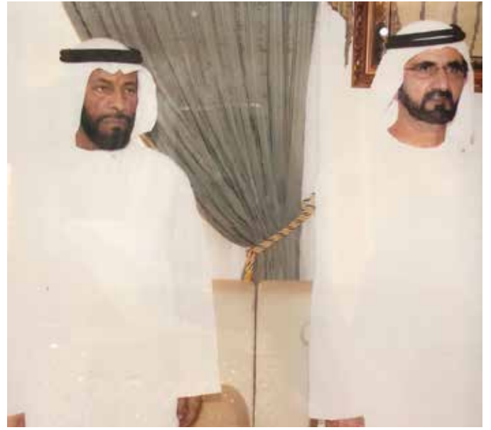
صاحب السمو الشيخ محمد بن راشد آل مكتوم والشيخ محمد بن رفاض