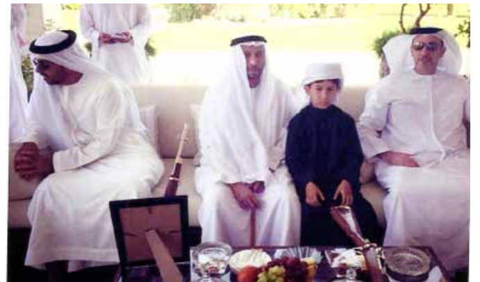
سمو الشيخ سيف بن زايد و سمو الشيخ حامد بن زايد يتوسطهما محمد سيف بن نعييف العامري ونجله سعيد