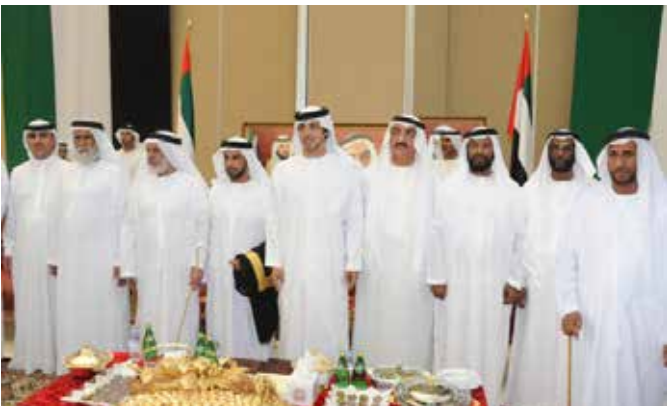
سمو الشيخ منصور بن زايد وإلى يمينه عبد الله ومحمد وعلي بن نعييف وإلى يساره الشيخ محمد بالركاض وسعيد بالكييلة أحد أعيان قبيلة العوامر ومحمد بن نعييف العامري