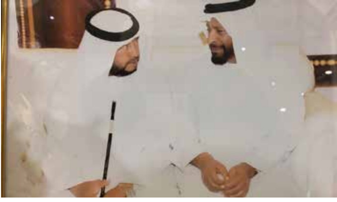
سمو الشيخ سلطان بن زايد آل نهيان مع الشيخ محمد بن ركاض