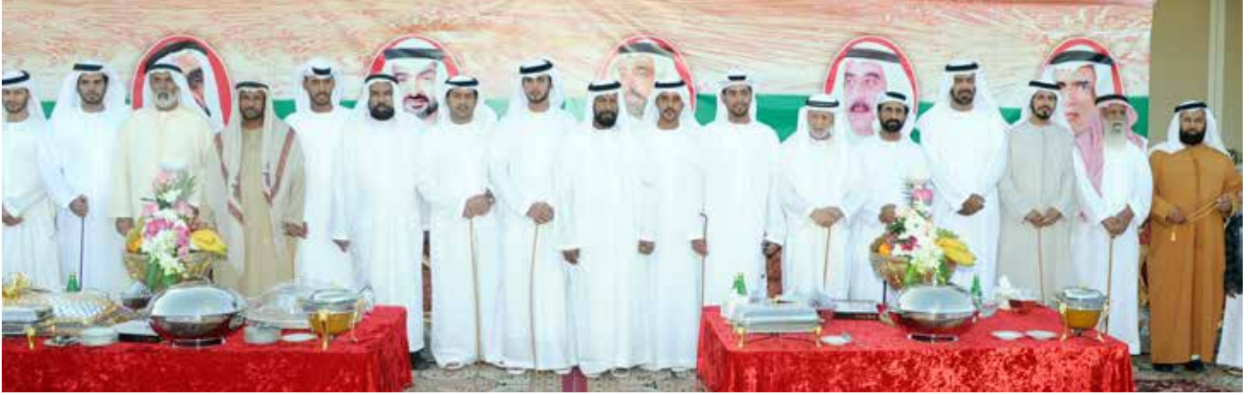
عدد من شيوخ وأعيان القبائل خلال حضورهم أفراح بن نعيف