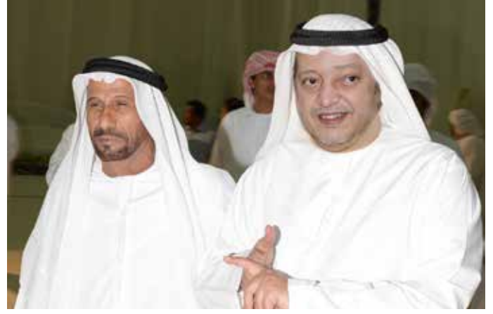
الشيخ سعيد بن طحنون آل نهيان ومحمد بن سيف بن نعيف