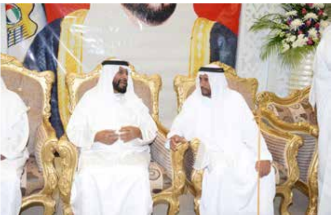
حديث ودي بين الشيخ محمد بالراكض ومحمد بن نعيّف