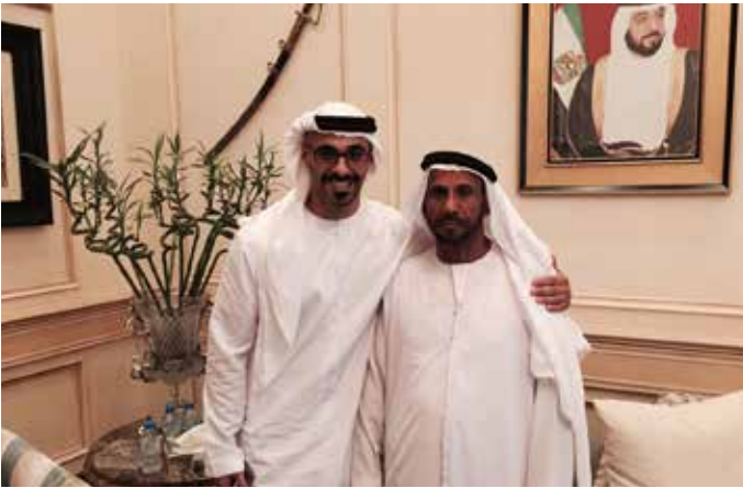
سمو الشيخ خالد بن محمد بن زايد ومحمد سيف بن نعيّف العامري