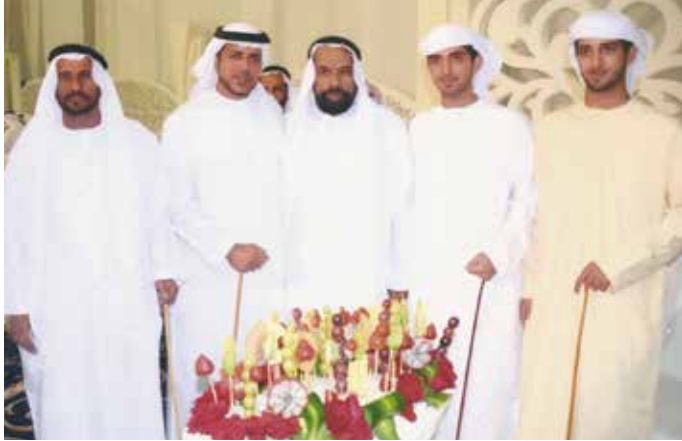
الشيخ منصور بن طحنون وأبناؤه والشيخ حمد بالركاض ومحمد بن سيف بن نعيّف