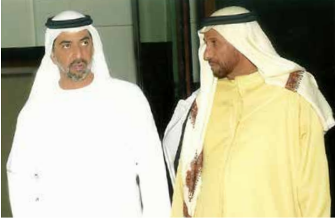
سمو الشيخ حمدان بن زايد ومحمد بن نعيّف العامري