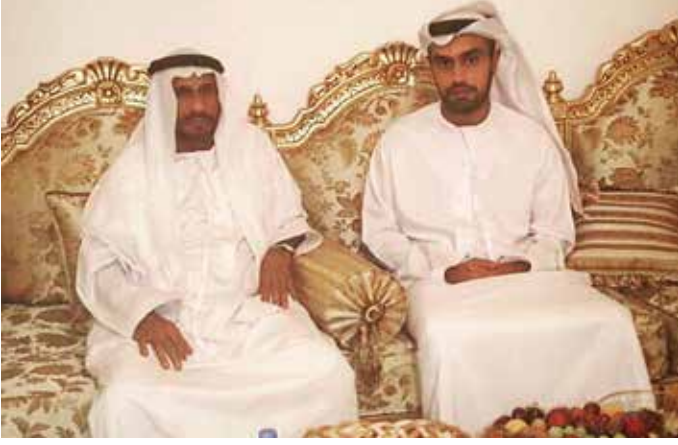
الشيخ محمد بن سعيد آل نهيان يزور محمد بن سيف بن نعيف العامري في مجلسه