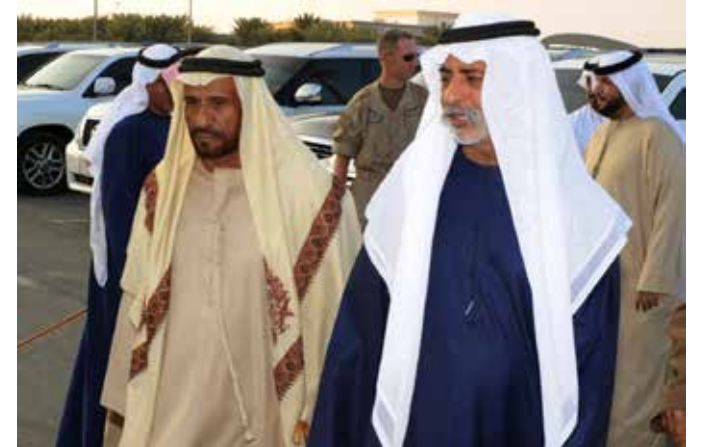
الشيخ نهيان بن مبارك ومحمد بن سيف بن نعييف العامري