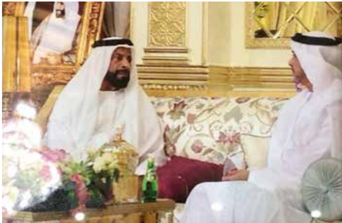
سمو الفريق الشيخ سيف بن زايد آل نهيان في مجلس الشيخ محمد بن ركاض