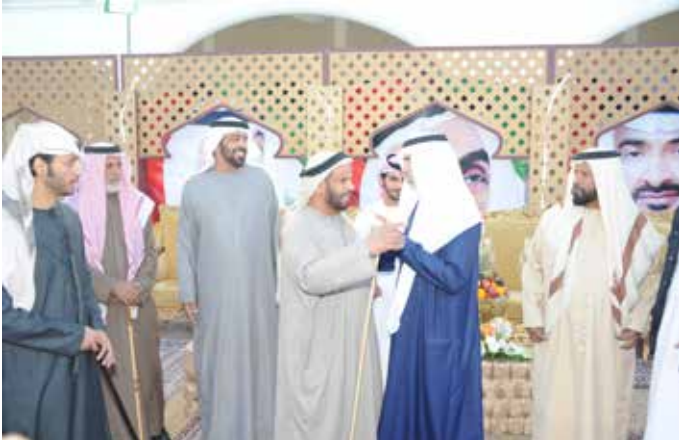
حمد بن سيف بن نعييف في حديث مع معالي الشيخ نهيان بن مبارك وفي الصورة الشيخ محمد بالركاض وسالم بالركاض والشيخ سيف الصلف النعيمي