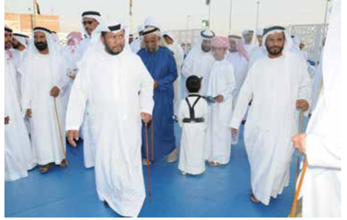
سمو الشيخ سلطان بن زايد وحمد بن نعييف وعبد الله بن نصره وصالح بن طرشوم وسليم بن شويرب ومجموعة من أعيان البلاد