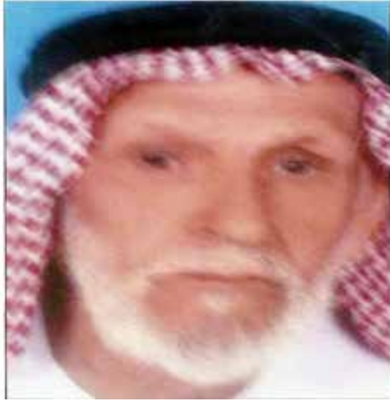
عيضة بن النايح اشتهر بالشجاعة والقوة وكان يضرب به المثل في القوة