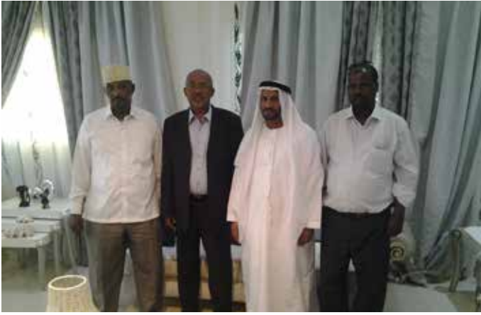
نائب رئيس جمهورية الصومال و مرافقيه ومحمد سيف بن نعيف