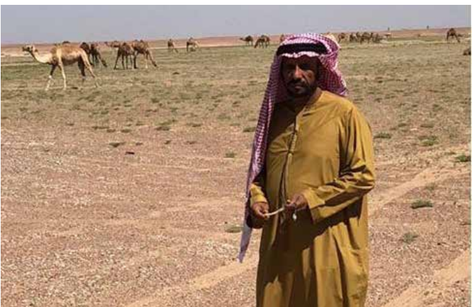
صورة في البادية