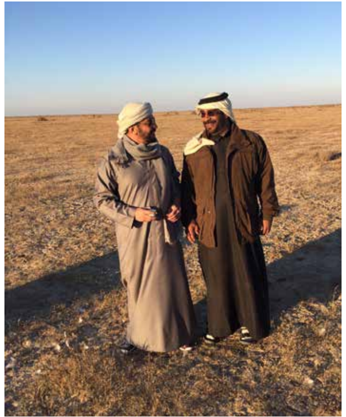
سمو الشيخ حمدان بن زايد آل نهيان وحمد بن سالم بن العوف أثناء الصيد