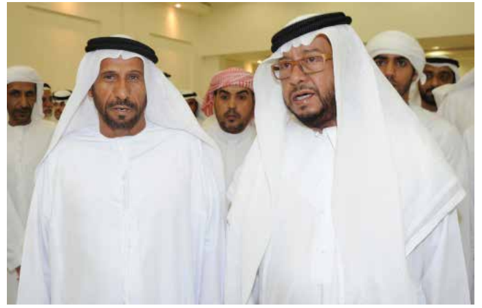
سمو الشيخ سلطان بن زايد ومحمد بن نعيّف