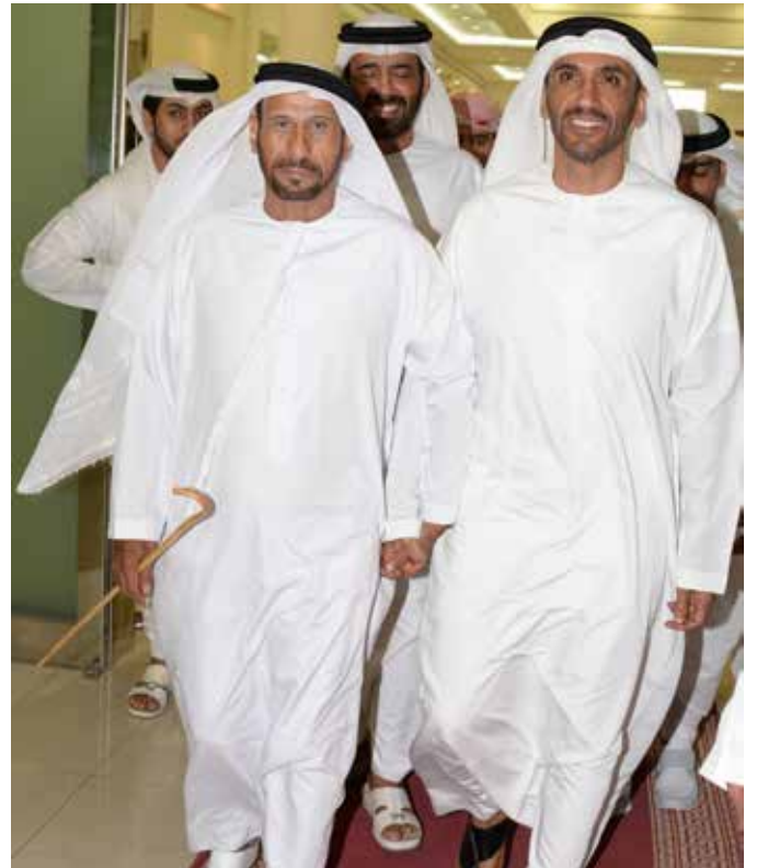
سمو الشيخ نهيان بن زايد ومحمد سيف بن نعيف والشيخ سالم محمد بالركاض