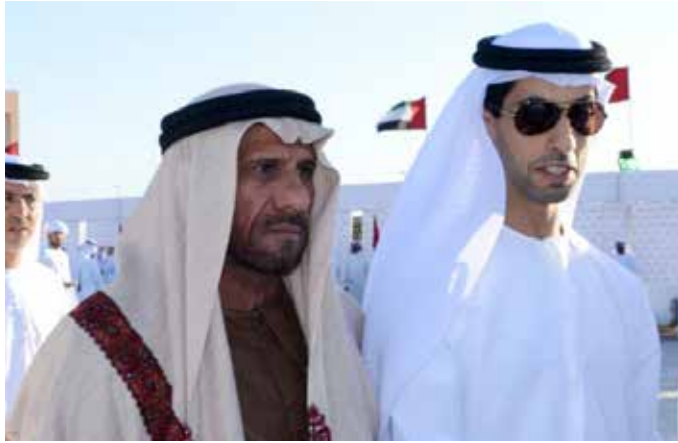
سمو الشيخ خالد بن زايد آل نهيان ومحمد بن نعيف