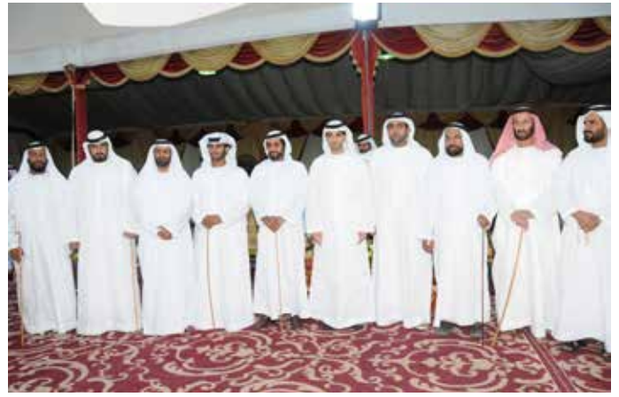
سمو الشيخ طحنون بن محمد آل نهيان مع مجموعة من أصحاب السمو الشيوخ وعدد من وجهاء وأعيان القبائل في حفل بن نعيّف العامري