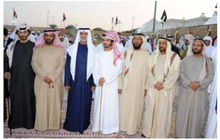
الشيخ نهيان بن مبارك وعلی يمینه سعيد بن سيف بن نعيف ومحمد بن حمد بن نعيف وعلی يساره نايف بن حمد بن نعيف والشيخ محمد بن حمد بالركاض ومحمد بن سيف بن نعيف وحمد بن سيف بن نعيف