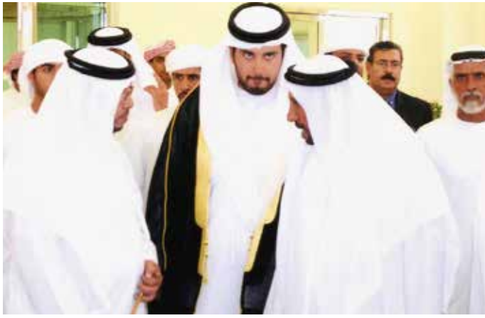
سمو الشيخ سلطان بن زايد والشيخ حمد بالركاض ومحمد بن نعيّف