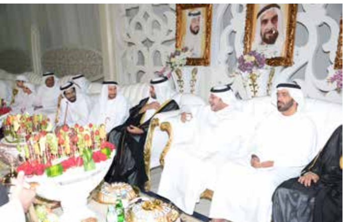
الشيخ سعيد بن طحنون والشيخ سالم بالركاض وفي الصورة الشيخ حمد بالركاض ومحمد بن نعيّف