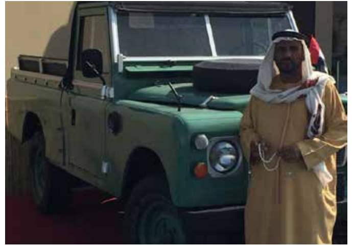
محمد سيف بن نعييف في رحلة صيد