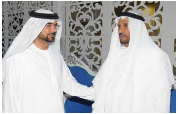
محمد بن سيف بن نعيف وسعادة الدكتور مبارك بن حمد بن مرزوق