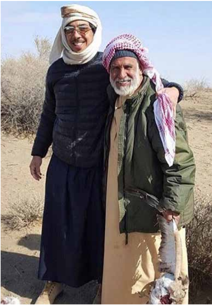
سمو الشيخ منصور بن زايد آل نهيان والمرافق الخاص محمد عبد الله بن نعيف أثناء رحلة صيد