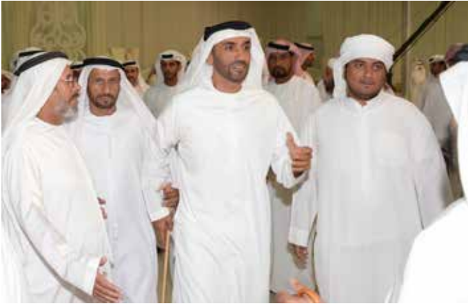
سمو الشيخ نهيان بن زايد ومحمد بن نعيف وسهيل بن نخيرات