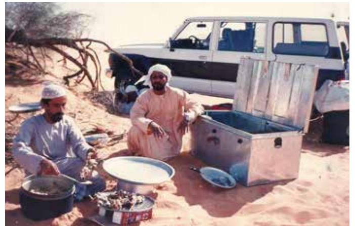
محمد بن نعيف وصالح بن المعنن في عروق الشبية