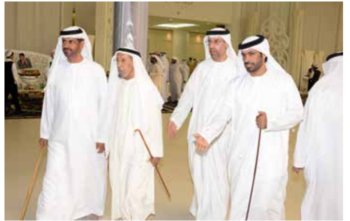
الشيخ سالم بن حمد بالركاض والشيخ نهيان بالركاض يستقبلون الشيخ شبيب بن هلال الظاهري ونجله الشيخ أحمد بن شبيب الظاهري