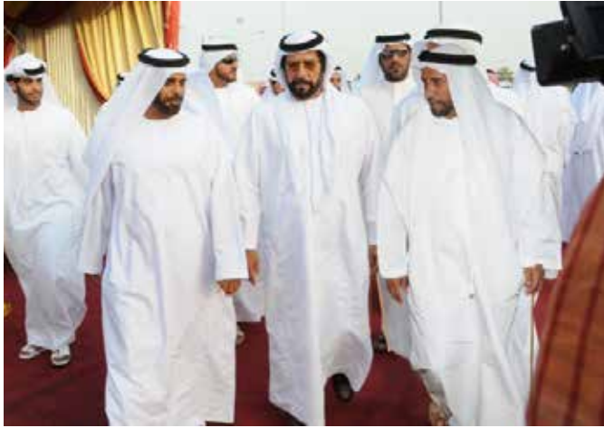
سمو الشيخ طحنون بن محمد وفي استقباله محمد بن سيف بن نعييف وسعيد بن سيف بن نعييف