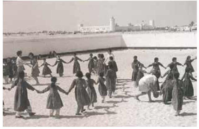
أبو ظبي قبل عقود خلت