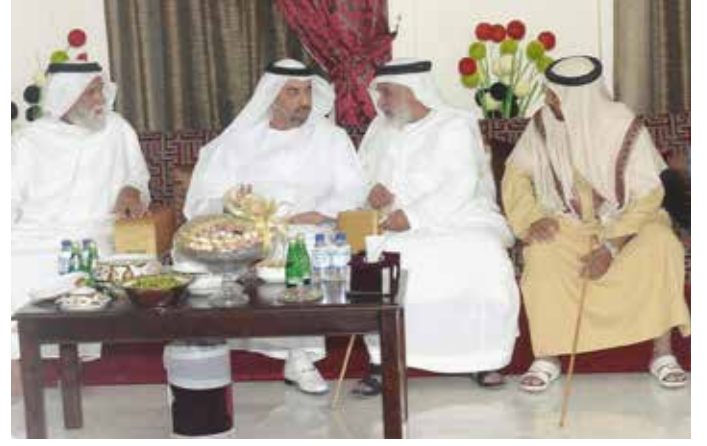
سمو الشيخ حمدان بن زايد ومحمد بن عبد الله بن نعيّف وعلی بن نعيّف ومحمد بن سيف بن نعيّف