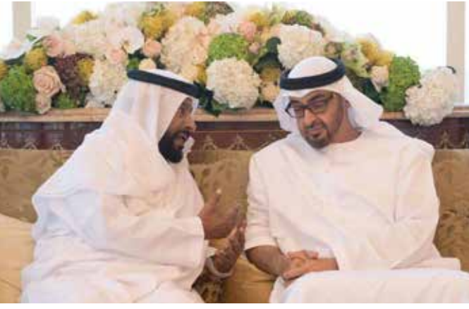
صاحب السمو الشيخ محمد بن زايد والشيخ محمد حمد بن رفاض