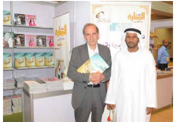
مع الكاتب جهاد الخازن معرض ابو ظبي للكتاب 2017