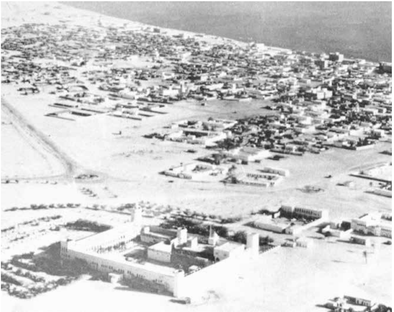
قصر الحصن - أبو ظبي