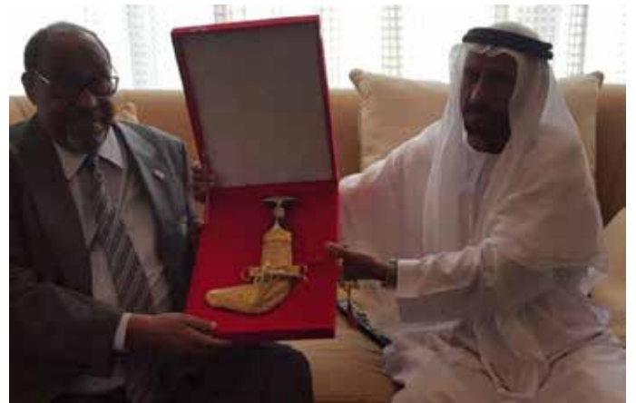
محمد سيف بن نعيف يهدي رئيس الصومال خنجر من ذهب