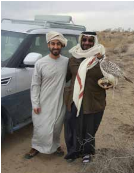
سمو الشيخ حمدان بن محمد بن زايد آل نهيان وحمد بن سالم بن العوف أثناء الصيد