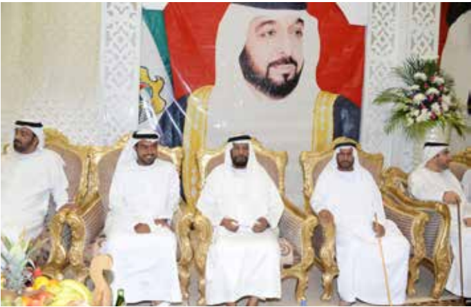
الشيخ محمد بن سعيد آل نهيان والشيخ محمد بالراكض والشيخ سالم بالراكض ومحمد بن نعيّف وإلى يساره سعادة أحمد ناصر الريسي