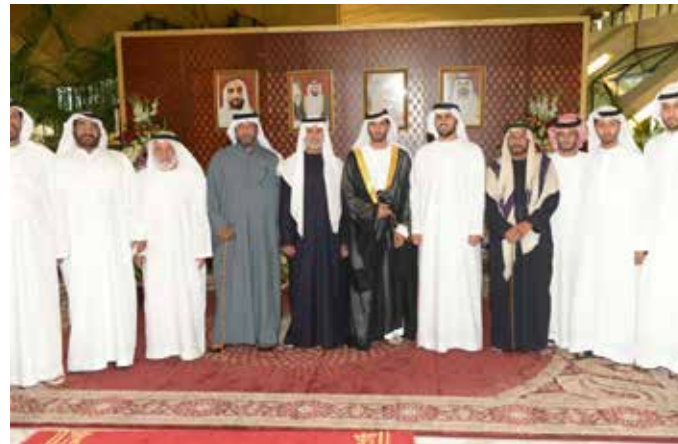
سمو الشيخ ذياب بن محمد والشيخ نهيان بن مبارك ومحمد بن العوف ومحمد بن عبد الله بن نعيف أثناء حفل بالعوف