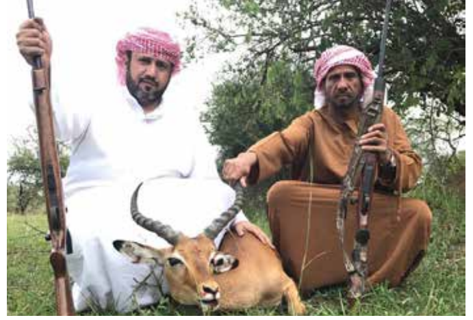
رحلة صيد في طبيعة تنزانيا