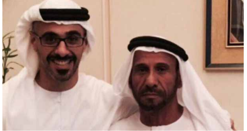
الشيخ خالد بن محمد بن زايد ومحمد بن سيف بن نعييف العامري