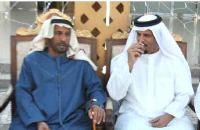
محمد بن سيف بن نعيّف العامري وسعادة السفير صالح محمد بن نصره العامري