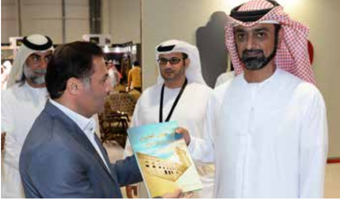
سمو الشيخ عمار بن حميد النعيمي ولي عهد عجمان، يتسلم نسخة من كتاب بن نعييف سيرة وتاريخ وديوان من الصحافي حسن بحمد