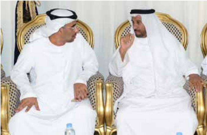
محمد بن نعيف وسعادة سعيد بن دري الفلاحي