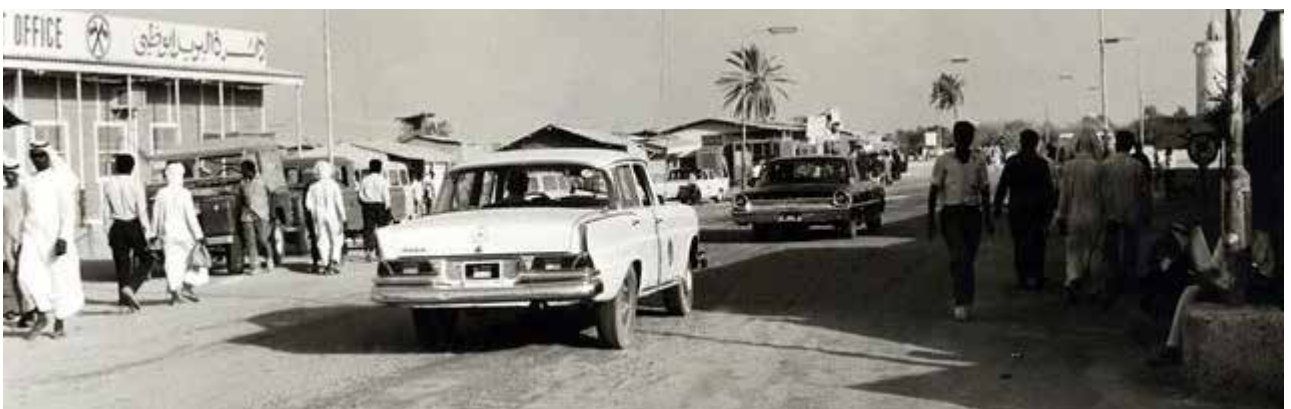
أبو ظبي قديماً