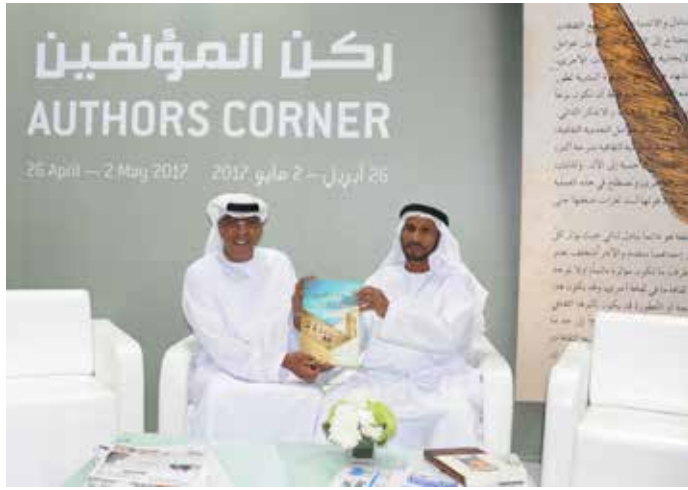
مع سفير الامارات في الاردن السفير مطر الشامسي