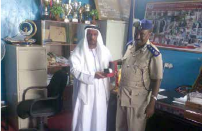
محمد بن نعيف ومدير شرطة أرض الصومال