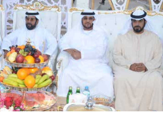
سمو الشيخ طحنون بن محمد ومعالي الشيخ محمد بن بطي آل حامد والشيخ ذياب بن طحنون