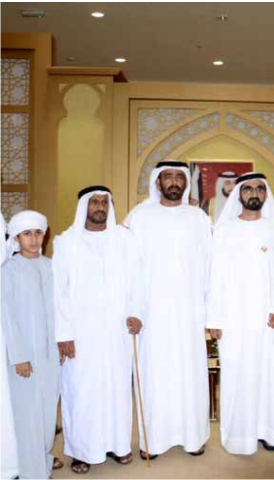
صاحب السمو الشيخ محمد بن راشد آل مكتوم وسالم بن ركاض ومحمد سيف بن نعييف ونجله سعيد