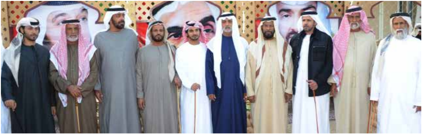
سمو الشيخ نهيان بن مبارك والشيخ محمد بالراكض والشيخ سيف بن سعيد الصلف والشيخ محمد بن سالم بالراكض وحمد بن سيف بن نعيّف وسهيل بن مسعود و علي بن عبد الله بن نعيّف ونايف بن نعيّف ومحمد بن نعيّف