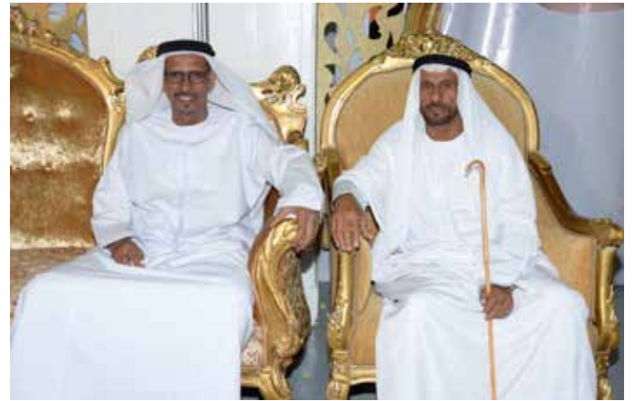
محمد بن نعيّف وسعادة عبد الله بن سالم بن نصرّة