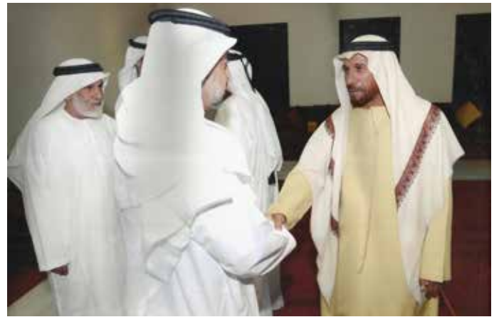
محمد سيف بن نعيف يصافح سمو الشيخ حمدان بن زايد