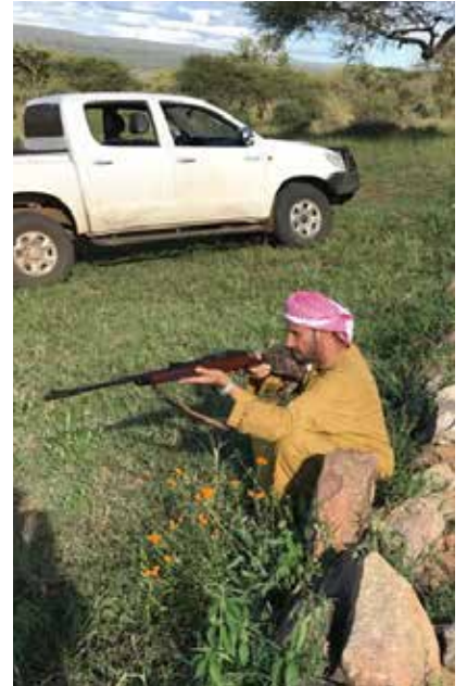
رحلة صيد في طبيعة تنزانيا