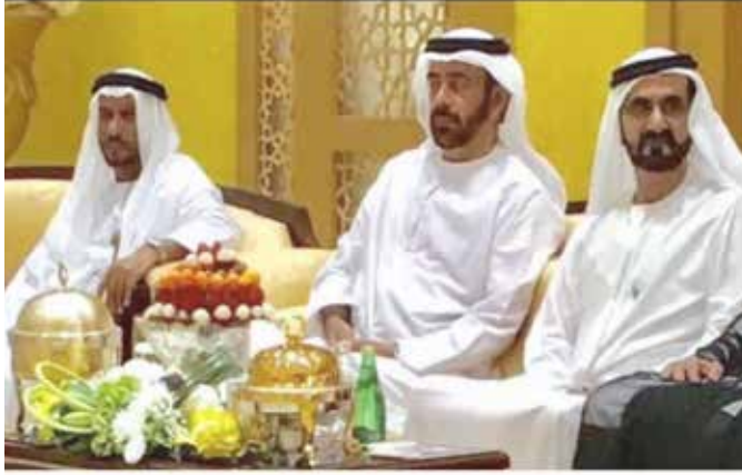
صاحب السمو الشيخ محمد بن راشد آل مكتوم والشيخ سالم بن ركاض ومحمد سيف بن نعييف