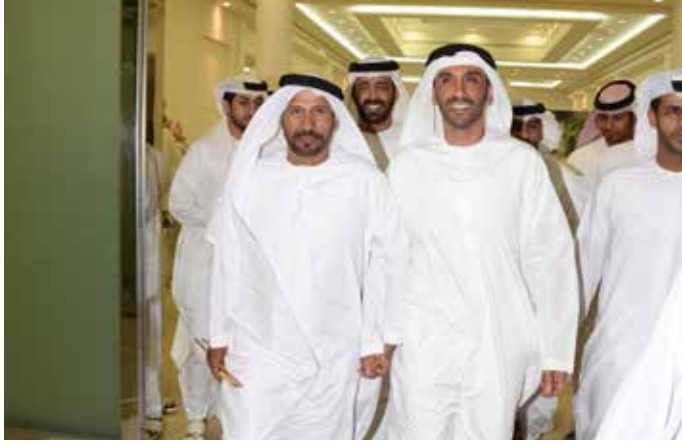
الشيخ نهيان بن زايد و محمد بن نعيّف وفي الصورة الشيخ سالم بن محمد بالركاض