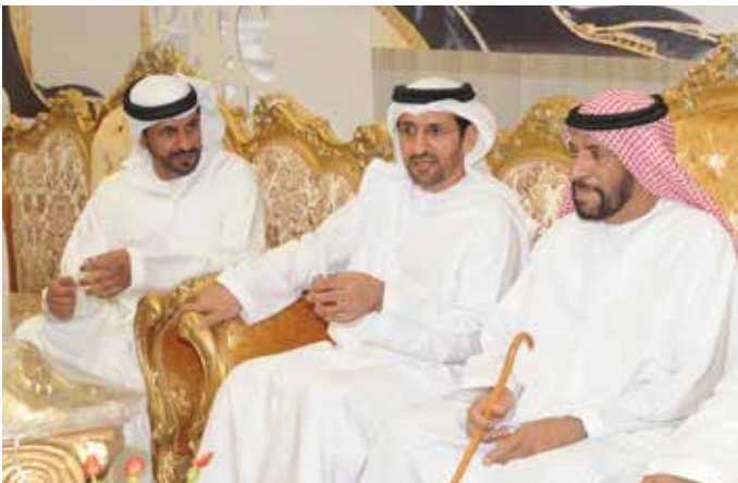
الشيخ سالم بن حمد بالركاض وسالم بن حمور أحد أعيان قبيلة العوامر يتوسطهما سعادة الدكتور مطر النعيمي