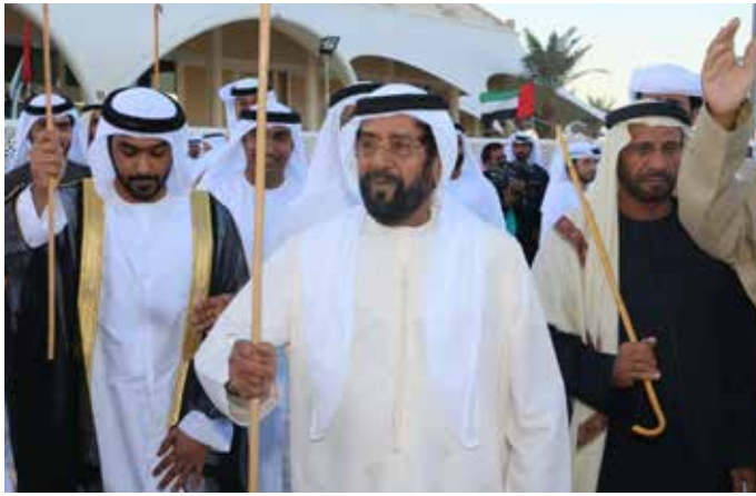
سمو الشيخ طحنون بن محمد آل نهيان ومحمد سيف بن نعييف في لوحة اليولة في إحدى المناسبات