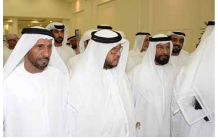
سمو الشيخ سلطان بن زايد والشيخ محمد بالركاض ومحمد بن سيف بن نعيّف