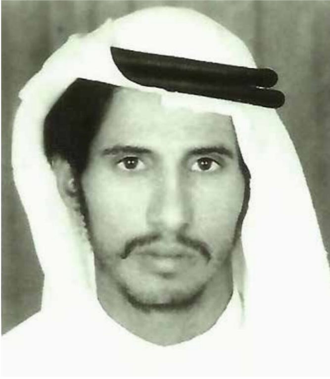
صورة قديمة للمؤلف