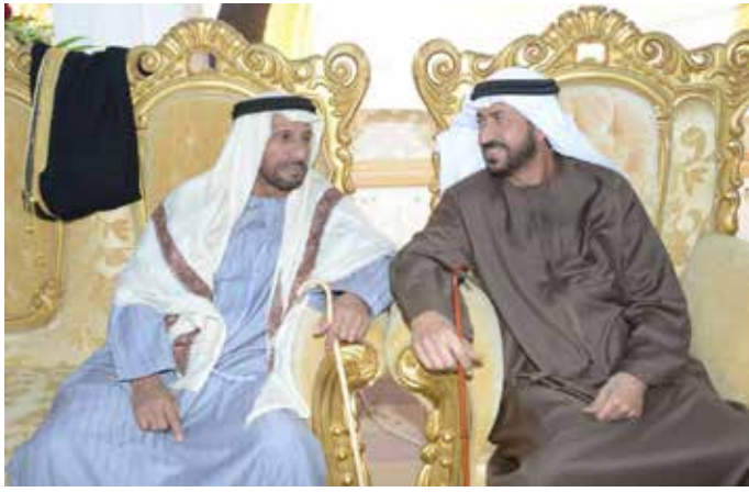
سعادة السفير سلطان بن محمد القرطاسي ومحمد بن سيف بن نعيف العامري