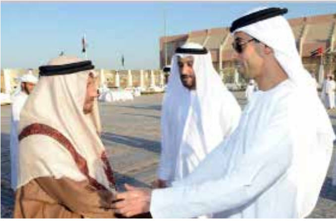
سمو الشيخ خالد بن زايد ومحمد بن سيف بن نعيف وفي الصورة مبارك بالروضه العامري