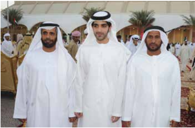
الشيخ هزاع بن طحون آل نهيان و سعيد سيف بن نعيّف العامري ومحمد سيف بن نعيّف العامري