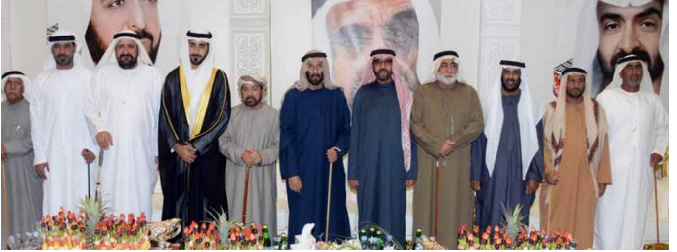
الشيخ حمد سلطان الدرمني والسفير محمد أحمد المحمود وسالم الراشدي وأحمد آل سودين ومحمد بن نعيّف العامري ولقيف من الشخصيات