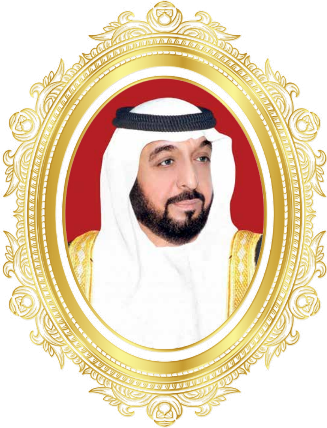
صاحب السمو الشيخ خليفة بن زايد آل نهيان رئيس دولة الإمارات العربية المتحدة