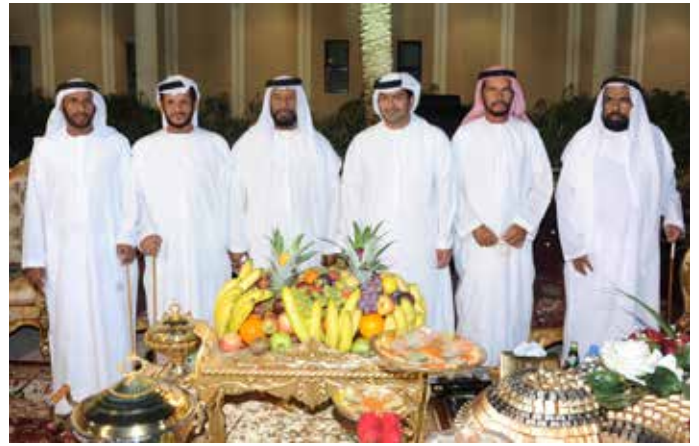
الشیخ خلیفة بن سعید آل نهیان و الشیخ محمد بالركاض ومظفر بن محمد ومحمد بن نعيف و علی یساره سعید بن محمد بن زاہرہ و الشیخ حمد بن سالم بالركاض