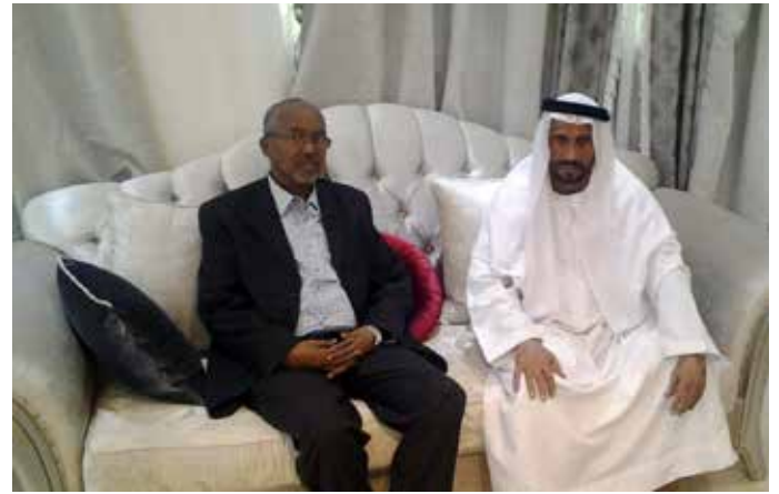
عبد الرحمن السلعي نائب رئيس الصومال ومحمد بن سيف بن نعييف