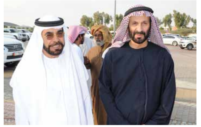
الشيخ حمد بن سلطان الدرمني وسعادة سعيد بن حرمل الظاهري أثناء حفل بن نعييف