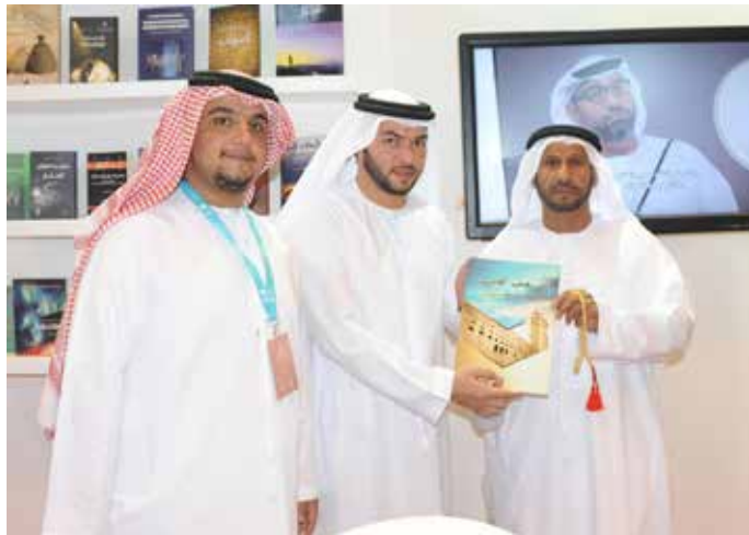
خلال المشاركة في المعرض الدولي للكتاب ابو ظبي 2107