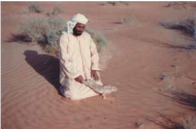
...وأثناء رحلة صيد في عروق الشبية