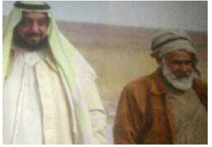
صاحب السمو الشيخ خليفة بن زايد ومحمد بن عبد الله بن نعييف العامري في رحلة خارج الدولة