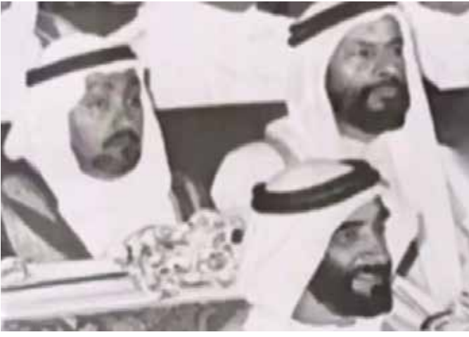
المغفور له بإذن الله الشيخ زايد بن سلطان آل نهيان والشيخ حمد بن سيف الشرقي والشيخ محمد بالركاض شيخ قبيلة العوامر