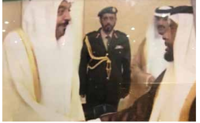
صاحب السمو الشيخ خليفة بن زايد والشيخ محمد بن ركاض