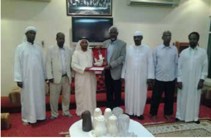
محمد بن نعيف يهدي وزير الداخلية الصومالي خنجر فضي