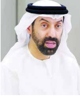
بقلم: سعادة أحمد شبيب الظاهري

قال تعالى ﴿وجعلناكم شعوباً وقبائل لتعارفوا، إن أكرمكم عند الله أتقاكم﴾ صدق الله العظيم.