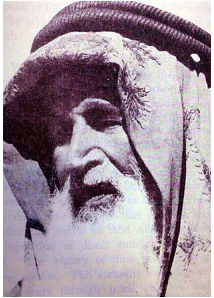
الزعيم الطعيف بن بروس