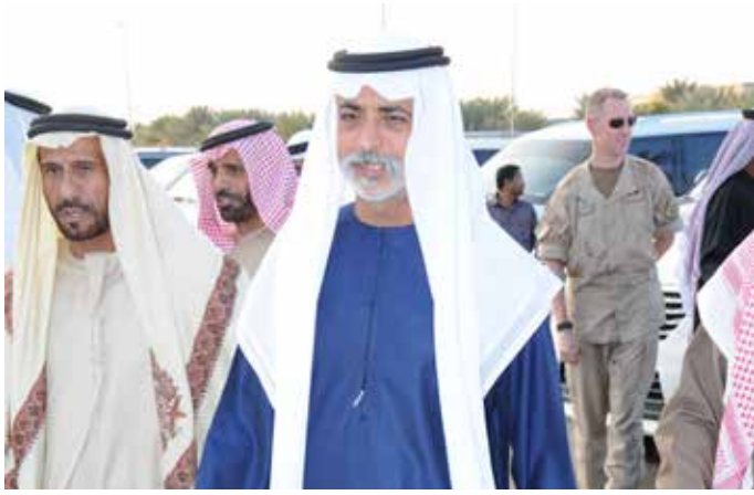
الشيخ نهيان بن مبارك ومحمد بن نعيّف وسعيد بن نعيّف أثناء حفل بن نعيّف