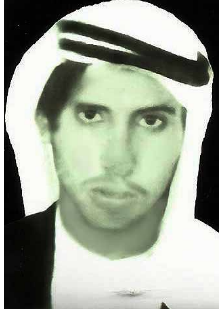
صورة للمؤلف في مطلع شبابه