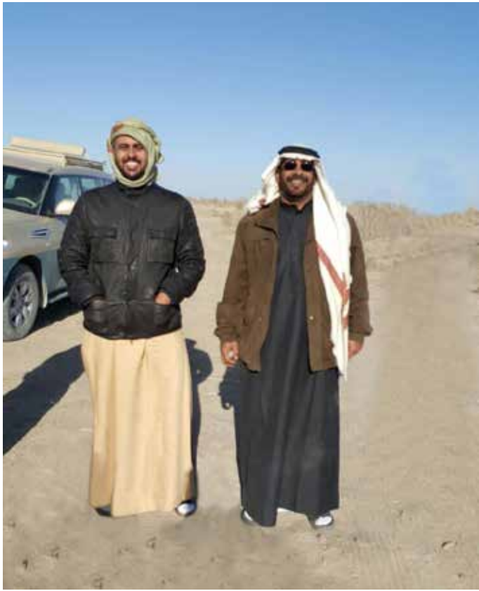
الشيخ ذياب بن محمد بن زايد وحمد بن سالم بن العوف أثناء الصيد