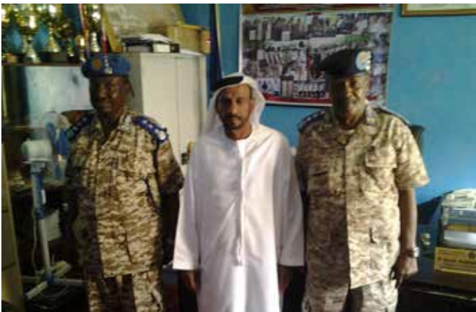
محمد بن نعيف وإلى يمينه مدير شرطة الصومال عبد الله فضل وإلى يساره نائب مدير الشرطة