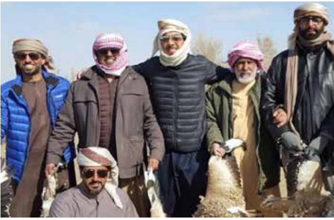
سمو الشيخ منصور بن زايد ومحمد بن عبد الله بن نعيف ومحمد البواردي ومجموعة من الرجال