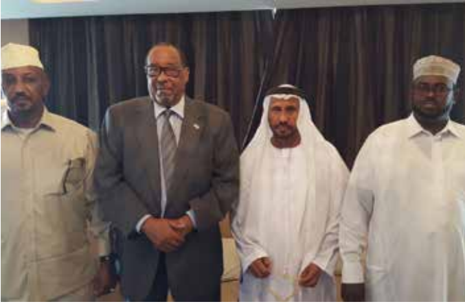
رئيس جمهورية الصومال ومحمد بن سيف بن نعيف ومرافقي الرئيس