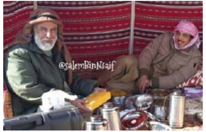
سمو الشيخ منصور بن زايد والمرافق الخاص محمد بن نعيف أحد أعيان قبيلة العوامر