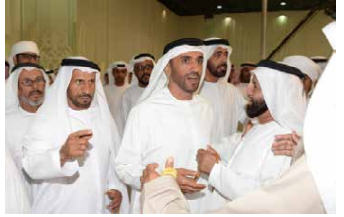
سمو الشيخ نهيان بن زايد وسالم بن غصنه ومحمد بن نعيّف ويظهر في الصورة الشيخ سالم بالركاض وسالم بن زعيتر وسهيل بن نخيرات