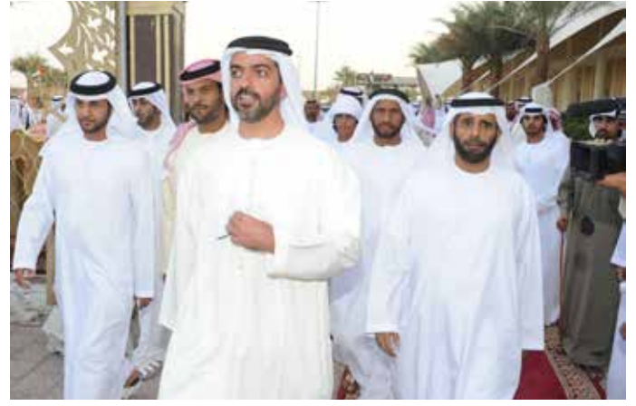
سمو الشيخ حامد بن زايد آل نهيان وسعيد سيف بن نعيّف