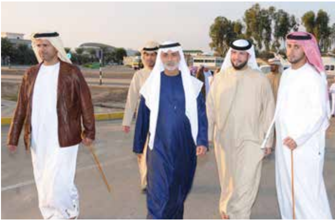
الشيخ نهيان بن مبارك وفي استقباله سيف بن نعيّف وسالم بن نعيّف وإلى يمينه الشيخ نهيان بالركاض