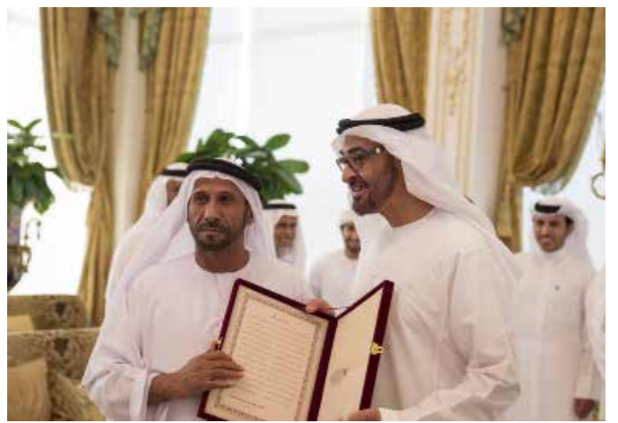
قصيدة من المؤلف مهداة لصاحب السمو الشيخ محمد بن زايد آل نهيان