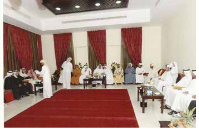
سمو الشيخ حمدان بن زايد يزور عائلة بن نعيف في مجلس الوثبة