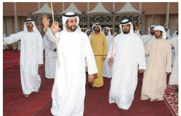
سمو الشيخ طحنون بن محمد والشيخ ذياب بن طحنون والشيخ خليفة بن طحنون أثناء حفل بن نعيّف العامري