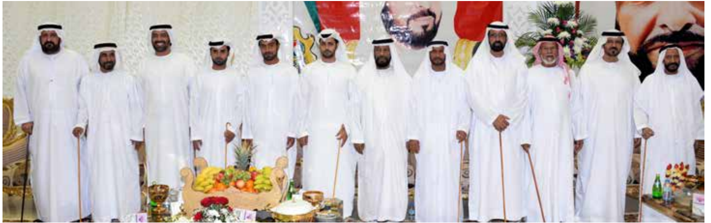
الشيخ محمد بن سعيد آل نهيان والشيخ محمد بالركاض ومحمد بن نعييف والشيخ سالم بالركاض ومجموعة من كبار الشخصيات