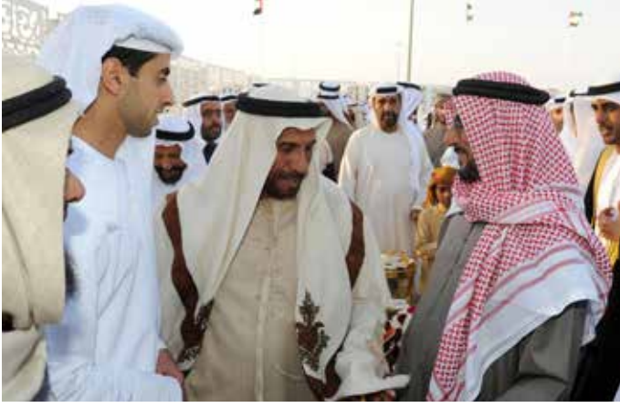
سمو الشيخ خالد بن زايد آل نهيان والشيخ فيصل بن سلطان القاسمي في حديث ودي مع محمد بن سيف بن نعيف العامري