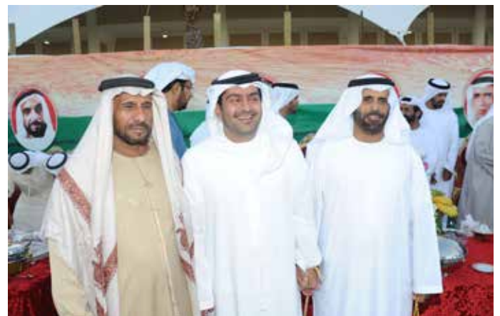
الشيخ خليفة بن سعيد آل نهيان ومحمد وسعيد بن نعيّف