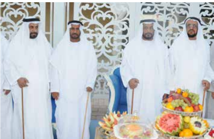
معالي محمد بن بدوه وعبيد اليبهوني ومحمد بن نعيّف وسعادة عبد الله بن بدوه الدرمي