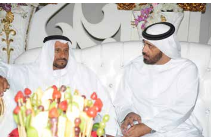
سعادة الشيخ سالم بن محمد بالركاض ومحمد بن سيف بن نعييف العامري