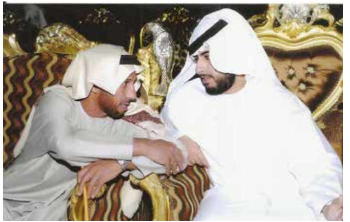
الشيخ زايد بن طحنون ومحمد بن سيف بن نعيّف العامري