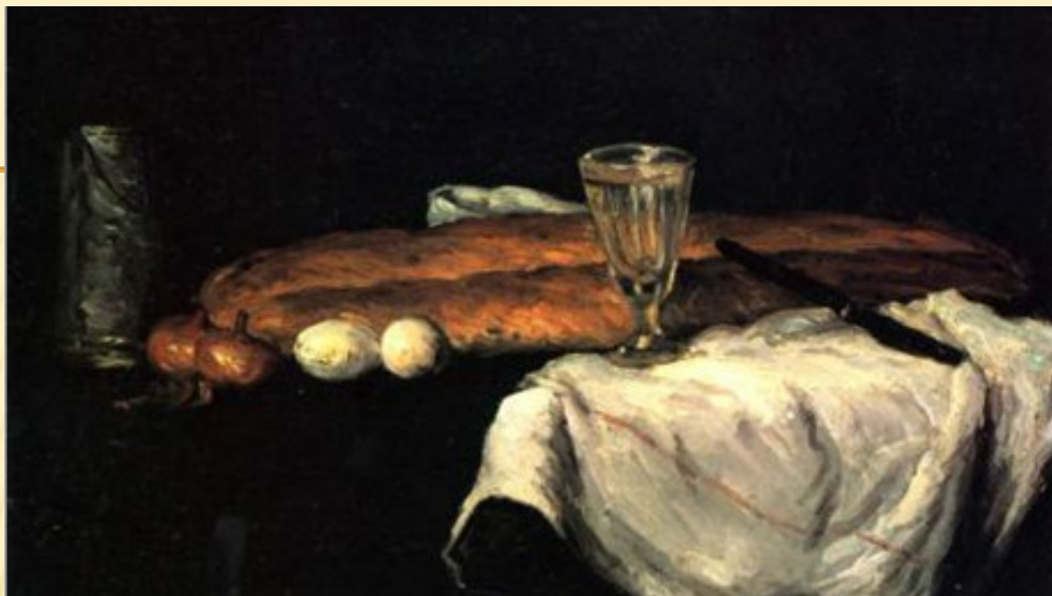
Paul Cézanne «Still Life with Bread and Eggs» («Νεκρή φύση με ψωμί και αυγά»)

Ο Paul Cézanne δημιούργησε τον συγκεκριμένο πίνακα το 1865, εμπνευσμένος από τις βασικές τροφές και τη νεκρή φύση. Ο Cezanne ζωγράφισε στον καμβά του δύο φρατζόλες ψωμί, δύο κρεμμύδια, δύο αυγά, ένα μαχαίρι κι ένα ποτήρι. Αυτά είναι και τα βασικά συστατικά ενός απλού αλλά βασικού γεύματος.