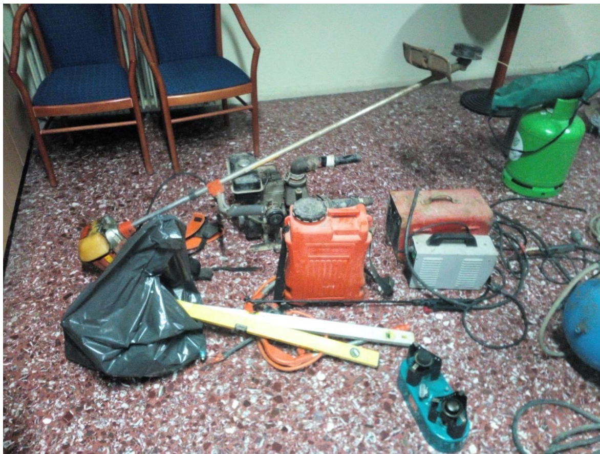
Κοζάνη, 15 Νοεμβρίου 2017