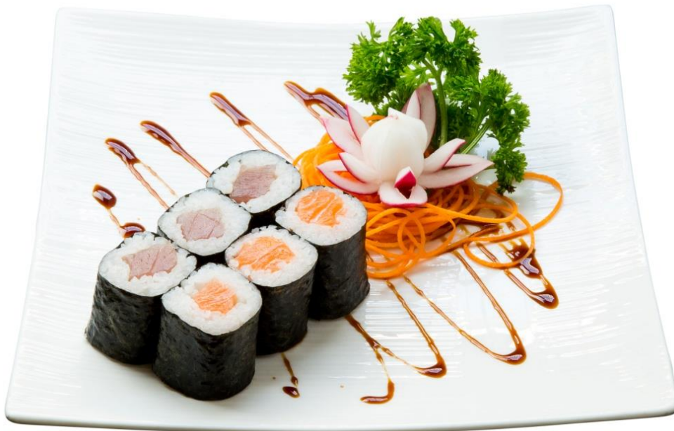
S2. Maki 3.90€ 6 Maki nach Wahl: (Lachs, Thunfisch, oder Gemüse)