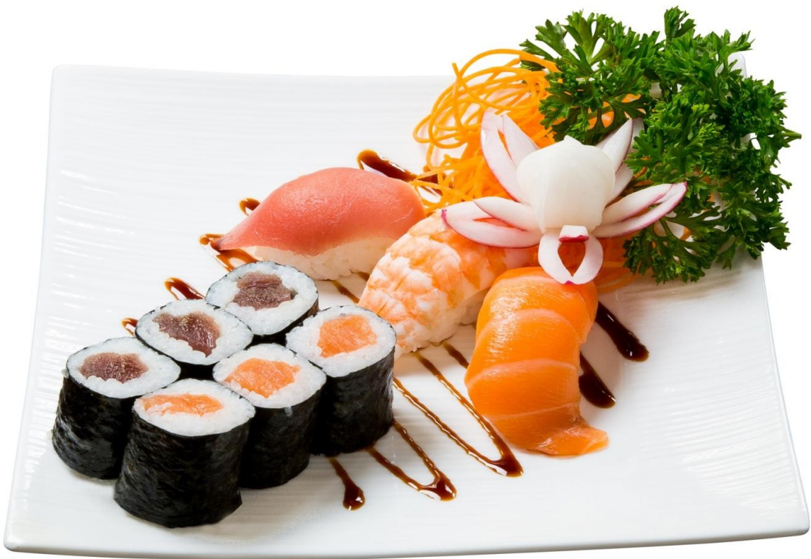
S9. Maki Nigiri Mini 11.90€ 6 Maki (Salmon, Tuna) 3 Nigiri (Salmon, Shrimp) Or by choice*