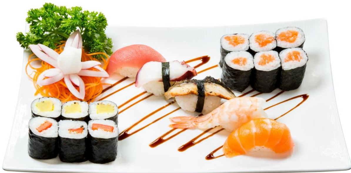
S6. Maki-Nigiri 2,k 16.90€ 12 Maki (6 Salmon, 3 Avocado, 3 Cucumber) 5 Nigiri (Salmon, Tuna, Shrimp, Squid and Octopus) Or by choice*

*Nigiri (Choice of salmon/tuna/shrimp/eel/octopus)