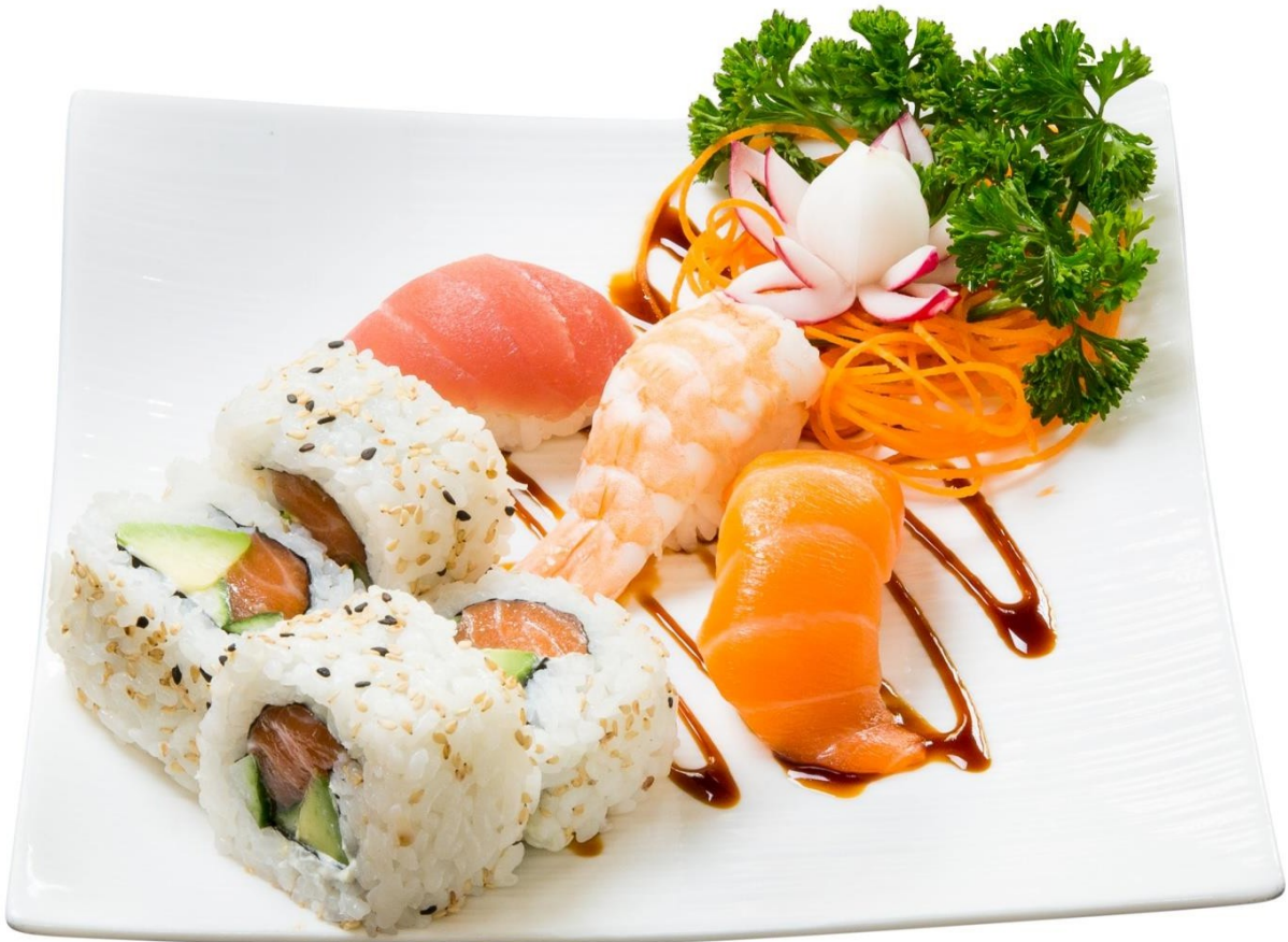
S10. Nigiri-Inside-Out-Rolls k 12.90€ 3 Nigiri (Salmon, Shrimp) Or by choice* 4 Inside-Out-Rolls (Salmon, Cucumber, Avocado)

*Nigiri (Choice of salmon/tuna/shrimp/eel/octopus)