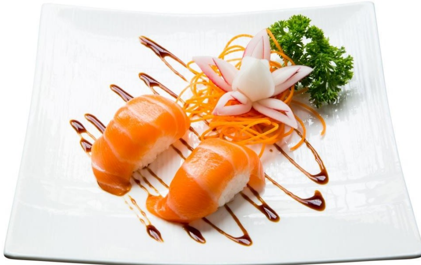
S1. Nigiri 4.90€ 2 Nigiri (Lachs) oder nach Wahl*

Bei uns werden alle Sushi nach ihrer Bestellung frisch zubereitet!