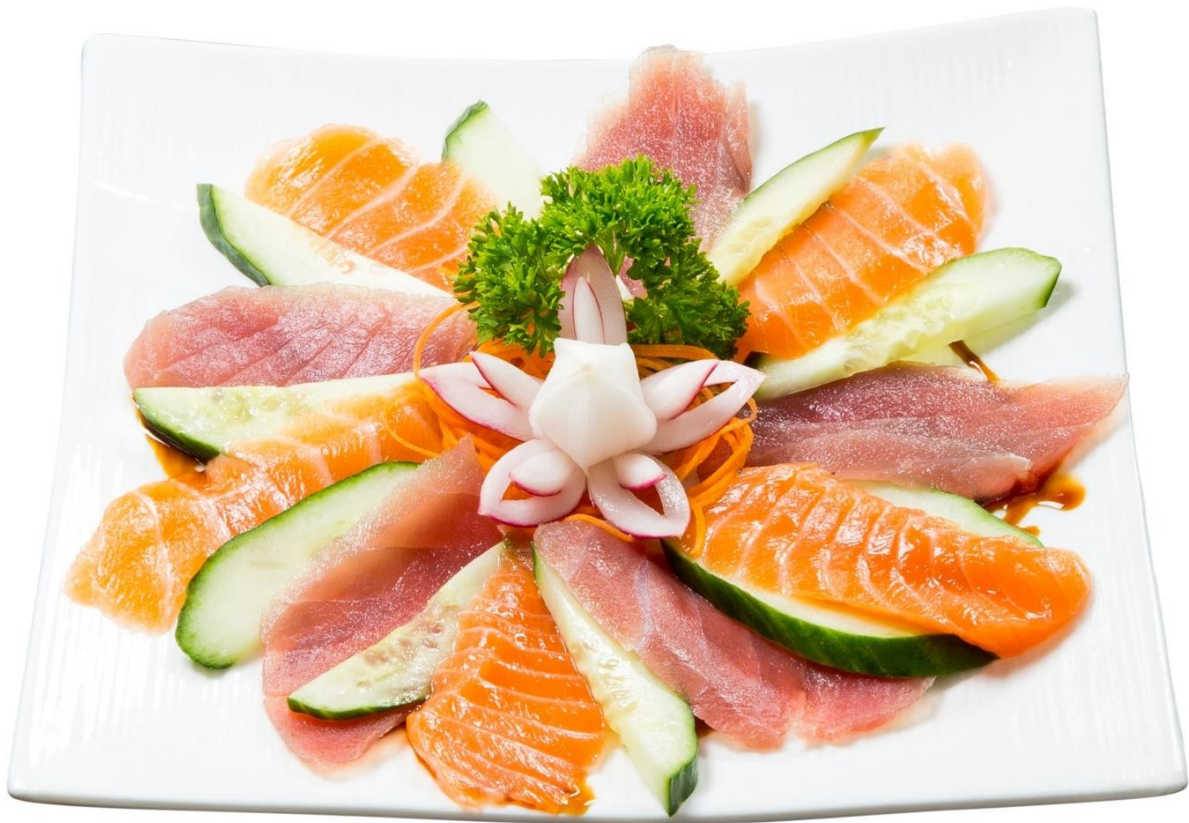
S5. Sashimi 16.90€ (Salmon 5 Strip, Tuna 5 Strips) Or by choice*