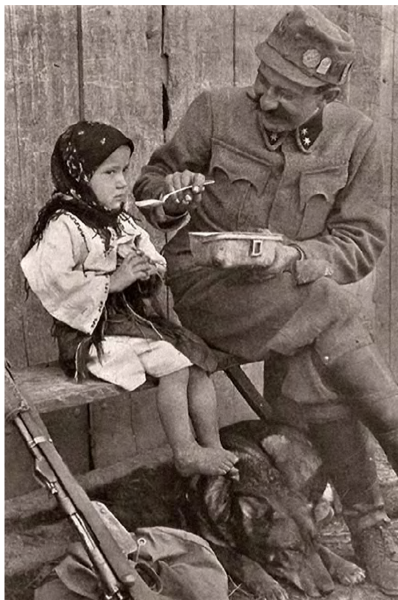
▲ Вояк цісарсько-королівської армії годує дівчинку, Галичина, 1914-1918 рр.

Чудовим прикладом зреалізованого материнства є Пречиста Діва Марія. Вона також, будучи ще зовсім юною, на слова архангела Гавриїла «ось ти зачнеш у лоні й вродиш сина й даси Йому ім'я Ісус» (Лк. 1,31) покійно схилиє голову і відповідає: «Я Господня слугиня: нехай зі мною станеться по твоєму слову!» (Лк. 1,38).