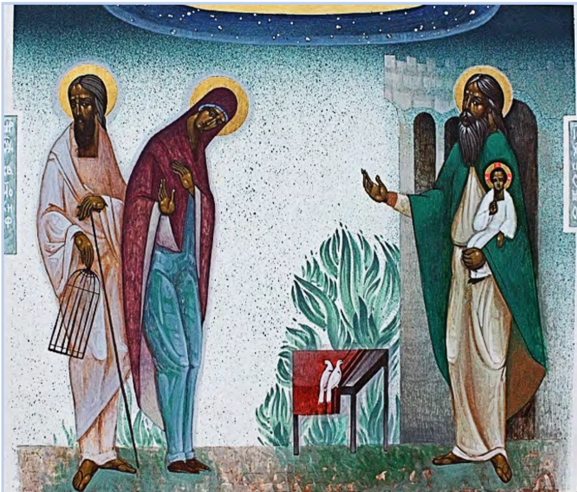
▲ Іван Дашко, «Принесення Ісуса до храму»

Хіротонія першого правлячого єпископа Аркадія Трохановського новоствореної Ольштинсько-Гданської єпархії УГКЦ Стор. 3