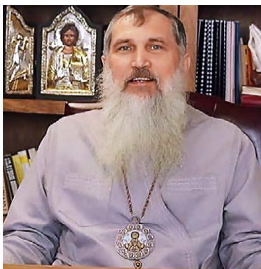
Владика Венедикт Алексійчук, правлячий архиєрей Єпархії Святого Миколая Чудотворця у Чикаго. Подано за відеозаписом «Живого телебачення».

В нас немає рішення, що маємо робити, як поступати, але саме тому на спільній, на особистій молитві маємо бути з Богом, а Бог є рішення і відповідь на все, в Бозі є вирішення, як вийти з цієї кризи, з цієї ситуації, в якій тепер перебуває людство.