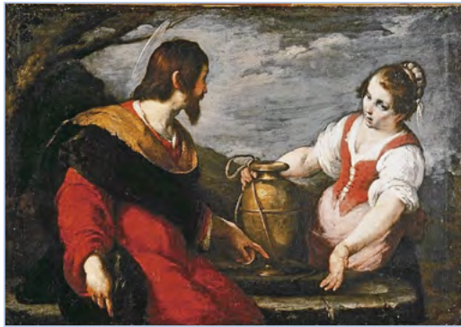
Бернардо Строцці (1581-1644), «Христос і самаритянка біля колодезя»

Варто також пам'ятати, що Ісус розповів цю притчу, відповідаючи на запитання: «А хто мій ближній?». В ці часи слово «ближній» вказувало на найближчих, маючи на увазі те, що допомагати слід тому, хто належить до тієї самої групи. Для деяких тогочасних юдеїв самаряни вважалися негідними, нечистими людьми, тож не належали до отих ближніх. Ісус повністю перевертає цей підхід: Він «не кличе запитувати про те, ким є ті, що близькі нам, але, радше, самим ставати ближніми». Запрошення полягає в тому, щоби бути присутніми поряд з людиною, що потребує допомоги, не запитуючи про її приналежність до власного кола. Самарянин, який став ближнім для пораненого юдея, переступив через «всі культурні та історичні бар'єри». Висновком, який робить Ісус, є слова: «Йди й ти чини так само». Це означає, що й ми повинні відкласти будь-які відмінності та перед обличчям страждання ставати ближніми для будь-кого (80–81).