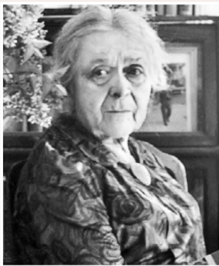
▲ Ізидора Косач-Борисова

Тато, обтяжений службою та своїм господарством, не мав можливості дуже багато приділяти мені уваги, хоч мене пестив чи не найбільше. Отже, найбільше опікувалася тоді мною Леся. Хоч я ще тоді була мала, мала всього 5–6 років, проте дуже добре і виразно пам'ятаю той час, до дрібниць включно. Пізніше, бувало, як згадувала з Лесею той час, то Леся просто дивувалася, як вірно зберігає пам'ять вражіння дитинства.