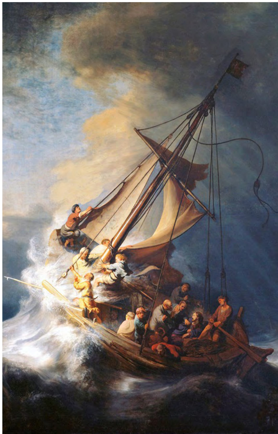
Рембрандт ван Рейн, «Христос під час шторму на морі Галилейському»

Василій – великий своїми природними даруваннями, своєю красномовністю, своїм письменницьким хистом, своєю глибокою наукою. Але в першу чергу він великий святістю свого життя. Майже від колиски він бачить довкруги себе самі великі постаті Святих: своєї бабуні, матері, своєї старшої сестри Макрини і своїх братів. Тому не диво, що згодом і сам Василій виринає перед нами таким неземним і праведним, що хочеться про нього повторити слова св. Єфрема: «Це вибраний царський посуд».