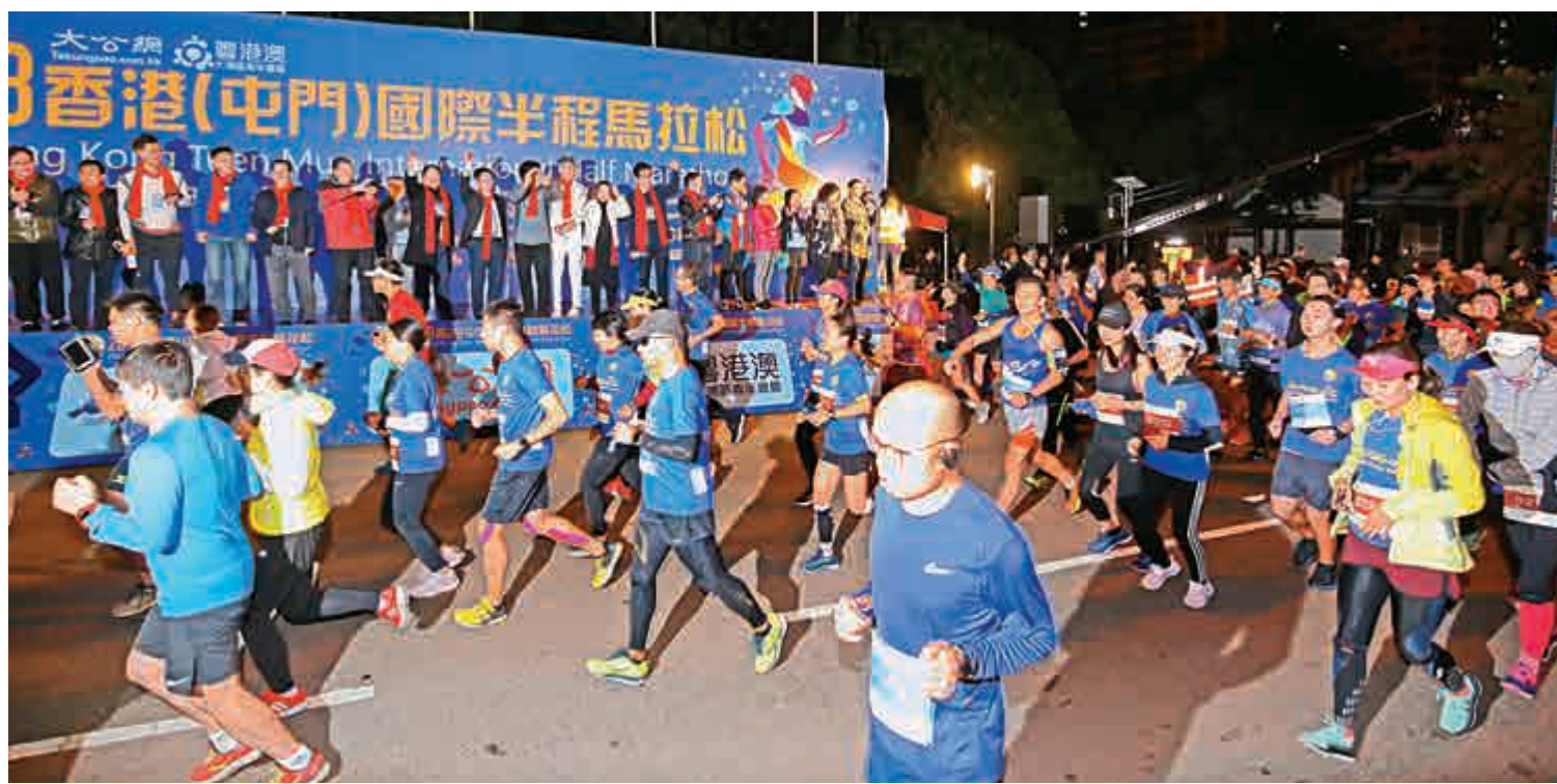
▲嘉賓們在主禮台上為跑手們打氣

白山的六角形雪花非常美麗，大家可以近距離看它；第三，香港拉松（以下簡稱長白山國際雪馬），計劃在明年4月底舉辦，可以在裏面喝咖啡；第四，香港人愛喝湯，長白山的人參燉土雞湯味道不會比香港最好的湯差；第五，長白山二道白河鎮森林覆蓋率94.5%，有5、6個五星級的賓館在森林裏面；第六，長白山每立方厘米有8到12萬個負氧離子，空氣極好；第七，長白山有世界頂級的礦泉水；第八，前七項都是硬件，最重要的是，長白山人民歡迎大家，歡迎香港人到長白山旅遊、跑「雪馬」。