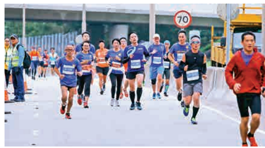
▲跑手們在賽事中全力以赴，爭取佳績