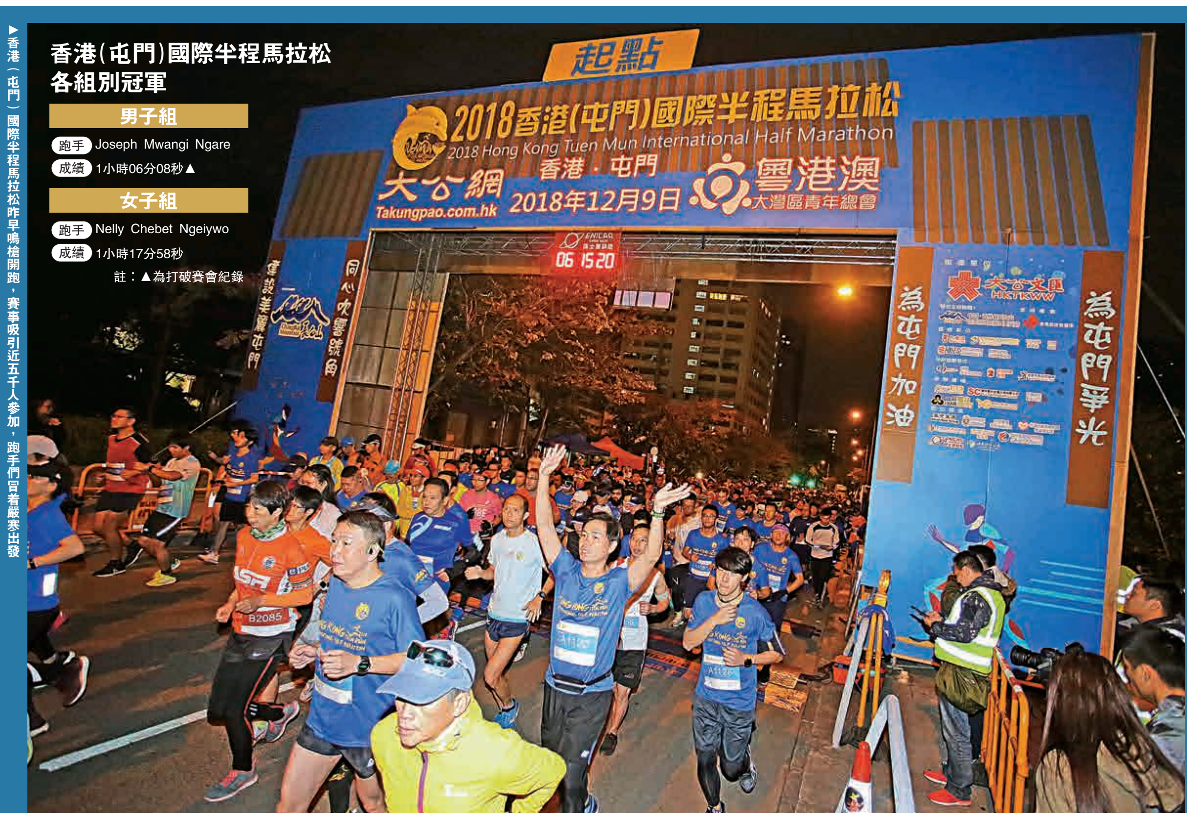
▲香港（屯門）國際半程馬拉松昨早鳴槍開跑，賽事吸引近五千人參加，跑手們冒着嚴寒出發

來採取了一系列舉措來改善屯門河環境，包括修繕欄杆、路面、路燈，以及完善公園娛樂設施等，「在本屆賽事後組織親子遊活動，也是希望讓更多屯門居民知曉屯門河環境改善工程的成果。」 除了大力改善周邊環境，屯門河水質情況也受到多方關注。據了解，渠務署計劃在明年為屯門、大圍、火炭、佐敦谷等多條河道及明渠進行活化工程，包括於河旁加入綠化及行人道、興建「魚梯」、水上活動設施等，以改善生態環境及供市民親水。