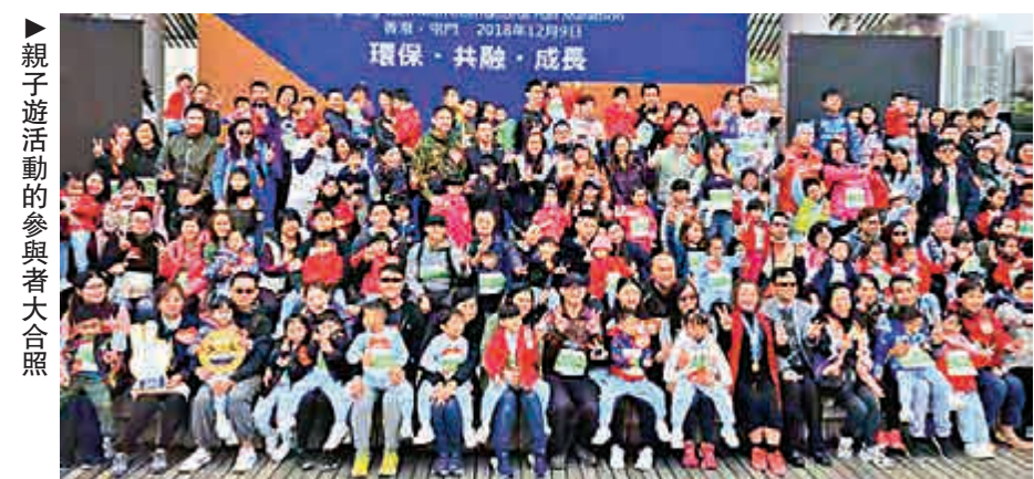
▲親子遊活動的參與者大合照