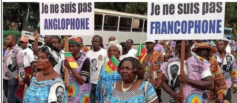
Des manifestants le 1er octobre à Douala, au Cameroun. Entre autonomie et indépendance.

Publié le 14/11/2017 à 14:48 | Le Point Afrique