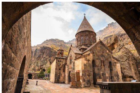
Scorcio del monastero rupestre di Geghard