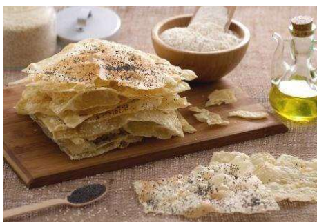
Lavash, il tipico pane armeno