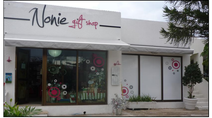
Λεωνίδα Παπακώστα 35, Χλώρακα – τηλ. 99352016 Είδη δώρων και Χριστουγεννιάτικες διακοσμήσεις

που θα τον φωτίζει να είναι πλήρης, ζώσα και λογική. Να μάθει ότι μέσα της κρύβει μεγάλες αλήθειες που ανυψώνουν το πνεύμα και την ψυχή των ανθρώπων όσο γίνεται ψηλότερα, στο θρόνο του Θεού. Να μάθει ότι υπάρχει αυτό το φως μέσα στην πίστη της εκκλησίας που σε εποχές σκότους και δουλείας, με τα σύμβολα και τη θεϊκή παρουσία μέσα στις καρδιές μας, με το να κάνουμε τον σταυρό στο φαγητό μας, με κάποιο τροπάριο στα χείλη μας, με την ακολουθία, με τη νηστεία, με τις καμπάνες των εκκλησιών που δεν μας αφήνουν να ξεχαστούμε ολότελα, διατηρούμε την πίστη μας που τη φέρουμε έως τώρα, ακτίνα φωτός πολυτίμο και μοναδική της αίριον