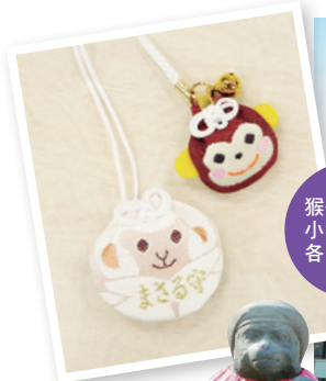
猴子御守/ 小猴子御守 各 ¥500