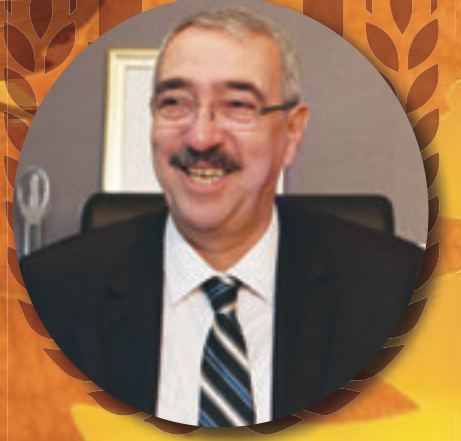
Emin HALEBAK Lüleburgaz Belediye Başkanı

“Uluslara konuk olduk, ulusları konuk ettik. Toplumu geliştirmenin medeniyetler arası diyaloglarla mümkün olabileceğinin bilinciyle pek çok yeni iletişim olanağı yarattık. İletişime açık toplumlar gelişime de açıktırlar.”