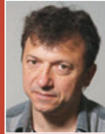
Pencho Dobrev Bulgaristan