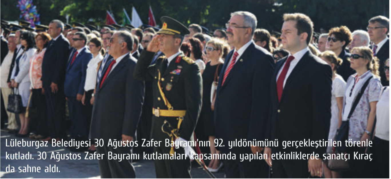
Lüleburgaz Belediyesi 30 Ağustos Zafer Bayramı'nın 92. yıldönümünü gerçekleştirilen törenle kutladı. 30 Ağustos Zafer Bayramı kutlamaları kapsamında yapılan etkinliklerde sanatçı Kıraç da sahne aldı.