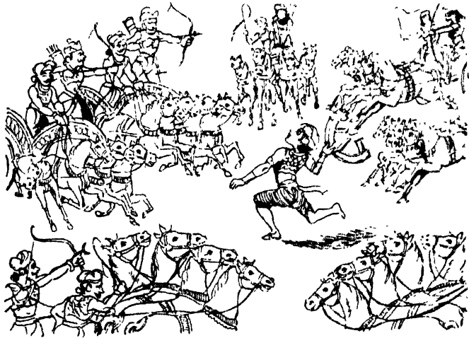
একা অভিমন্যু চক্রবাহের মধ্যে

পাণ্ডবদের নয়নের মণি, পরম স্নেহের ধন, যোল বছরের তরুণ বীর অভিমন্যু প্রবল বেগে চক্রবাহ ভেদ করলেন। সিংহ যেমন বিনাশ করে হাতীর দলকে, তেমনি করে তিনি বিনাশ করতে লাগলেন কুরু সৈন্যদের। দ্রোণাচার্য খুবই বিস্ত্রত বোধ করতে লাগলেন। তবে মনে মনে খুব খুশীও হলেন। পিতার যোগাপুত্র বটে অভিমন্যু। কিন্তু ভীম ও অগ্ন্যায় পাণ্ডবেরা অভিমন্যুর সঙ্গে সঙ্গে বাহের মধ্যে প্রবেশ করতে পারলেন না। বাধা দিলেন জয়দ্রথ। জয়দ্রথ