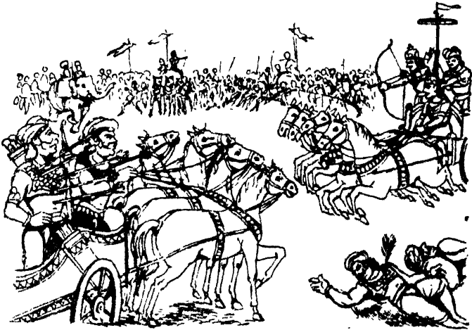
পিতামহ শিখণ্ডীকে দেখে অস্ত্র সংবরণ করলেন

তীর এসে ভীষ্মের সমস্ত দেহকে জর্জরিত করতে লাগল কিন্তু ভীষ্ম শিখণ্ডীকে দেখে অস্ত্র সংবরণ করলেন। পিতামহের সর্বদেহ তীরে তীরময় হয়ে গেল। তিনি অবসন্ন হয়ে পড়লেন।