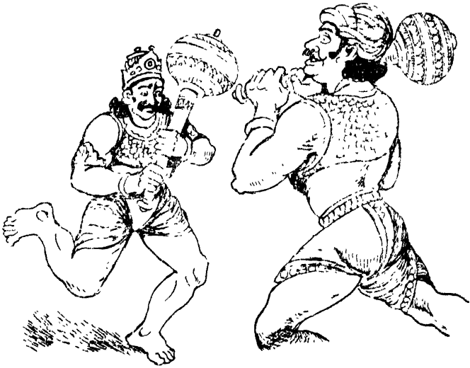
ভীম প্রবল বিক্রমে ছুর্যোধনকে আক্রমণ করলেন

ভীম অধিক বলশালী হলেও ছুর্যোধন ছিলেন অধিক কৌশলী। ছুর্যোধন একবার এমন আঘাত করলেন যে ভীম সংজ্ঞাহীন হয়ে পড়লেন। কিন্তু একটু পরে যখন চেতনা ফিরে