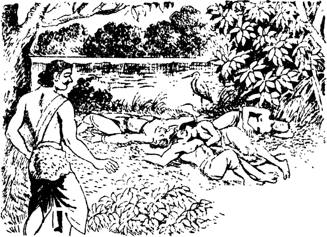
যুধিষ্ঠির দেখলেন—ইন্দ্রতুলা ভাইদের প্রাণহীন দেহ

করতে যাবেন তেমনি কে যেন অস্তুরীক্ষ থেকে বলে উঠল “আমার প্রশ্নগুলির উত্তর না দিয়ে জল খেও না। উত্তর না দিয়ে যদি জল স্পর্শ কর তবে প্রাণ হারাবে।” পিপাসায় কাতর নকুল সে কথা না শুনে ডল খেতে গেলেন। আর সঙ্গে সঙ্গে তাঁর মৃত্যু হল। নকুলের দেহ দেখে যুধিষ্ঠির পাঠালেন সহদেবকে। অস্তুরীক্ষবাসীর সেই কথা অবজ্ঞা করে সহদেব যখনি জল পান করতে গেলেন তখনি তাঁরও নকুলের মত