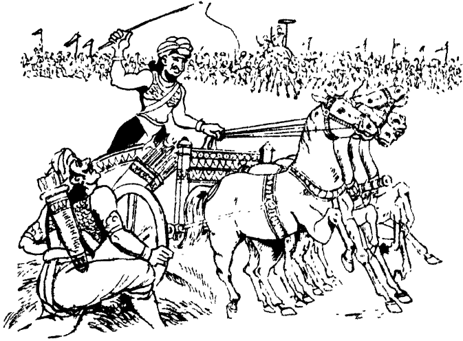
কর্ণের রথের চাকা মাটিতে বসে গেছে

মহারথী মিলে বালক অভিমন্যুকে বধ করেছিলে—সেদিন কোথায় ছিল তোমার এই ধর্মজ্ঞান ?”