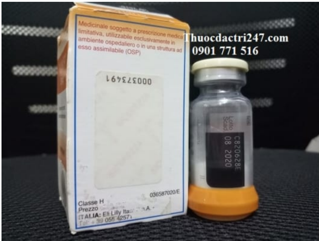
Thuốc alimta 100mg pemetrexed điều trị ung thư phổi – Thuốc đặc trị 247 (2)