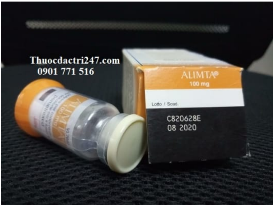
Thuốc alimta 100mg pemetrexed điều trị ung thư phổi – Thuốc đặc trị 247 (3)