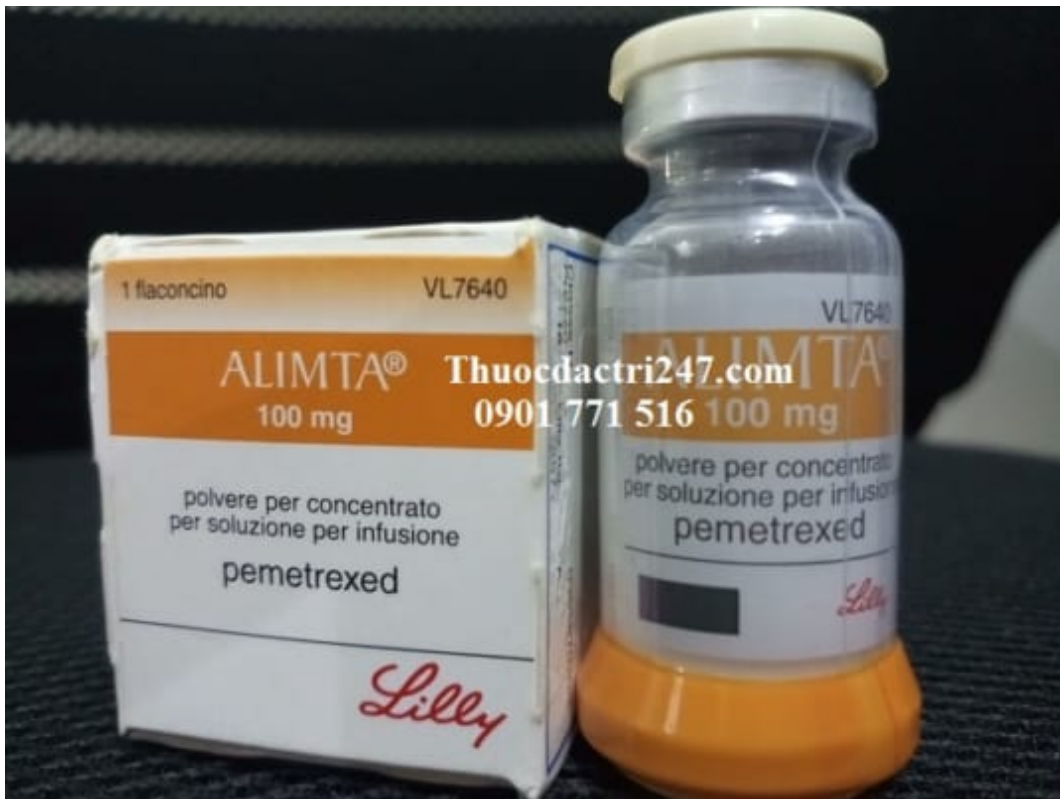
Thuốc alimta 100mg pemetrexed điều trị ung thư phổi – Thuốc đặc trị 247 (1)