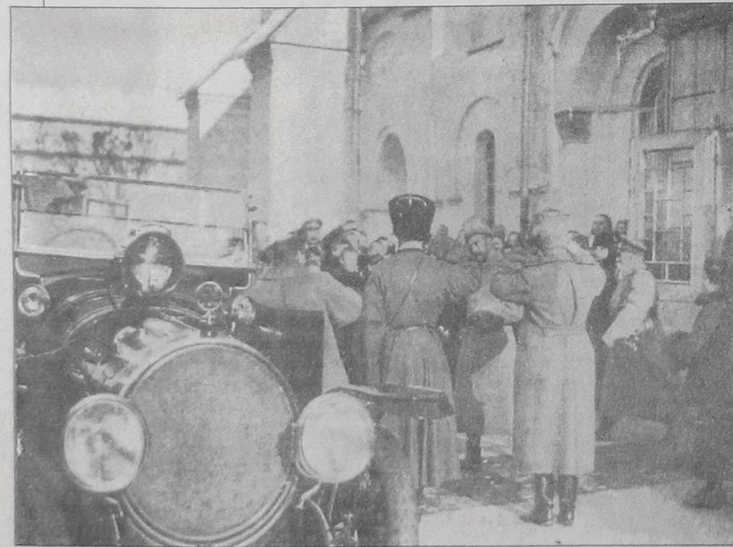
ЦАРЬ НИКОЛАЙ II У СОФИЕВСКОГО СОБОРА. ФОТО 1915 ГОДА

«Газета...» вспомнила, что в Киеве было названо в честь последних царствующих Романовых – площади, улицы, музеи, больницы и даже остров