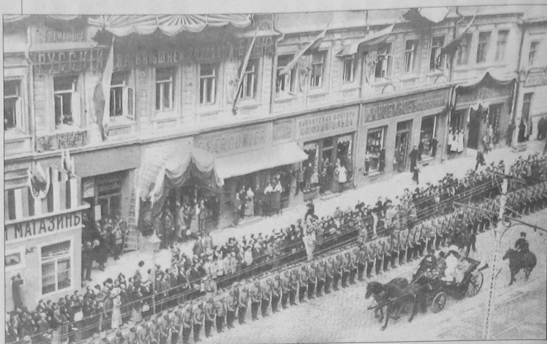
ПРОЕЗД СЕМЬИ РОМАНОВЫХ ПО КРЕЩАТИКУ, БЛИЗ УГЛА ПРОРЕЗНОЙ. ФОТО 1911 ГОДА

Многие годы на одной шестой части суши о последнем царе говорили почти исключительно как о «Николае Кровавом», виновнике Ходынки, расстрела мирной демонстрации 9 января 1905 года, бездарных военных поражений. Теперь отношение к нему существенно изменилось. В России Николай и его семья стали в полном смысле слова культовыми фигурами: Московский патриархат канонизировал жертв убийства 17 июля как святых страстотерпцев. У нас далеко не все разделяют такой пиетет перед погибшими Романовыми. Но, справедливости ради, отметим: именно в царствование послед-