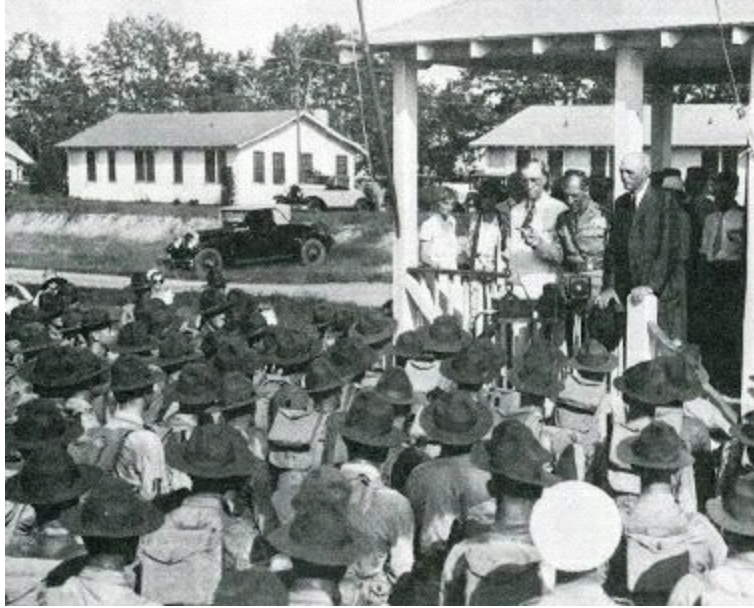
El general Smedley D. Butler se despide de «sus muchachos» en ocasión de su retiro, Base de la Infantería de Marina en Quantico, Virginia, 23 de septiembre de 1931.