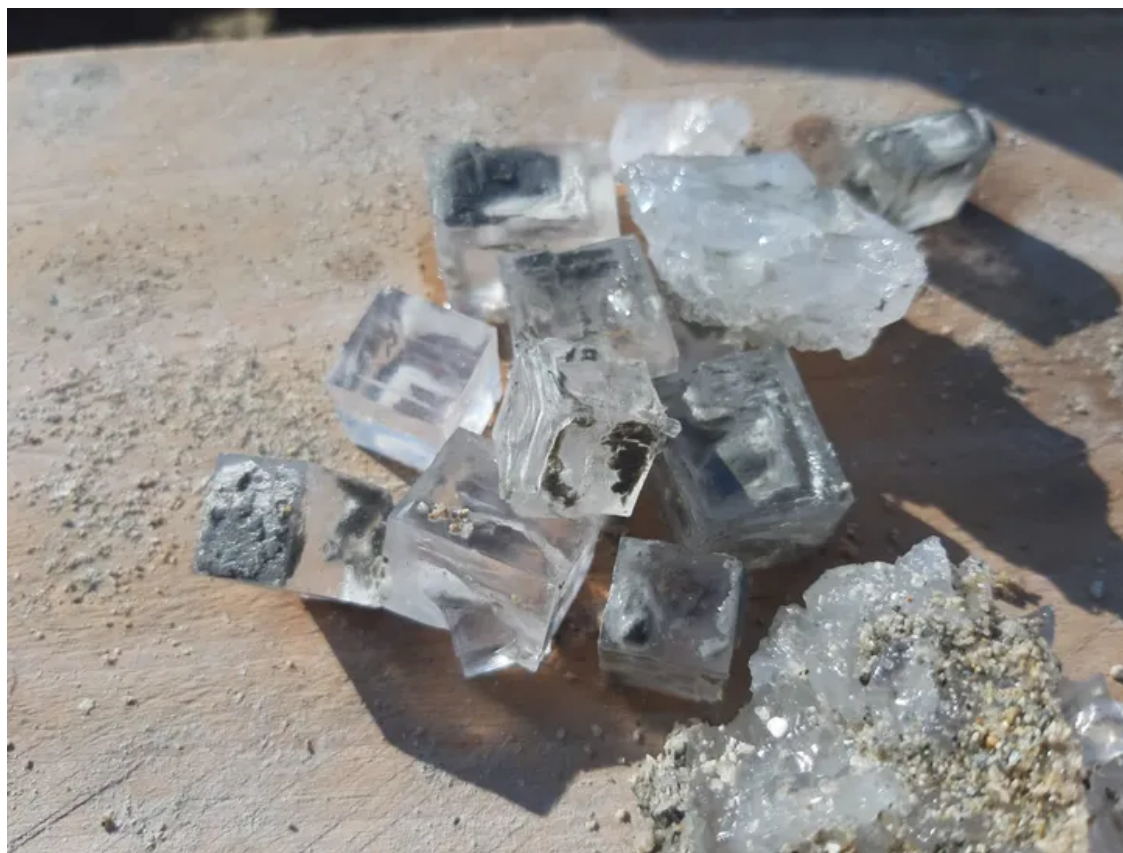
אפילו קוביות המלח לא מצליחות להפגיע. ככה זה כשהכל מרגיש קסום

אחר. ומה יותר נחוץ כעת מאיזו בריחה, במרחק שעתיים מכאן, לעולם אחר וקסום שבו יש רק שני צלילים – פכפוך מים לוהטים מחד ואוושת גלים קרים מאידך. אפילו קוביות המלח המסותתות שממתינות פה בתוך הבוץ לא מצליחות להפגיע. ככה זה כשאתה טבול בתוך ארץ הקסמים, הבולענים והמים החמים. ארץ שמשנה את פניה תדיר, שאדמתה בוערת, ולמרות הפלאים שנחשפים בה אסור להתעלם ממצבה. עד שנפקח את עינינו ונתגייס להצלת הארץ והים. בינתיים, צאו לראות אתה ארץ המטורפת הזו שנחשפת עוד ועוד בכל יום.