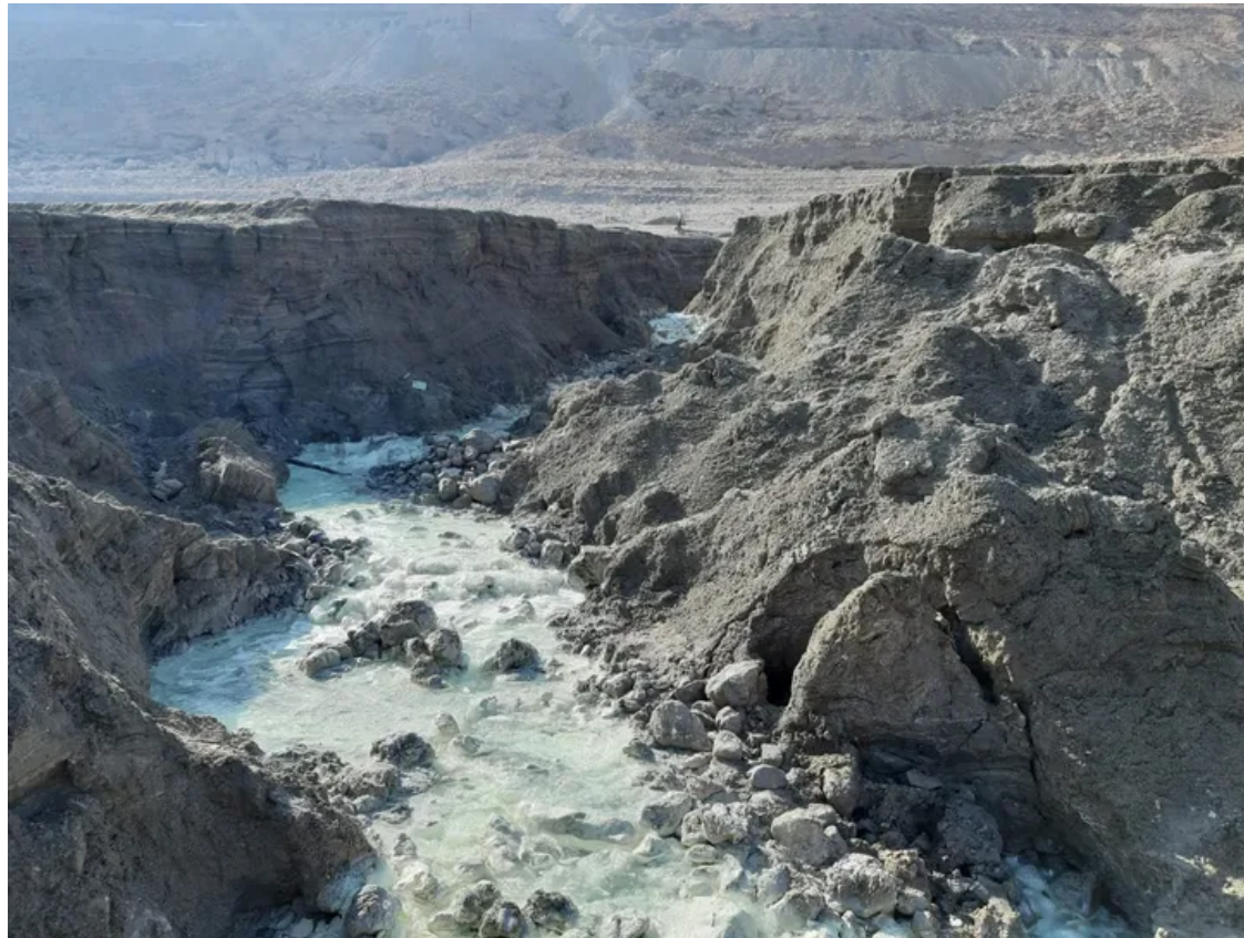
מים ב-50 מעלות פוגשים מי מלח קרירים, מול מצוקים דרמטיים

לא מעט בניסיון הנואש להציל את הים מהאדם. בעיקר כי כך ניתן להבין עד כמה מדובר באזור חד פעמי, פלא עולם אמיתי.