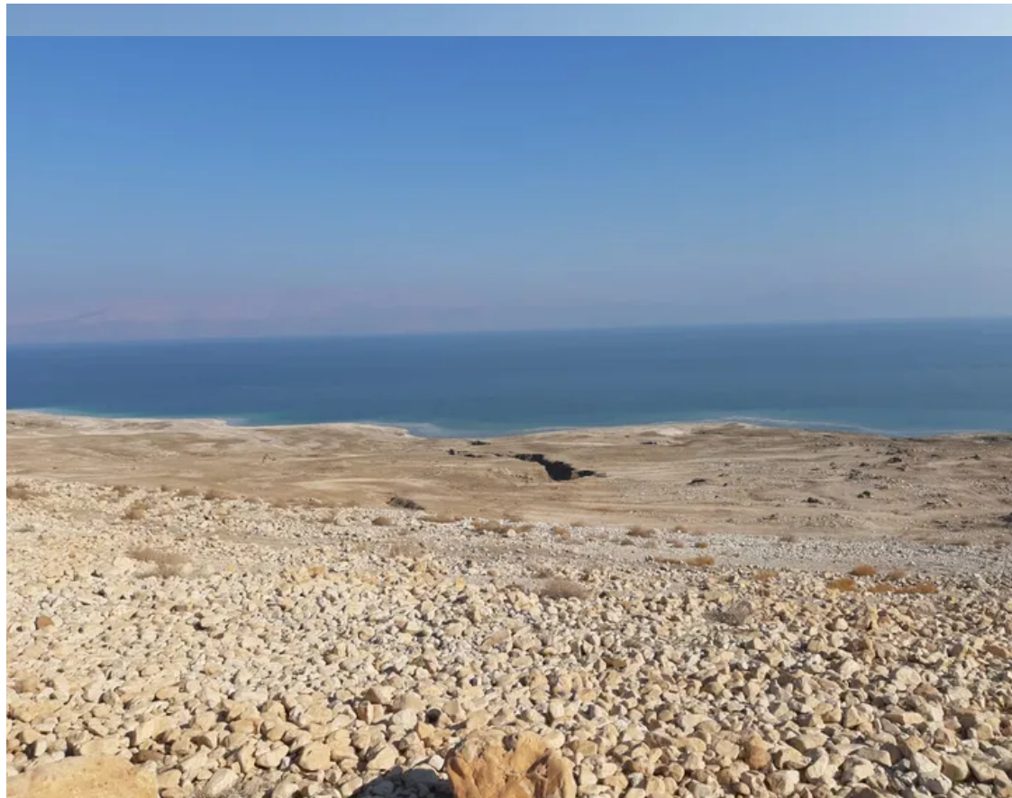
הנחל החם מרחוק. ריח הגופרית הוא מורה הדרך הטוב ביותר

המסע אל הנחל הזה, כאמור, מלא חשש – מהדרך וגם מסופה – האם בכלל נמצא אותו? כשמתקרבים לאזור וריח הגופרית מתחיל לעלות בנחיריים, מבינים שהחיפוש קרוב לסיומו והגוף והנפש קרובים לנירוונה שהם כל כך זקוקים לה. כשהגוף במים החמים, עם שילוב של טבילות במי הים הקרירים (אך לא קרים באמת, עדות לכך שהחורף לא באמת בא השנה) והעיניים נחות על ההרים הפראיים והדרמטיים של הרי דרום מדבר יהודה – המצוקים הנפלאים שמקבלים גוון סגלגל באווירה החורפית והיעלים שמתהלכים לאורך הדרך – מרגישים לא רק נפלא אלא גם בעולם כמעט