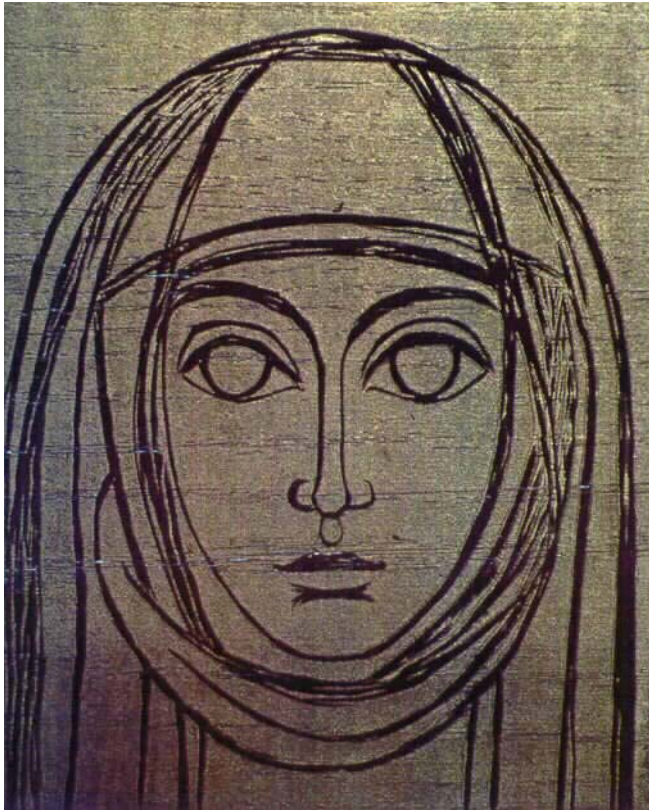
Ефросинья Полацкая, дереворит, І.Сурвіла (1985)

Еўфрасіння Полацкая , нябесная заступніца Беларускае землі, прыйшла на свет на пачатку XII стагоддзя ў Полацку, у сям'і князя Святаслава-Георгія. Дзяўчынку назвалі старажытным полацкім імем Прадслава. Слава пра розум і прыгажосць полацкай князёўны разнеслася далёка па славянскіх землях. Калі Прадславе споўнілася дванаццаць гадоў Прадслава абрала сабе шлях, пастанавіўшы стаць Хрыстоваю нявестаю, яна прыйшла ў манастыр і прыняла пострыг пад імем Еўфрасінні.