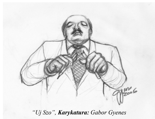
“Uj Szo”, Karykatura: Gabor Gyenes

Андрусъ Храпавіцкі аспірант Школи журналістики Університету Північної Кароліни, мешкає в Чейнел Гіл (США)