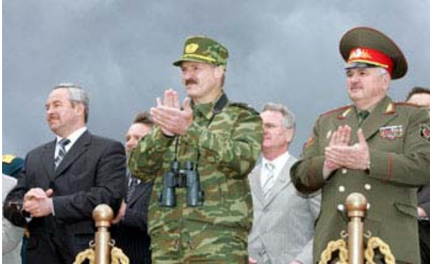
Президент Білорусі Лукашенко (посередині у маскувальній формі)