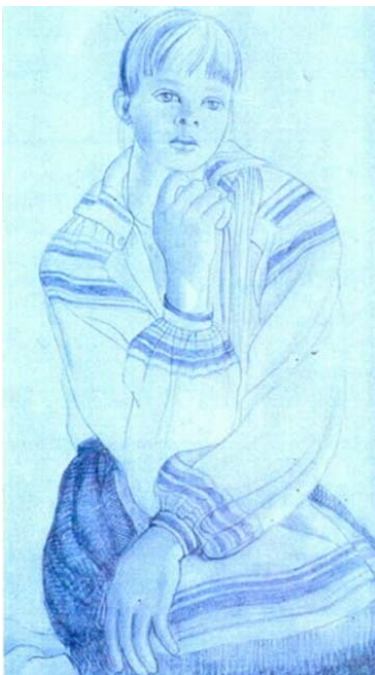
І. Сурвілла Паўлінка, 1981

- Поза крайнамі колишняго савітскаго блоку, чому заходні мас-медія, особливо тут, у Новому Сьвіці, так мало прывіраюць увагу до диктаторскаго рэжыму Лукашэнка, знікненьню людзей, безпідставных арыштаў та тюрэмных тэрмінаў? Зокрема, што робіцца для поінфармування грамадськості в Канаді? І як до цього офіційно відносіцца Оттава?