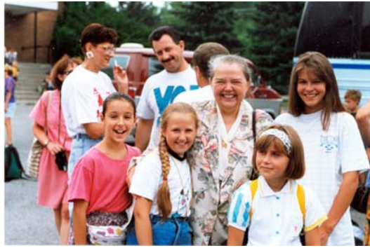
3 дзітмы Чорнобыля, 1994 р.

- 23 лістапада 2004 року, Ви від імені Рады БНР, направили привітання, тоді це кандидату у прэзідэнта, Віктарові Юценку. Багато білорусів, незважаючи на репресіі у себе вдома, прынялі участь у подіях на кійвському Майдані, були офіційнымі