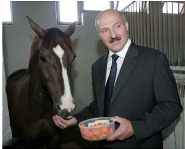
Аляксандр Лукашенко (справа з морквою)