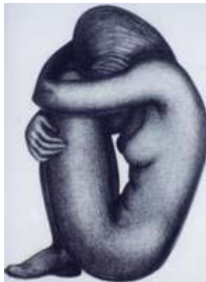
Івонка Сурвілла. Смутак