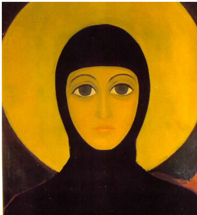
Oil Painting, Eufrosinnia, by Ivonka Symaniac-Survilla, 1975

“Калі я хачу штосьці па-мастацку выказаць, то, хочучы ці ня хочучы, я раблю гэта спосабам, які мяне пераносіць у сьвет лепшы, у штосьці прыгожае. Я не малюю ваенных сцэнаў, унікаю трывожных колераў... Папросту не магу. Я малюю ідэалізаваны сьвет.”