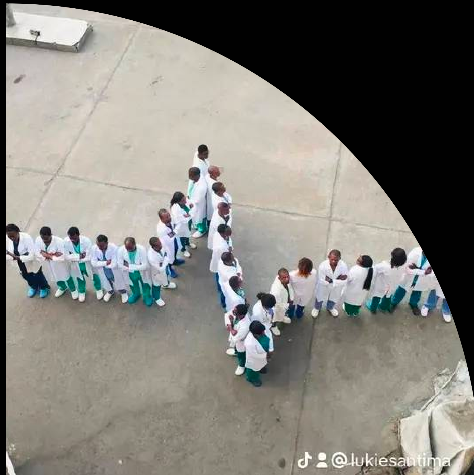
HÔPITAL GÉNÉRAL DE RÉFÉRENCE IME (INSTITUT MÉDICAL EVANGÉLIQUE)