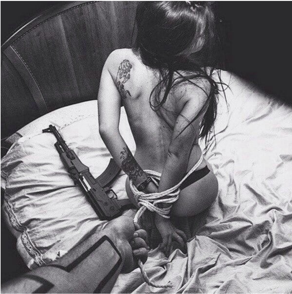
Кто Хочет Секса В Дзержинске