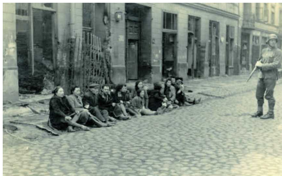
• Żydzi wyciągnięci z kryjówek podczas powstania w getcie. Zdjęcie z raportu Jürgena Stroopa

Wiemy również, jak trujący bywa posiew zbrodni. Przymusowe uczestnictwo narodu polskiego w krwawym widowisku, spełniającem się na ziemiach polskich, może nadto wyhodować zobojętnienie na krzywdę, sadyzm i ponad wszystko groźne przekonanie, że wolno bliźniego mordować bezkarnie. Kto tego nie rozumie, kto dumną, wolną przyszłość Polski śmiałyby łączyć z nikczemną radością z nieszczęścia bliźniego — nie jest ani katolikiem, ani Polakiem”.