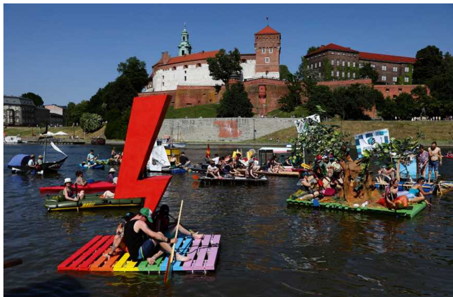
• Wodna Masa Krytyczna, coroczna impreza organizowana na Wisłę przez krakowskich artystów i miłośników miasta. W tle Zamek Królewski na Wawelu