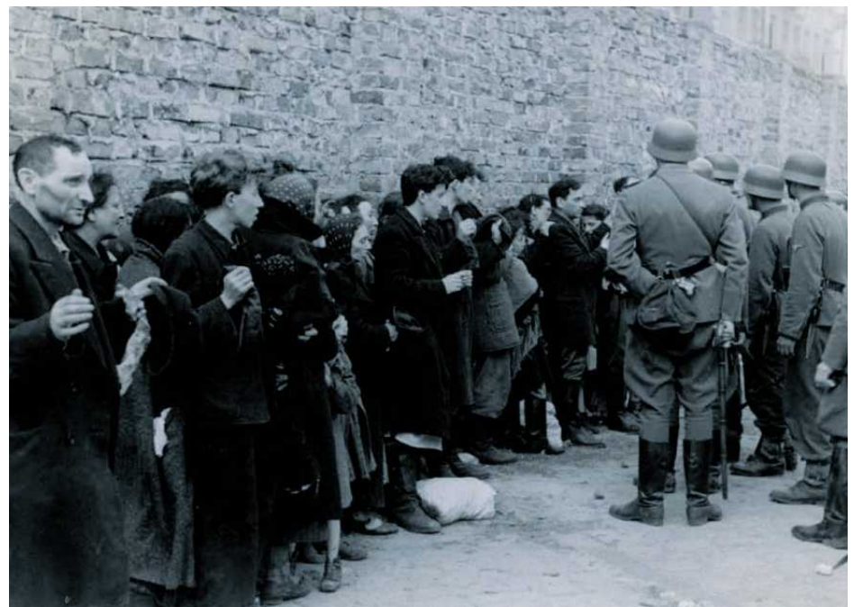
• Żydzi z warszawskiego getta tuż przed odprowadzeniem na Umschlagplatz. Zdjęcie pochodzi z raportu Jürgena Stroopa, który dowodził likwidacją getta

piasku osobno szaleje ze strachu przed porywem, mogącym je w każdej chwili pochwyć, przed uderzeniem, które może je w każdej chwili zmiążyć, komunikuje się z sąsiednim ziarnem tylko infekcją tego beznadziejnego, ślepego dygotu.