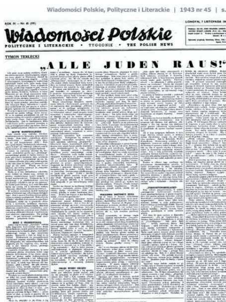
• Tekst Tymona Terleckiego w „Wiadomościach Polskich, Politycznych i Literackich”

Przy takim przygotowaniu, w takich „strategicznie” wytworzonych okolicznościach przebieg kampanji w ghecie warszawskim był jeszcze jednym tryumfem metody brutalności i miazdzącego tempa „Vernichtungsschlacht” [bitwy niosącej zagładę]. Zrazu