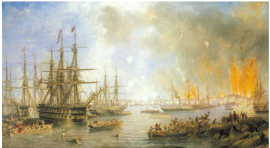
• „Bombardowanie Sewastopola”, obraz Johna Wilsona Carmichaela z 1858 r.

Ale o ile w 1854 r. miał poparcie prasy, o tyle teraz nastroje na Zachodzie się odwróciły. We Francji Napoleon III był już