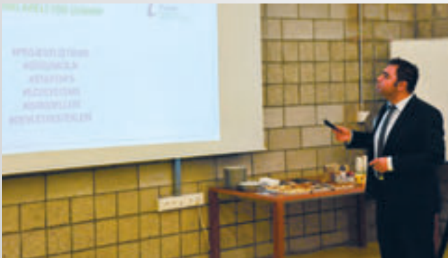
Yeni Ürün Geliştirmede Silikon Vadisi Perspektifinden Yaratıcılık ve Girişimcilik Eğitimi