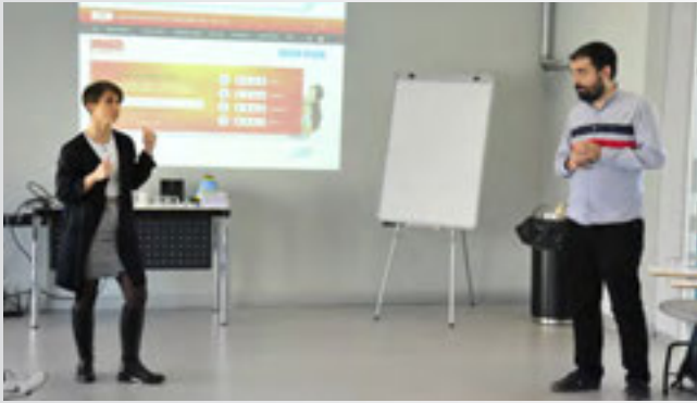
Sosyal Girişimciliğe Giriş Atölyesi

Şubat 2016 itibarıyla Türkiye'de işsizlik oranları %10.9'a ulaşmıştır ve bu rakamın daha fazla artmaması için Türkiye'nin alternatif çözüm yolları üzerinde çalışması gerekir. Özellikle Türkiye gibi gelişmekte olan bir ülke için, toplumda değer yaratmayı hedefleyen sosyal finans pazarının oluşturulması bu çözümlerden en önemlileri arasında yer alır. Lüleburgaz'da gençlere yönelik düzenlenen Sosyal Girişimciliğe Giriş Atölyesi, gençlerin sosyal girişimcilik konusunda bilgi seviyelerini arttırmalarını ve dünyanın daha iyi bir yer olması için lider olma potansiyellerinin farkına varmalarını hedefledi. Atölye çalışması sırasında gençler kendi hayatlarında deneyimledikleri ya da gözlemledikleri toplumsal sorunları tespit ettiler ve bu sorunların çözümü için yaratıcı fikirler ürettiler. Bu sayede gençler kendi yaşadıkları sorunlar üzerinde dönüştürücü güçleri olduğunu fark ettiler ve toplumda aktif bireyler olma konusunda bilinçlendiler. Atölyenin sonunda katılan her gence katılımcı sertifikası verildi.