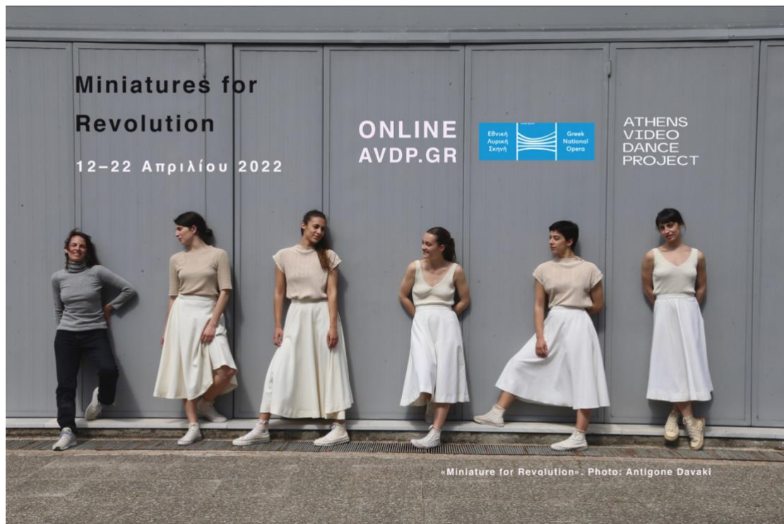
«Miniature for Revolution»

Το video dance φεστιβάλ Μινιατούρες για την Επανάσταση αποτελεί τη νέα παραγωγή των Εκπαιδευτικών & Κοινωνικών Δράσεων της ΕΛΣ. Με αφορμή την ιδέα της επανάστασης, πέντε νέοι συνθέτες και πέντε νέοι χορογράφοι συνεργάστηκαν και δημιούργησαν έργα μουσικής και χορού σύντομης διάρκειας, τις Μινιατούρες . Οι Μινιατούρες αποτυπώθηκαν σε πρωτότυπα βίντεο και έρχονται στην οθόνη της GNO TV. Η παραγωγή πραγματοποιήθηκε σε συνεργασία με το Μπαλέτο και τη Διαπολιτισμική Ορχήστρα των Εκπαιδευτικών & Κοινωνικών Δράσεων της ΕΛΣ. Στην παραγωγή συμμετείχαν επίσης πέντε κινηματογραφιστές καθώς και νέοι επαγγελματίες χορευτές.