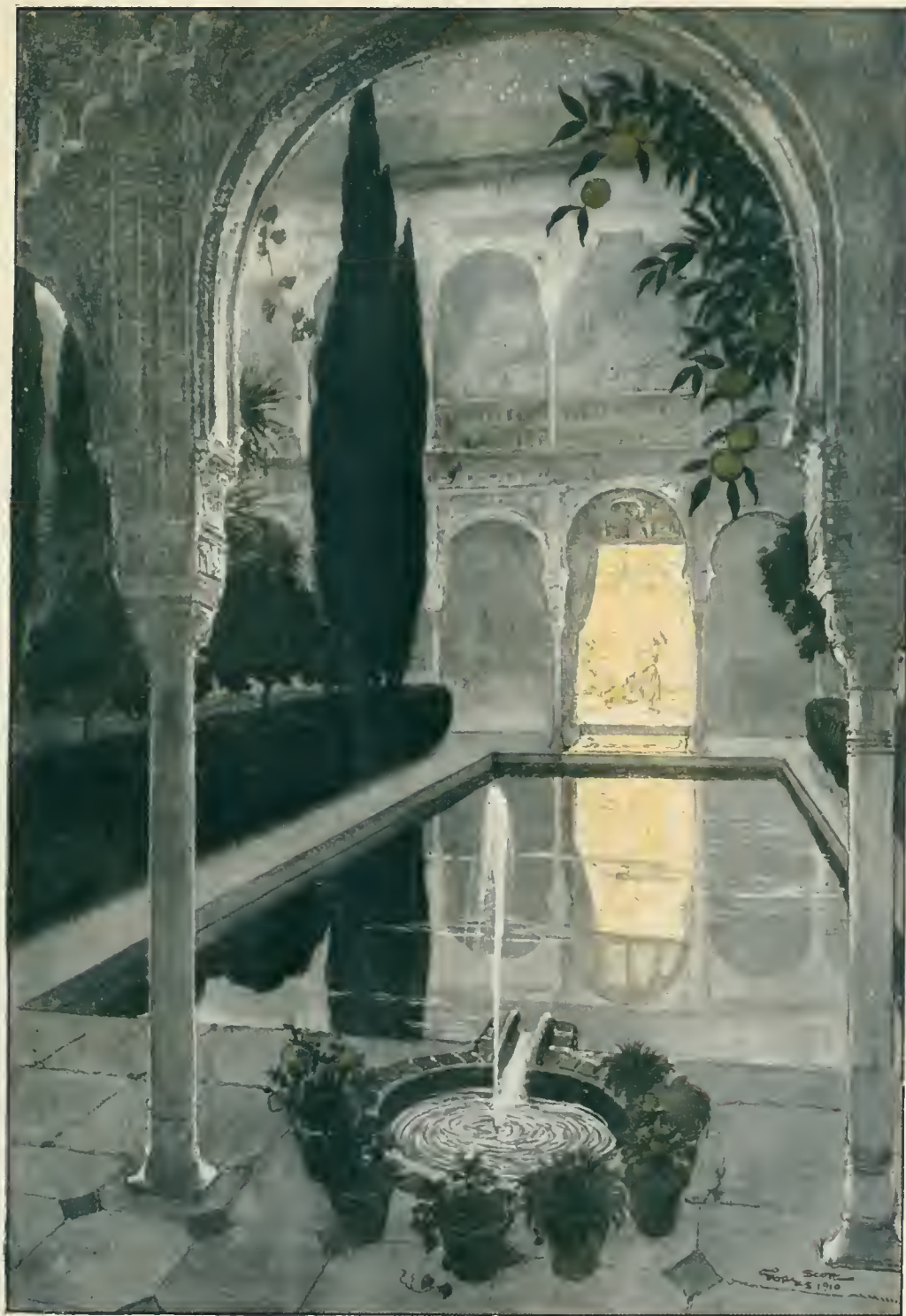
Sur les bords des bassins de marbre blanc, où jaillissaient des eaux vives, croissaient et se mêlaient des arbustes de multiples espèces... C'était l'heure du repas du soir.