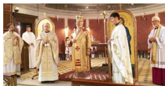
На сторінці 6 знайомимо наших читачів з історією греко-католицького душпастирства в Данії