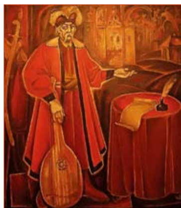
Левко Воєдило. Іван Мазепа