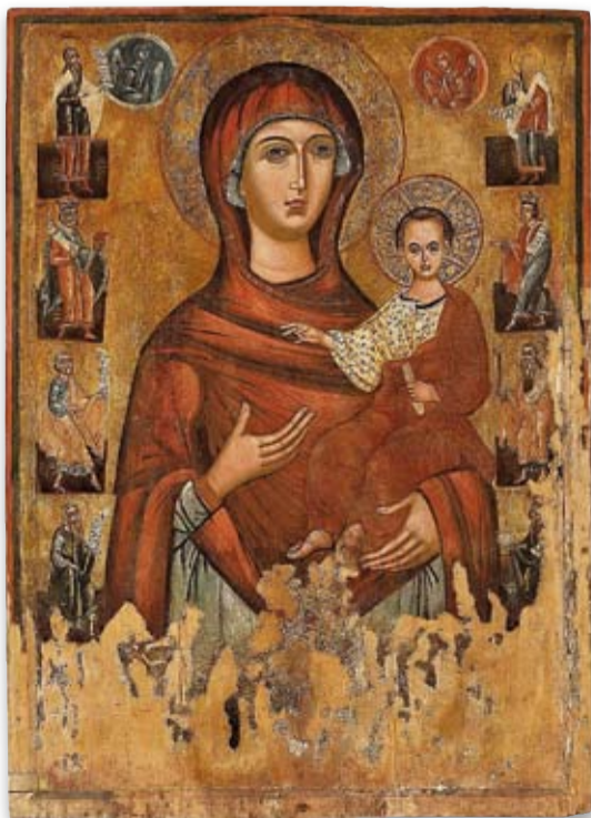
Мати Божа-Одигітрія зі знищеної після II світової війни церкви в Мощанцю (Закерзоння), нині в музеї в Сяноці (Польща). Церкву побудовано на місці старої в 1834 році