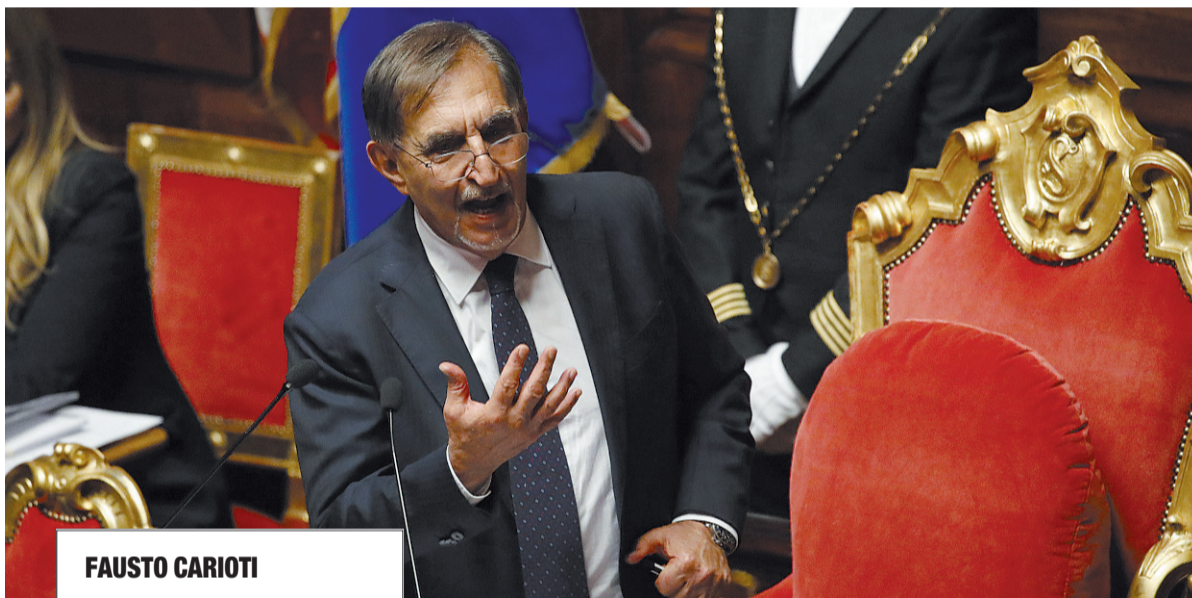
Il presidente del Senato, Ignazio La Russa