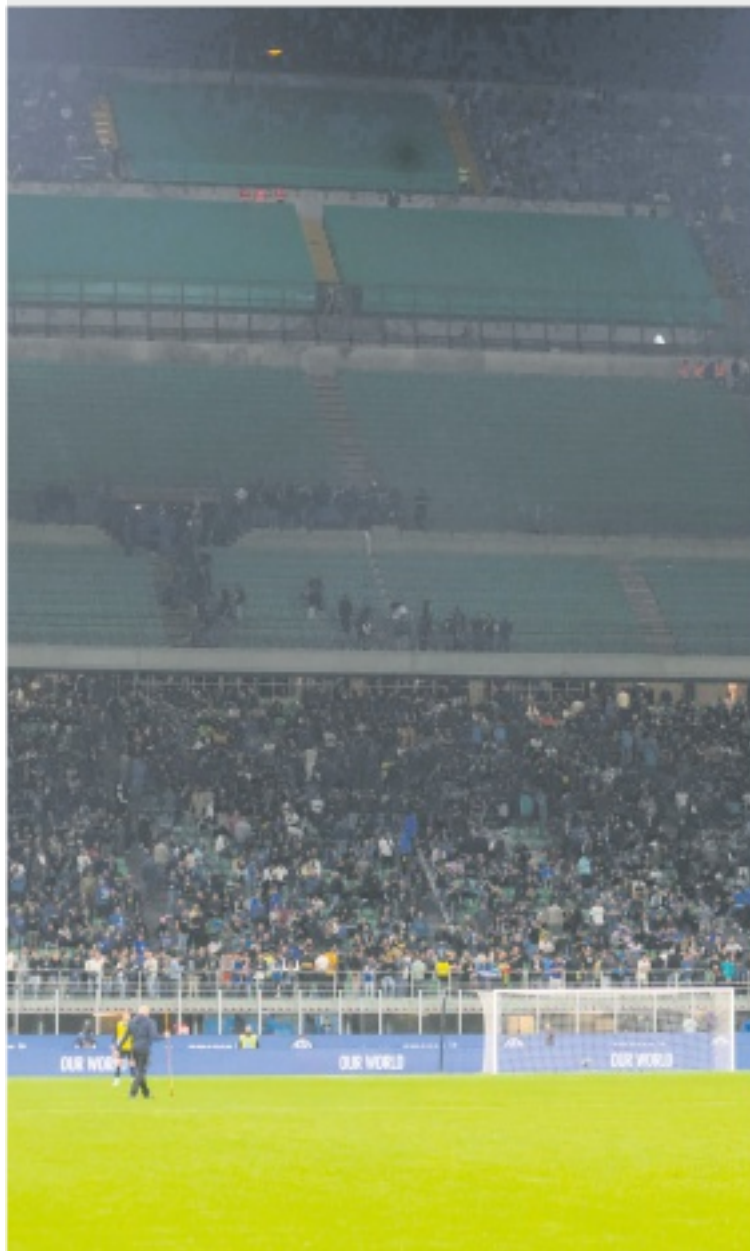
FUORI I tifosi dell'Inter lasciano la curva per la morte dell'ex capo ultrà