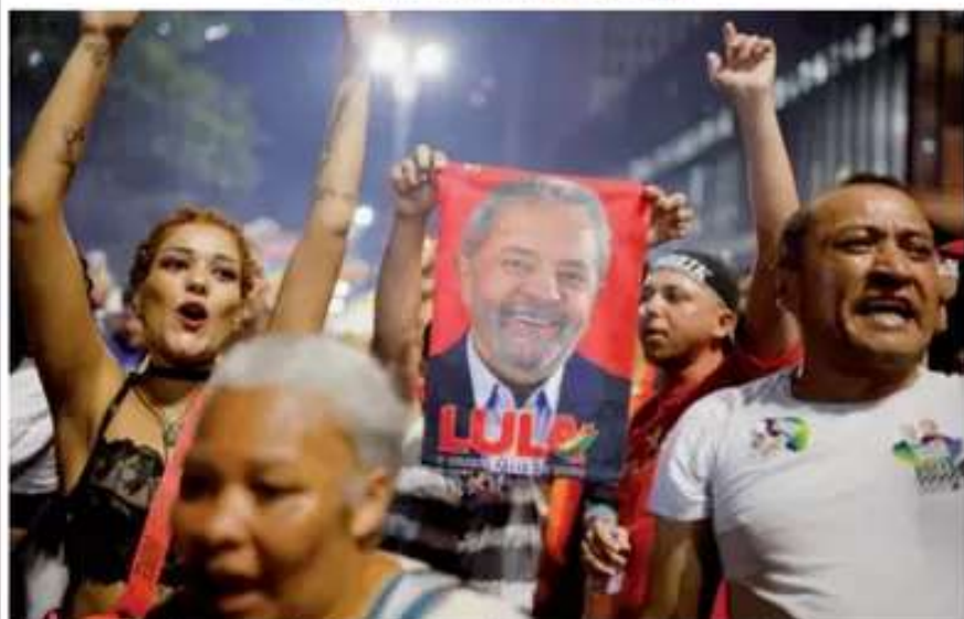
I sostenitori di Lula festeggiano a San Paolo il terzo mandato (non consecutivo) del presidente