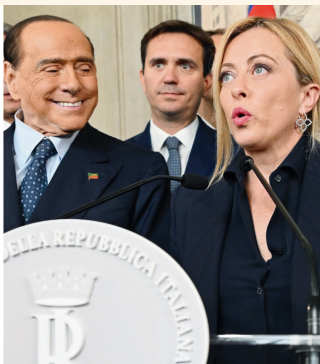
Destra contro destra Silvio Berlusconi e Giorgia Meloni

La presidente rinvia di due mesi la "riforma" penale per eliminare le norme - care a FI, Pd e Iv - che salvano dal processo e dal carcere gli accusati di furto, truffa, lesioni e sequestro di persona senza querela delle vittime. E il Caimano si smarca sull'Ucraina: "Inviare soldi, non cannoni"