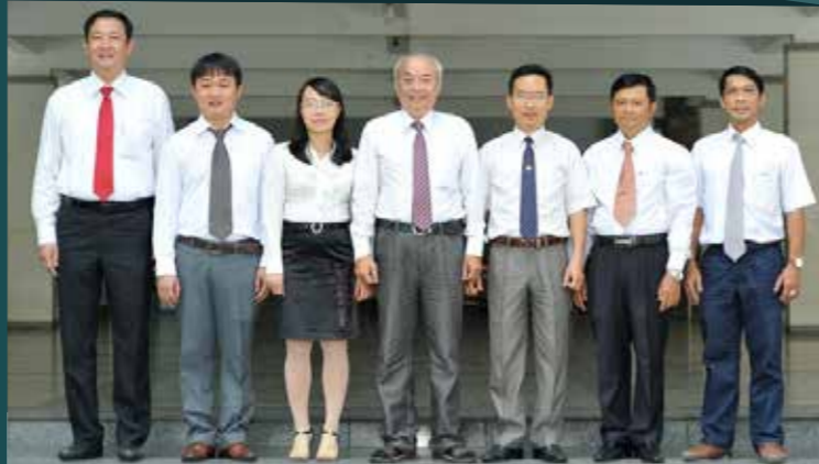
Ban lãnh đạo khoa

Sau gần 15 năm thành lập, BCN Khoa và tập thể giảng viên đã từng bước xây dựng Khoa ngày một ổn định và phát triển. Với đội ngũ giảng viên có chuyên môn và nhiệt huyết, tận tâm với sinh viên, với nghề.