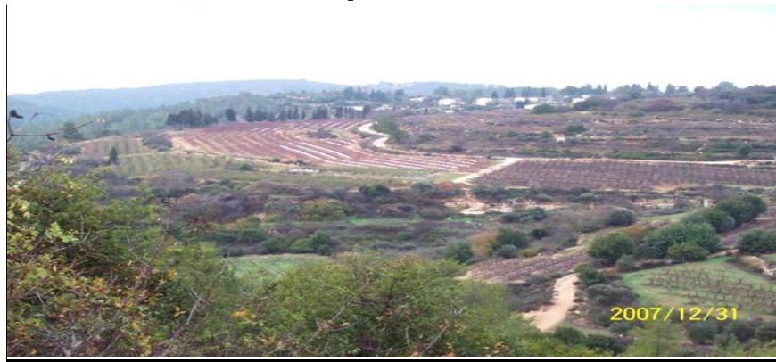
أراضي صوبا - لن يضيع حق وراءه مطالب