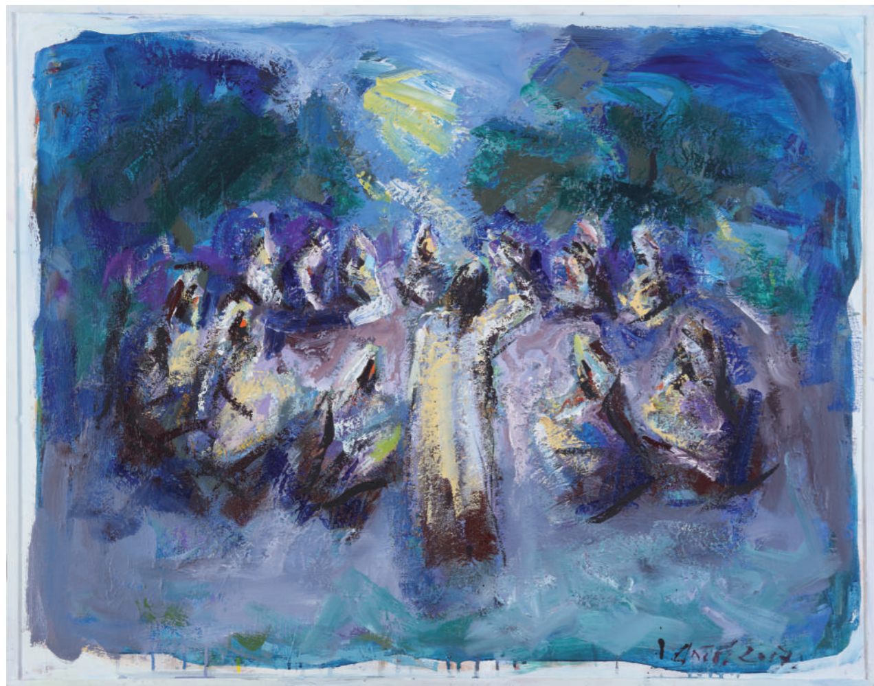
Noć prije 2019. ulje/platno 80 x 100 cm