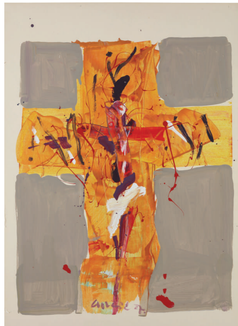
Transformacija 2007. akril/platno 80 x 60 cm