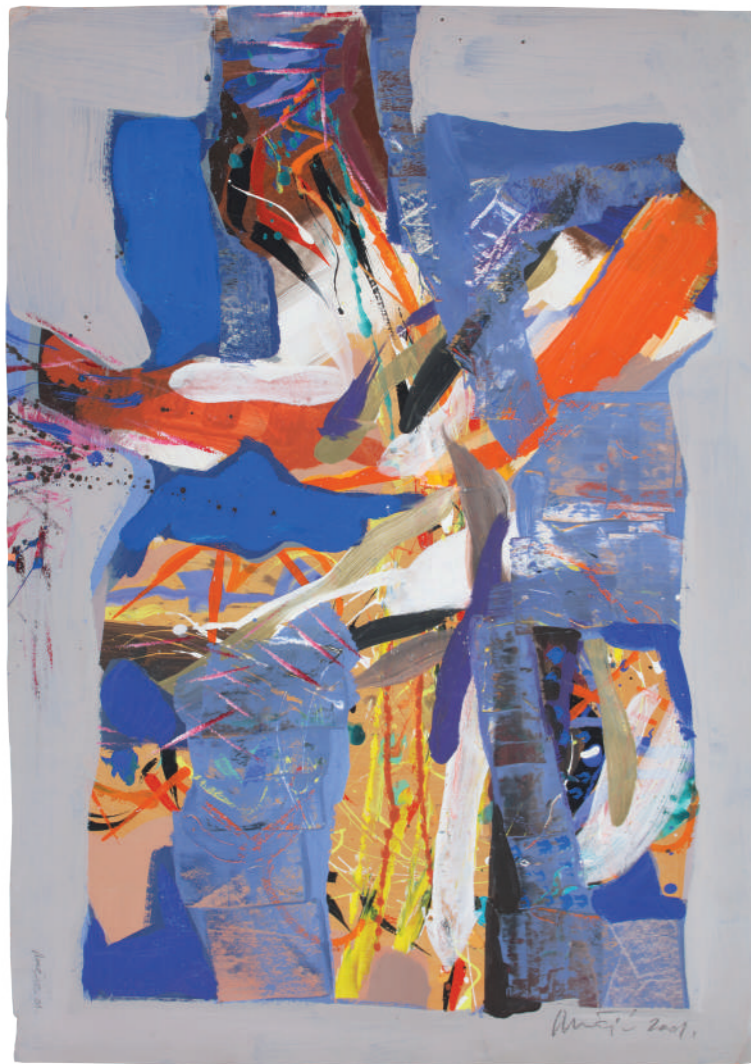
K nebu 2001. akril/platno 80 x 60 cm