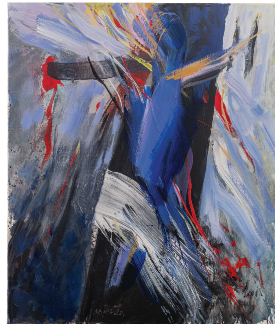
Raspeće 2020. akril/platno 70 x 50 cm