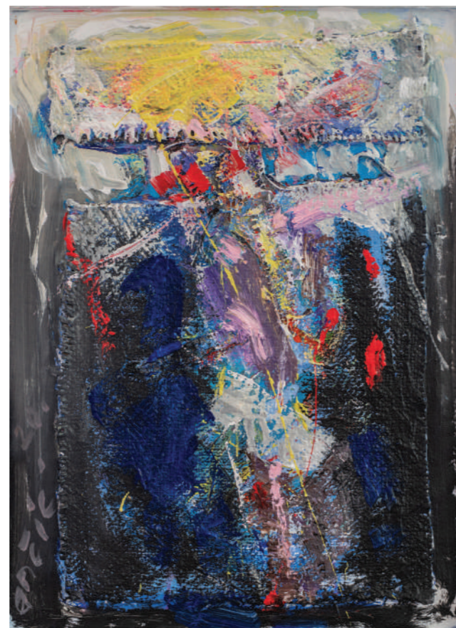
On odnosi grijeh svijeta 2020. ulje/platno 59 x 43 cm