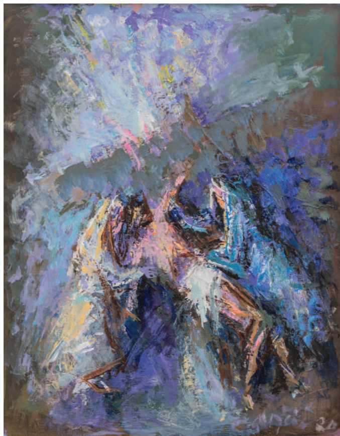
Skidanje s križa 2020. akril/platno 45 x 35 cm