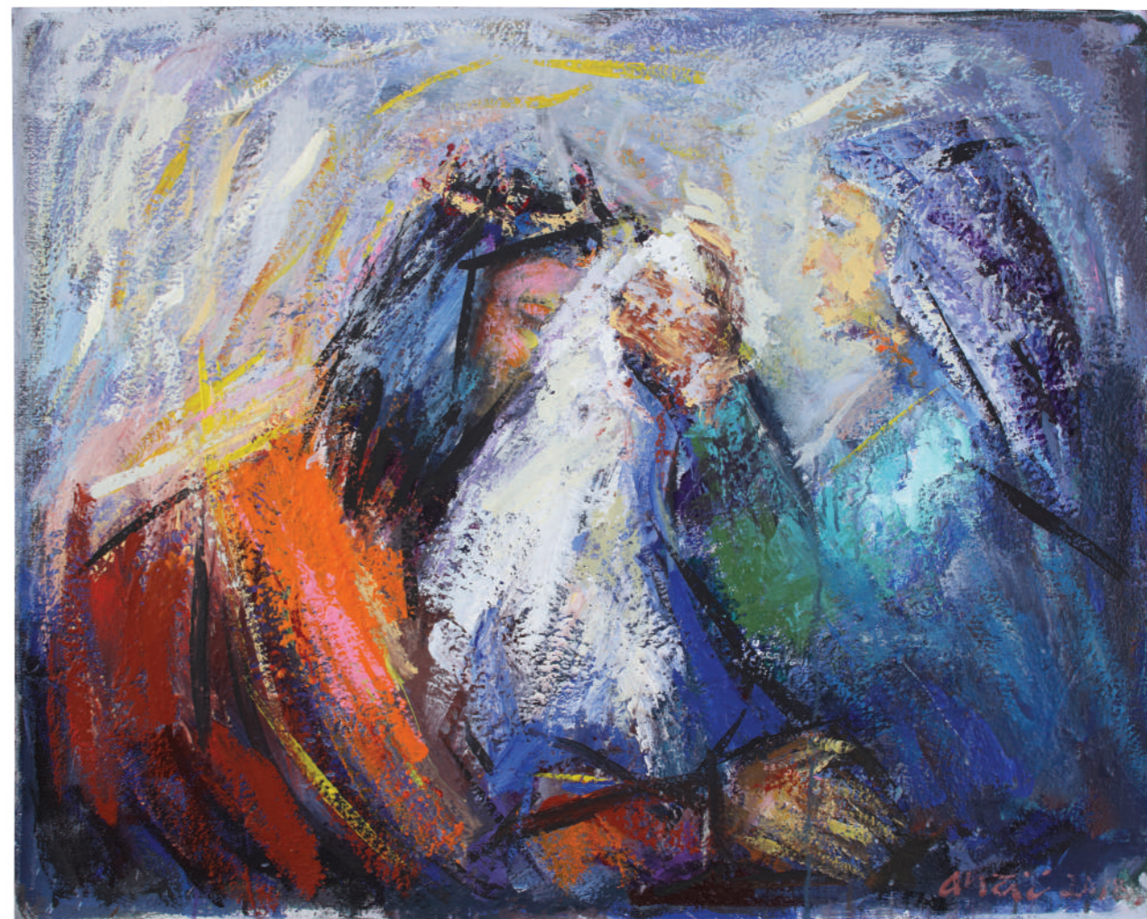
Veronikin rubac 2018. ulje/platno 80 x 100 cm