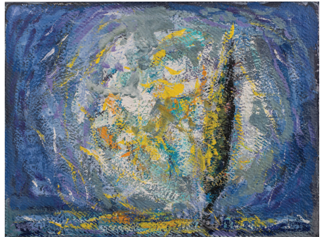
Ecce homo 2018. ulje/platno 58 x 78 cm