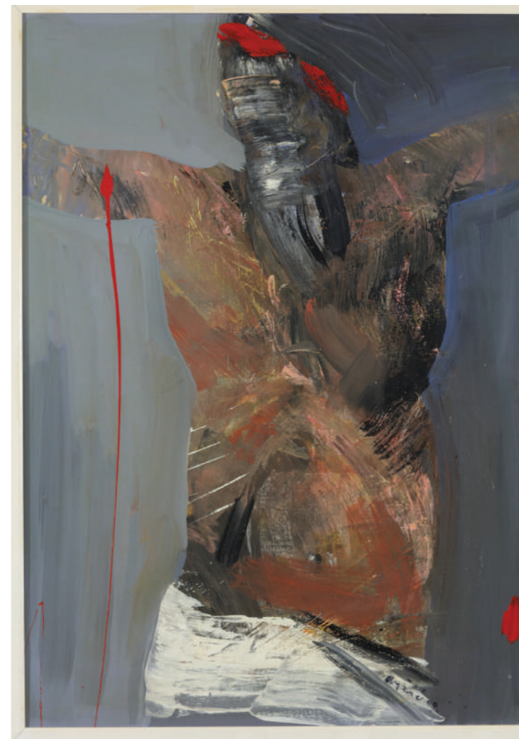
Oče oprostí im jer ne znaju što čine 2012. akril/platno 70 x 50 cm