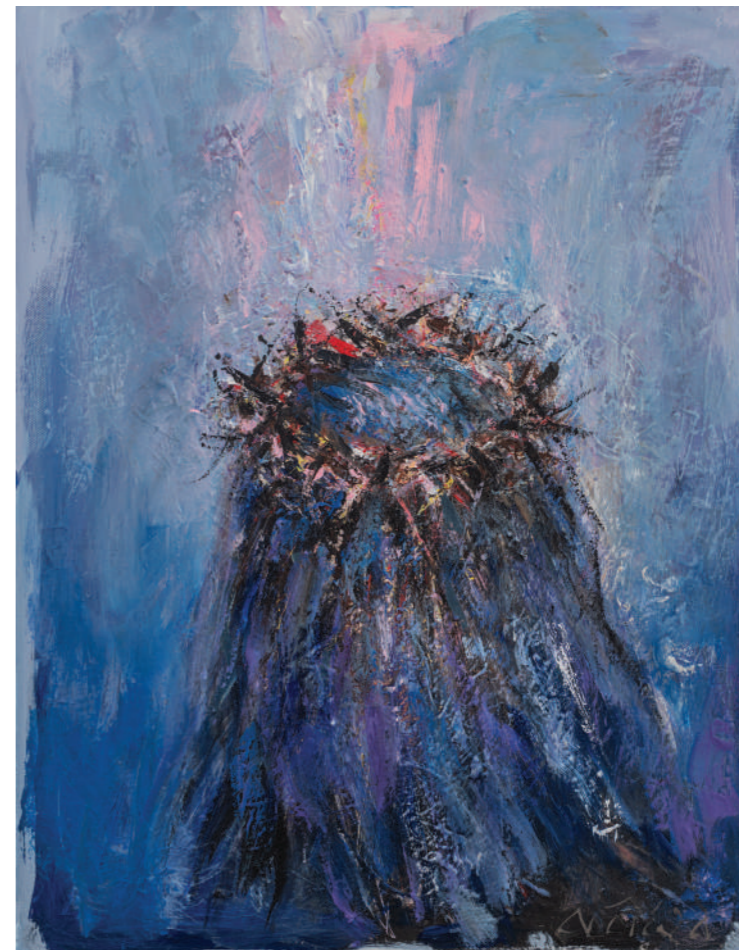
INRI 2020. ulje/platno 69 x 54 cm