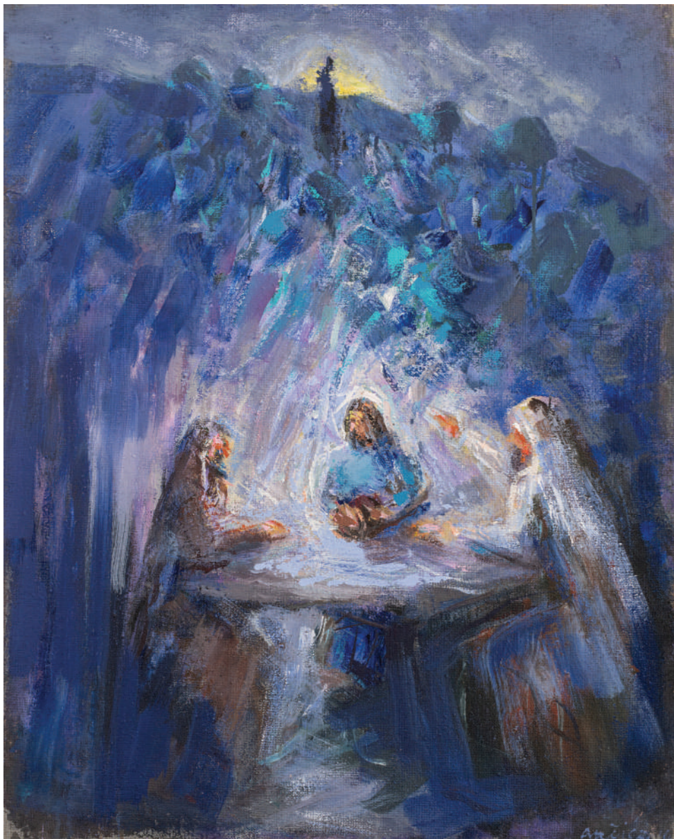
Za stolom u Emausu 2020. akril/platno 100 x 80 cm