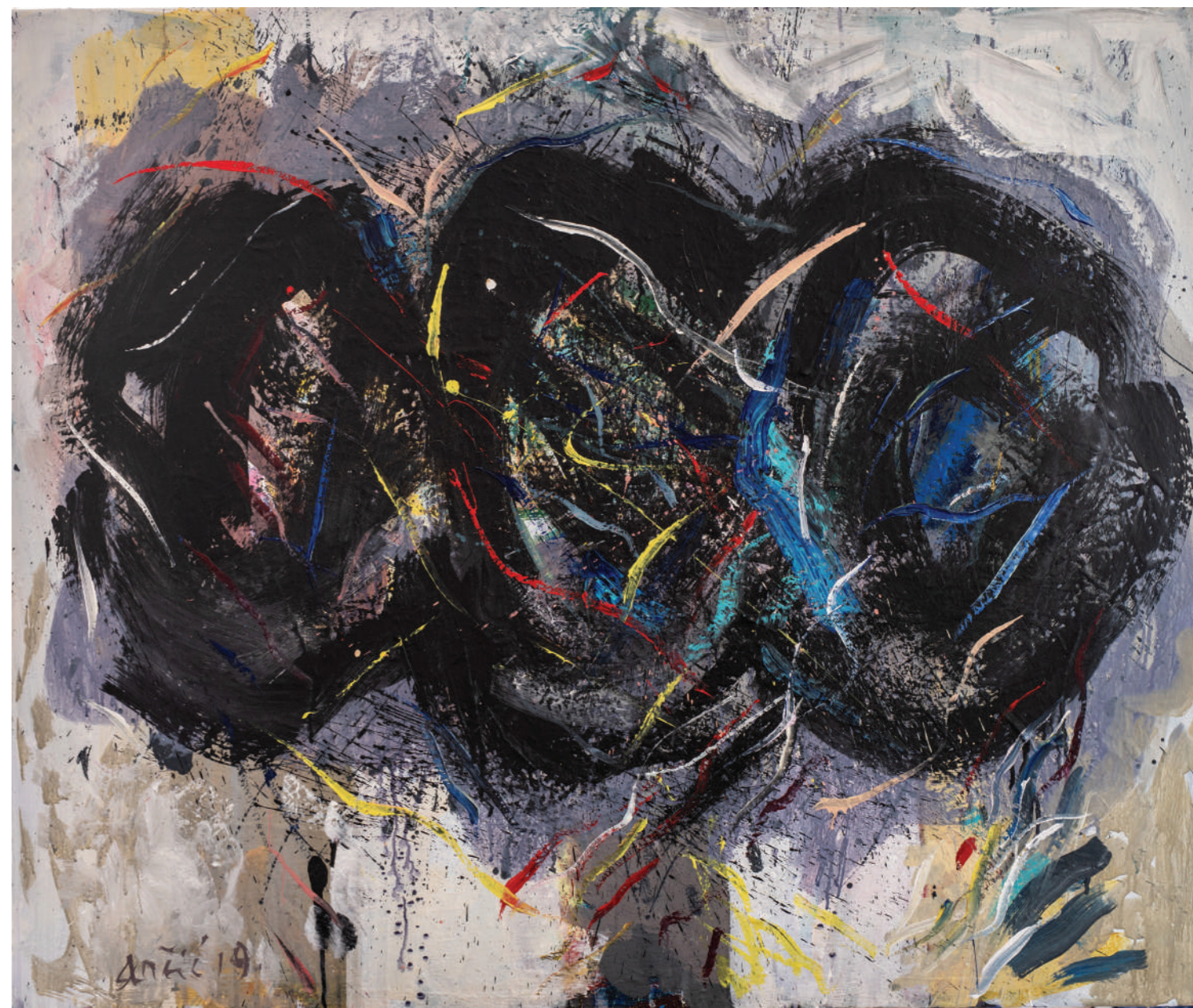
Tužni jecaj s maslinske gore 2019. ulje/platno 80 x 100 cm