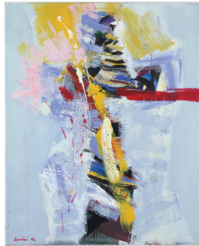
Muka 2002. akril/platno 100 x 80 cm