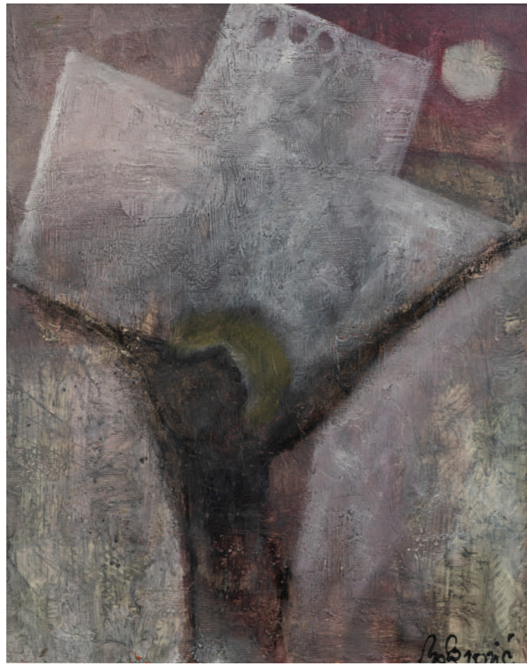
Petar - stijena kombinirana tehnika 65 x 79 cm