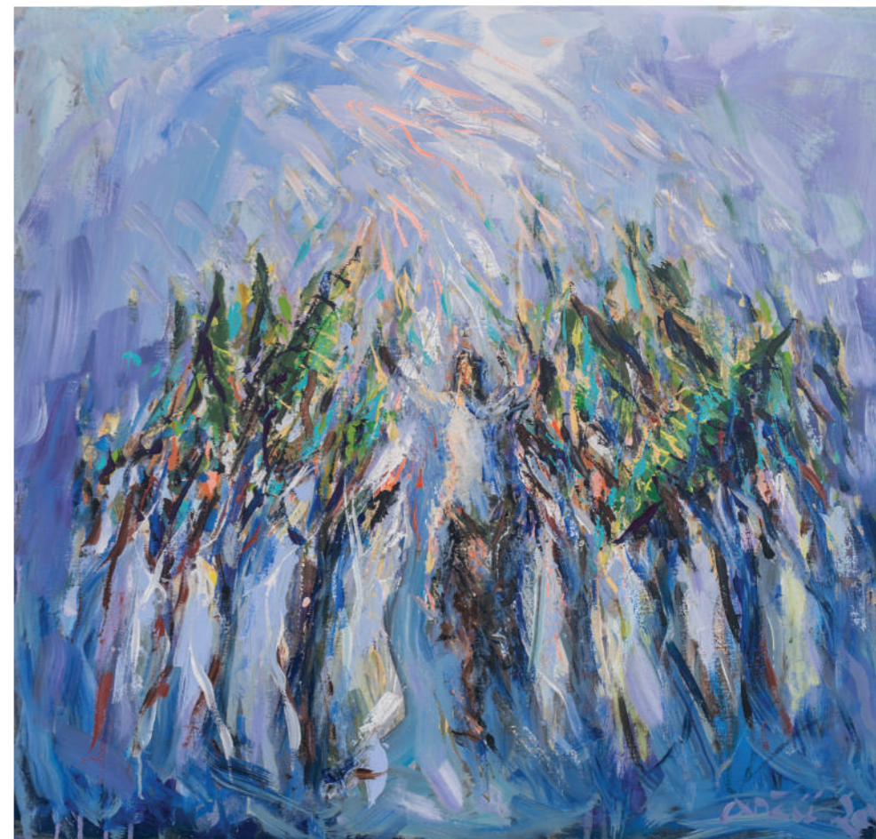
Ulazak u Jeruzalem 2020. akril/platno 76 x 80 cm