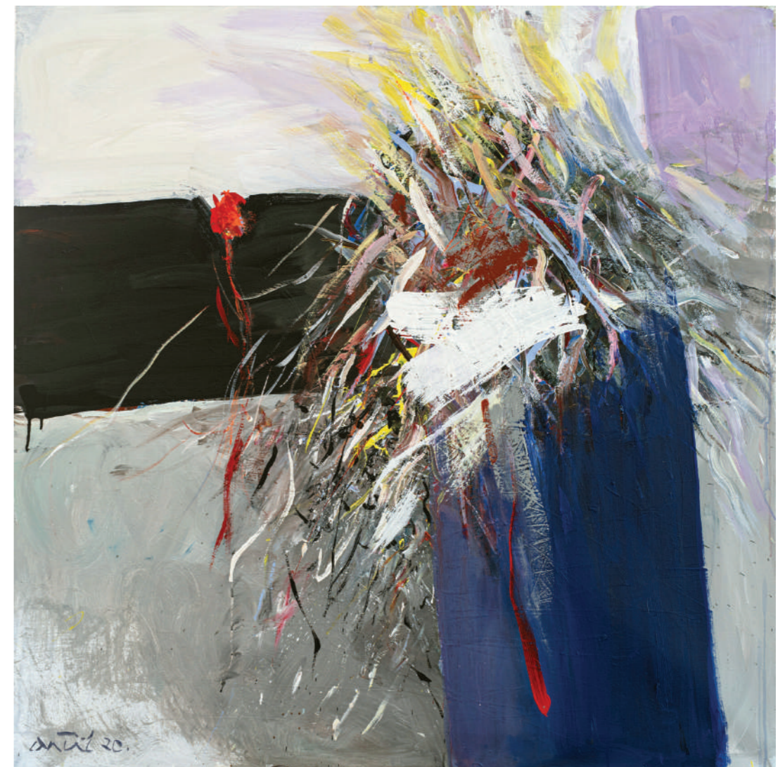
Ljubav pobijeduje bol 2020. akril/platno 120 x 120 cm