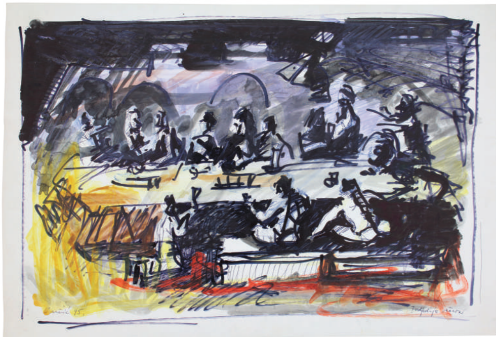
Posljednja večera 2000. crtež, kombinirana, papir 30 x 45 cm