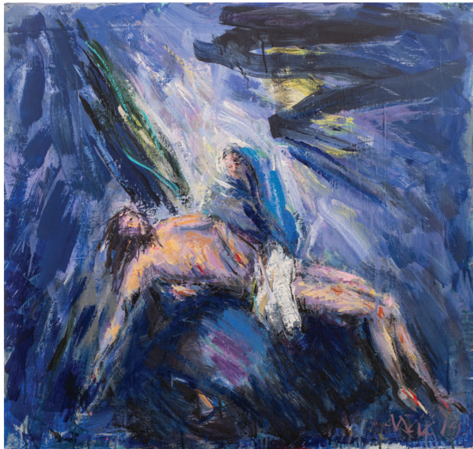
Pieta 2020. akril/platno 76 x 80 cm