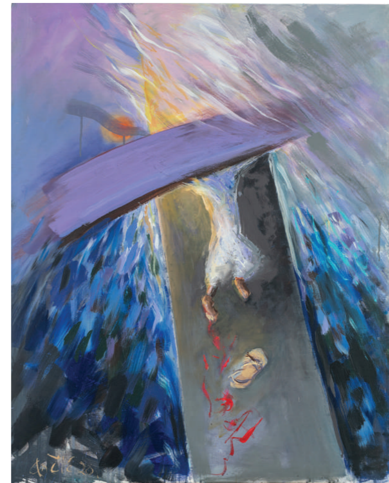
S krvlju ka uskrsnuću 2020. akril/platno 100 x 80 cm