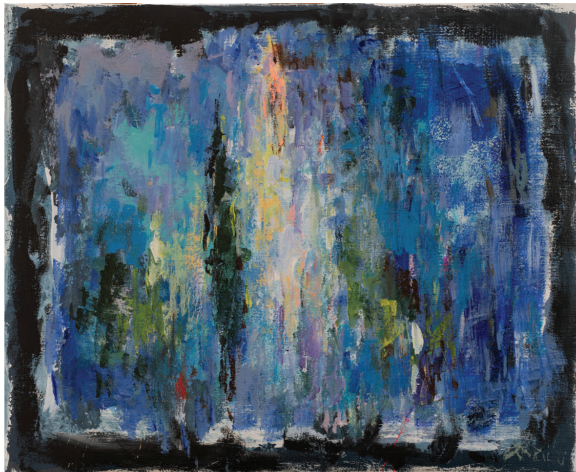
Petar - stijena kombinirana tehnika 65 x 79 cm