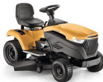
TORNADO 3108 HW