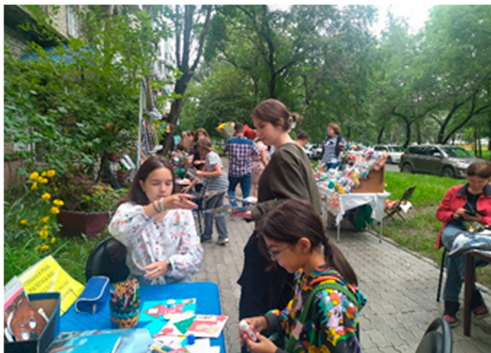
11 августа ЦГБ им. П.С. Комарова провела необыкновенный АРТ-бульвар