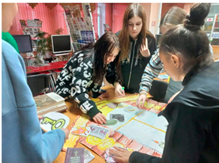
Работа с подростками - главное направление библиотеки-филиала №8