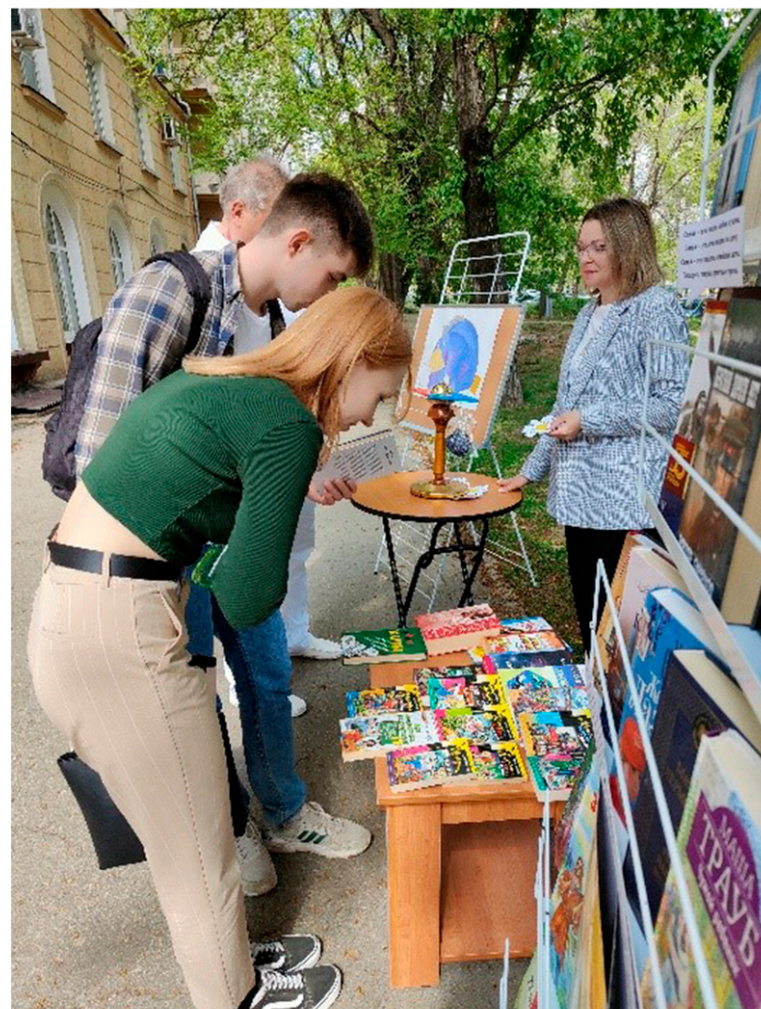
Библиотека-филиал №5. Библиотека под открытым небом