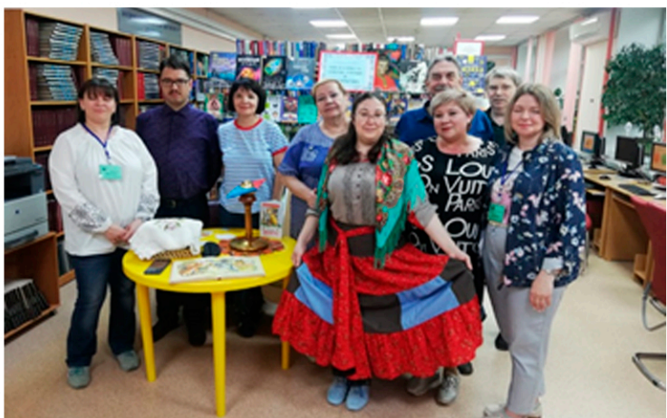
Всероссийская акции «Библионочь - 2023»