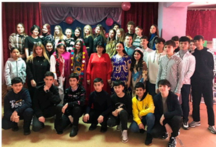
В библиотеке-филиале №8 встретили Навруз-байрам