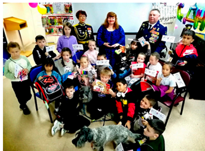
Для детей группы риска Центральная городская библиотека им. П. Комарова провела литературно-игровую программу «Пусть детство звонкое смеётся»