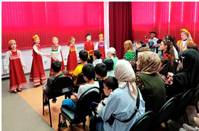
Концерт в Модельной библиотеке-филиале №4