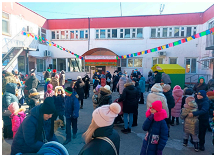
Масленица в библиотеке-филиале №3