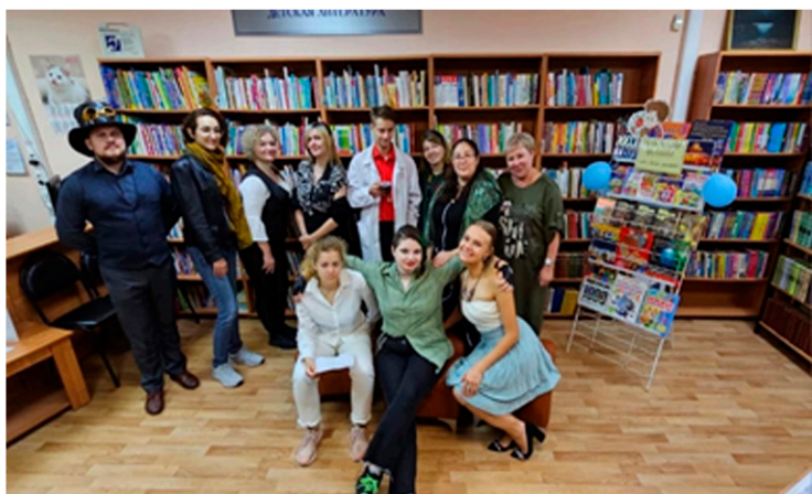
В 2023 году в ЦГБ им. П. Комарова вновь распахнула двери «Открытая площадка», объединившая молодежь. В сюжетно-ролевой игре проходят встречи, где участники проявляют свою находчивость и творческий подход