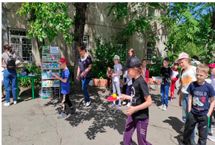
Занятость детей социального клуба в библиотеке-филиале №9