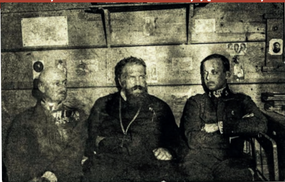
Ліворуч: барон Казимир Гужковський; митрополит Андрей Шептицький; ерцгерцог Вільгельм Габсбург. Село Кадлубиськ поблизу Бродів, зима 1917–1918 рр.