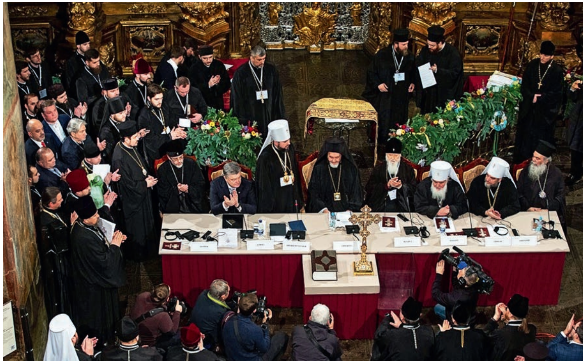
15.12.2018 р. у стінах древнього Софійського собору в Києві – кафедрального собору Київської Русі – відбувся об'єднавчий собор українських православних Церков, на якому обрали предстоятеля єдиної помісної Православної Церкви України, ним став митрополит Переяславський та Білоцерківський Епіфаній.

Проведення 15 грудня 2018 р. Об'єднавчого собору зі створення Помісної Православної Церкви та обрання її предстоятелем митрополита Епіфанія остаточно поклато край духовно-пануванню Москви в Україні, що продовжувалося понад три сторіччя. Така думка американського впливового видання Financial Times.