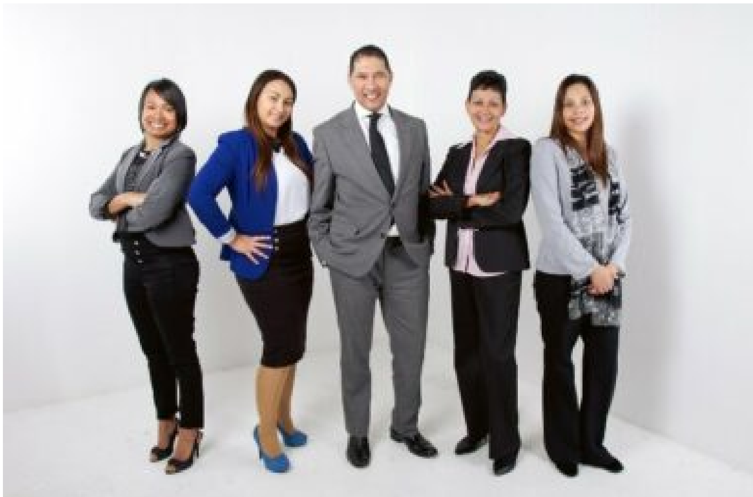
( https://www.business-leaders.net/global-shapers-alumni-der-nachwuchs-des-world-economic-forum-wef/ )