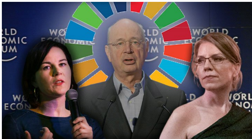
WEF Young Global Leaders – die Liste der Deutschen Teilnehmer

WEF Young Global Leaders – Die komplette Liste (verlinkt) und alle* deutschen Teilnehmer des Young Global Leaders Programm des WEF – World Economic Forum. Die Young Global Leaders des Weltwirtschaftsforum wurden von Klaus Schwab, dem Gründer des WEF bereits im Jahr 2004 ins Leben gerufen. Tausende Teilnehmer durchliefen bereits die „Kaderschmiede ( https://www.business-leaders.net/global-shapers-alumni-der-nachwuchs-des-world-economic-forum-wef/ )“ des World Economic Forum. Jetzt wurde eine Liste der bisher bekannten Absolventen der WEF-Kaderschmieden “Global Leaders of Tomorrow” und “Young Global Leaders” veröffentlicht. Das Young Global Leaders Forum zählt zu den einflussreichsten NGOs der Welt. Es zählt mittlerweile über 1.400 Mitglieder (Stand 01.02.22 ( http://younggloballeaders.org ))