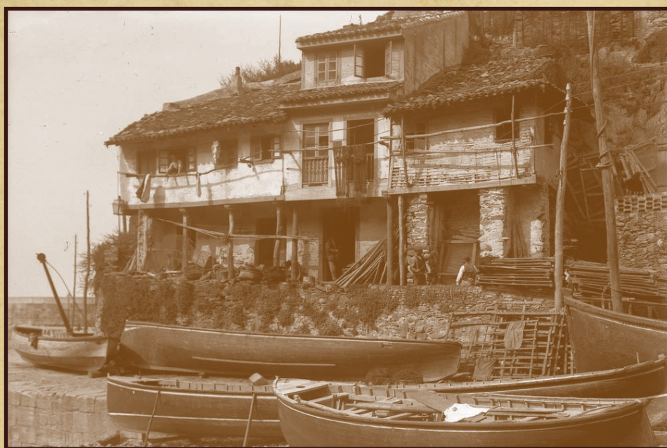
Casas de pescadores—Cudillero