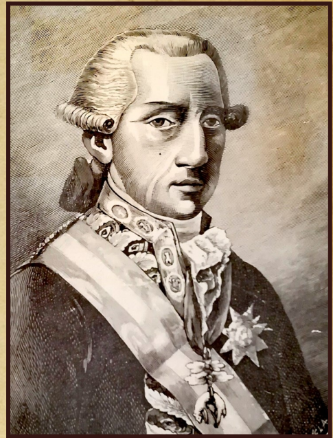
Grabado del Conde de Floridablanca