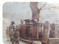
יומא דהילולא של הב"ח זי"ע